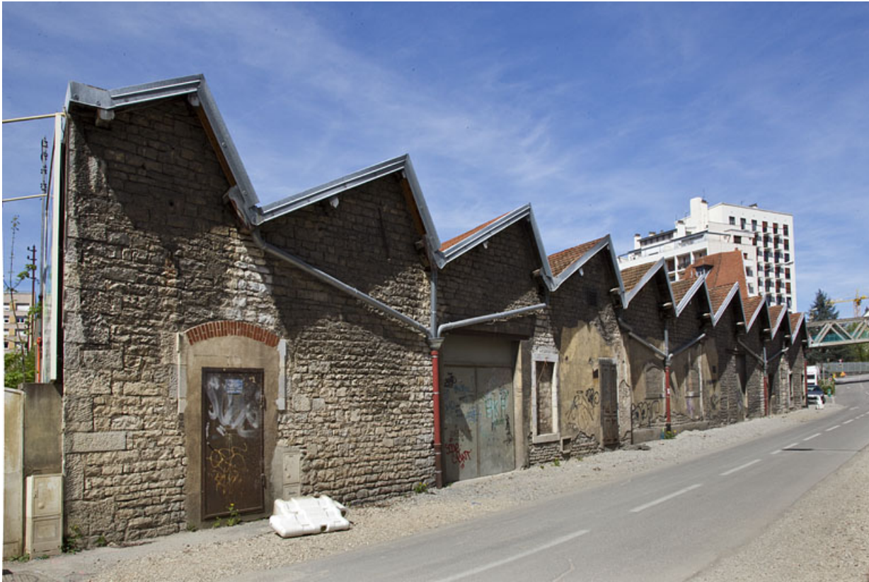
Atelier de fabrication boulevard Diderot : façade sur le boulevard, depuis le sud. 25, Besançon, 28 avenue Fontaine-Argent