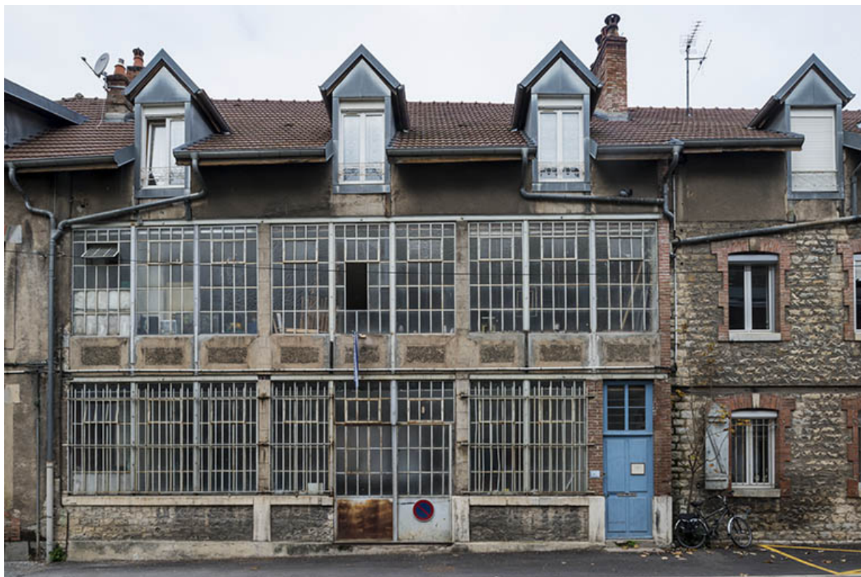
Ruelle de la Mouillère. Façade vitrée d'un atelier.