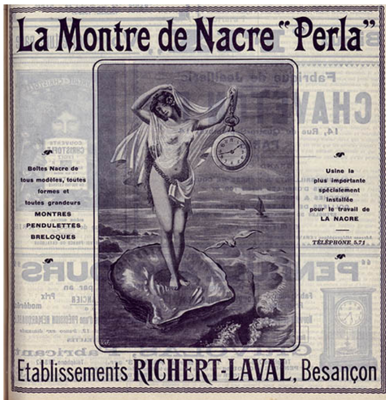
Montre de nacre Perla, publicité, 1910. 25, Besançon, 19 rue des Villas