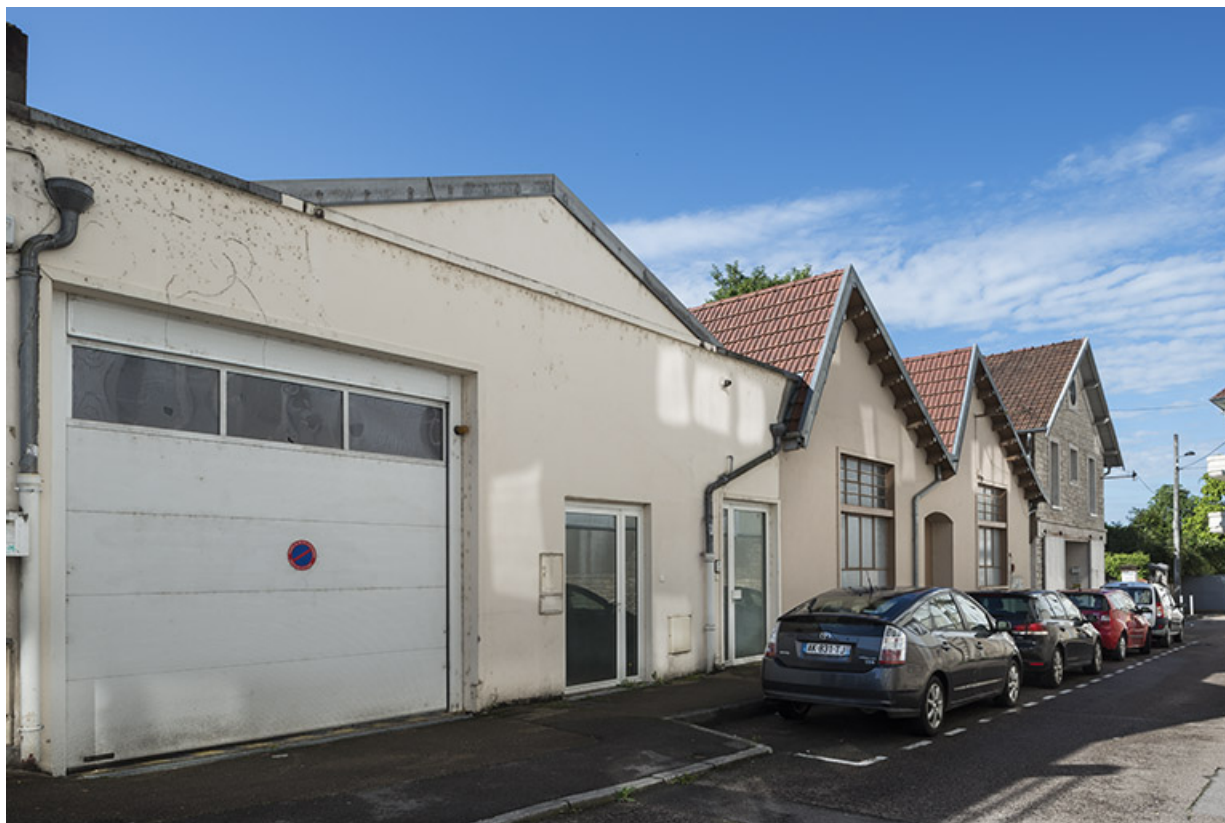
Façades postérieures (rue Klein).