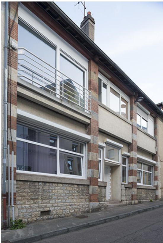
Façade antérieure vue de trois quarts gauche.