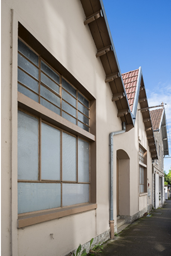
Détail des murs-pignons des sheds.