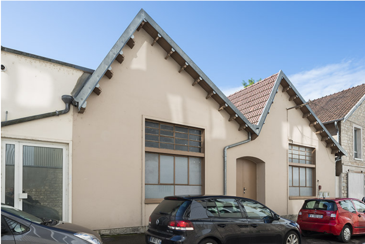
Murs-pignons des sheds sur le rue Klein.