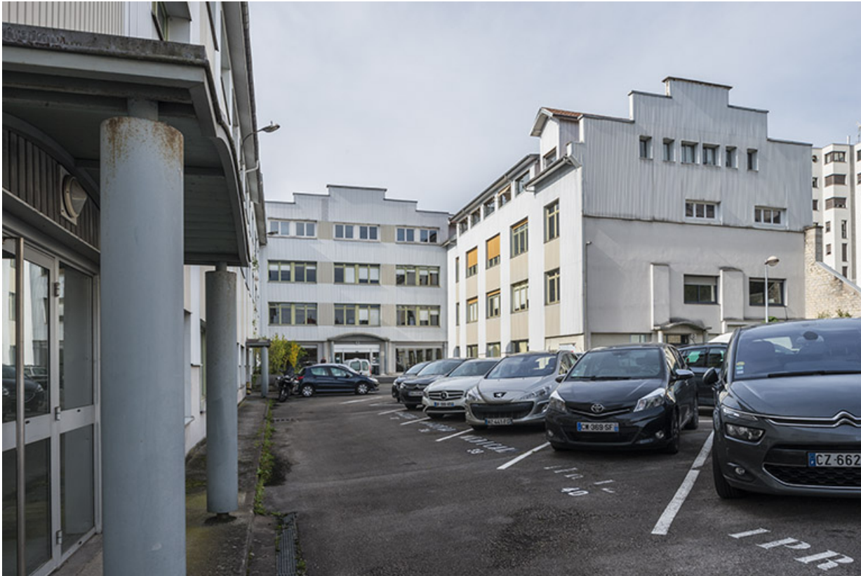
Bâtiment nord depuis la cour.