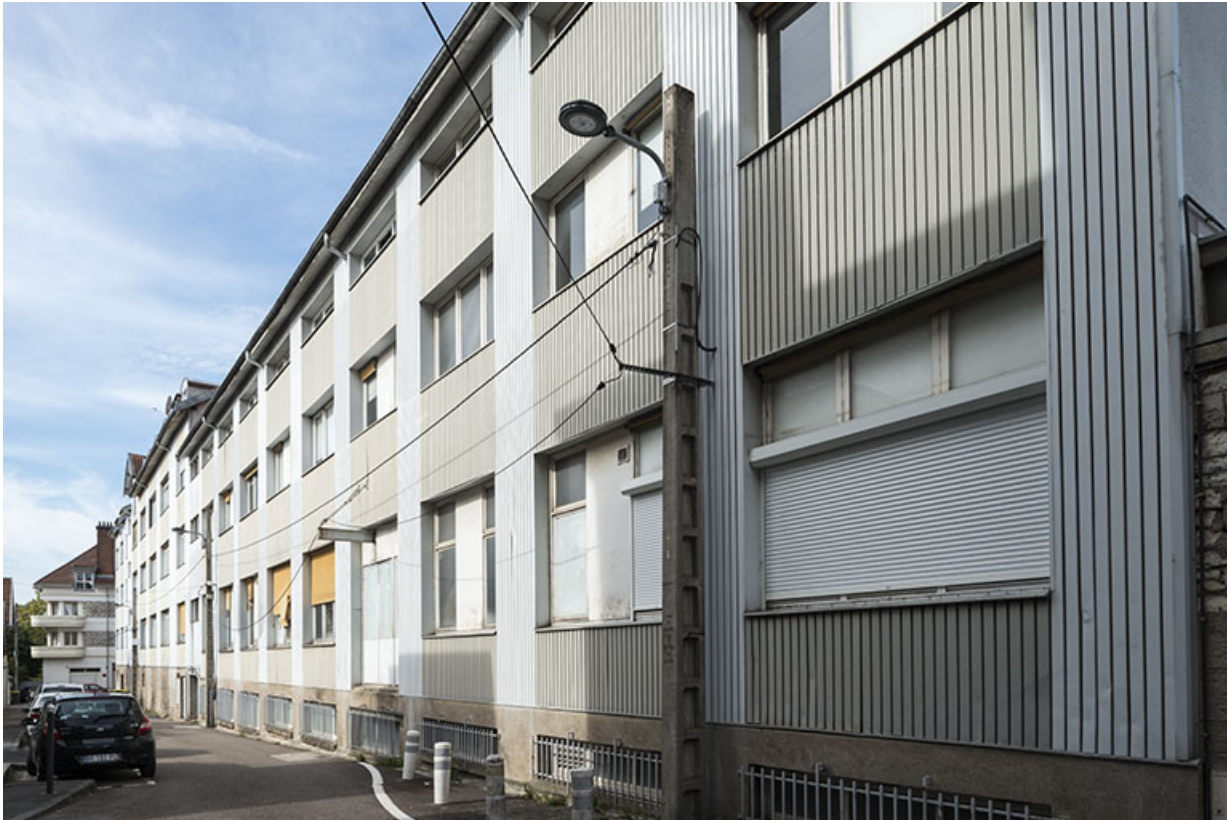
Façade du bâtiment sud.