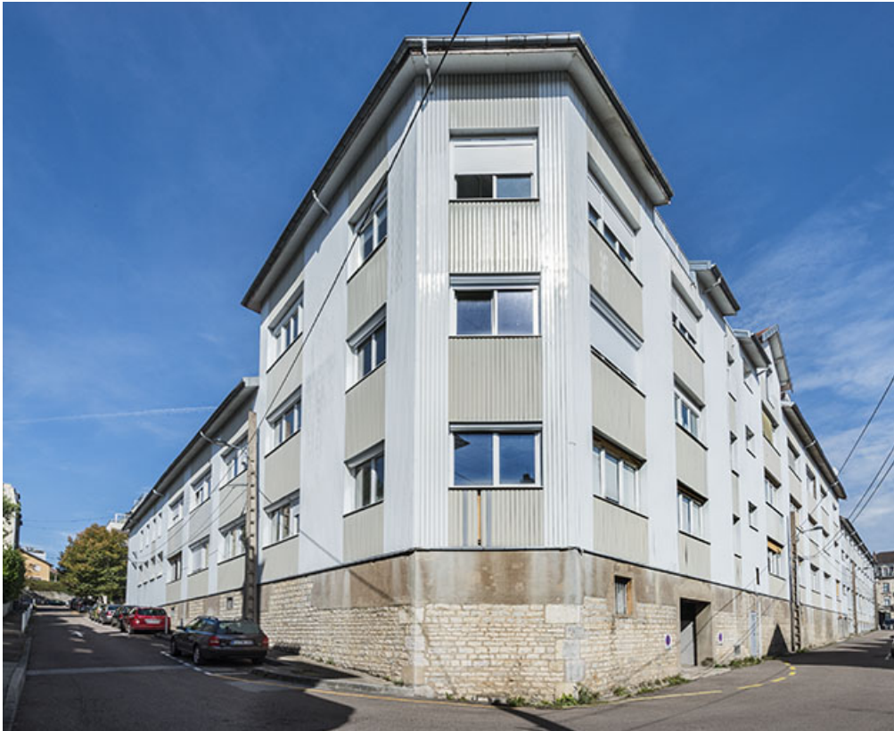
Vue perspective depuis l'angle de la rue Klein.