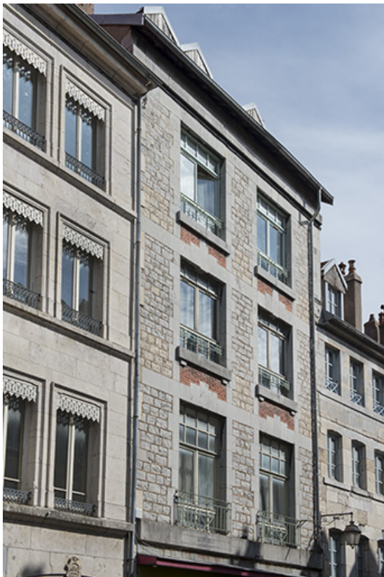
Façade vue de trois quarts gauche.