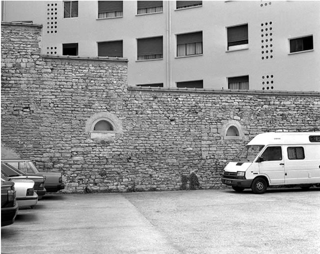
Cour : détail du mur de clôture droit.