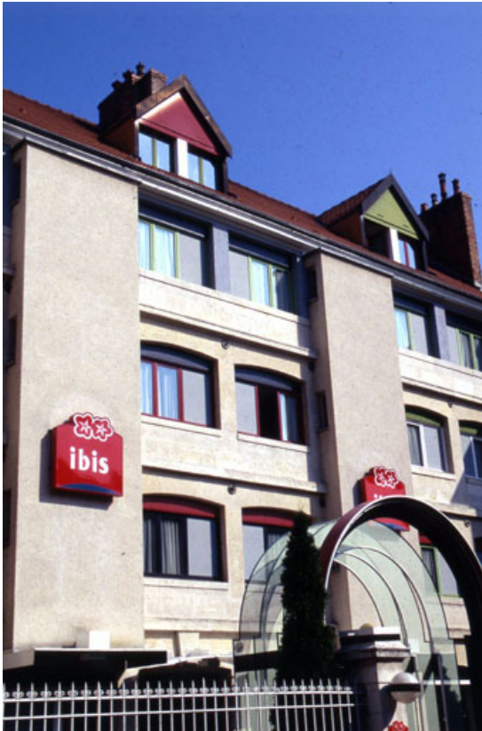
Façade antérieure : détail de la partie centrale.