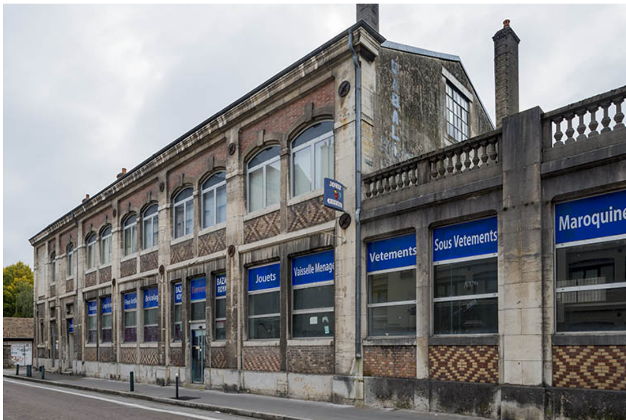
Vue rapprochée depuis le sud-ouest.