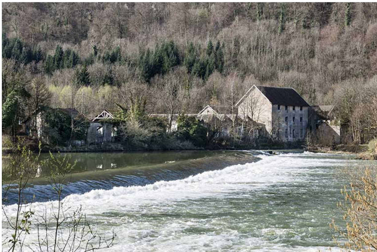
Vue rapprochée depuis la rive droite.