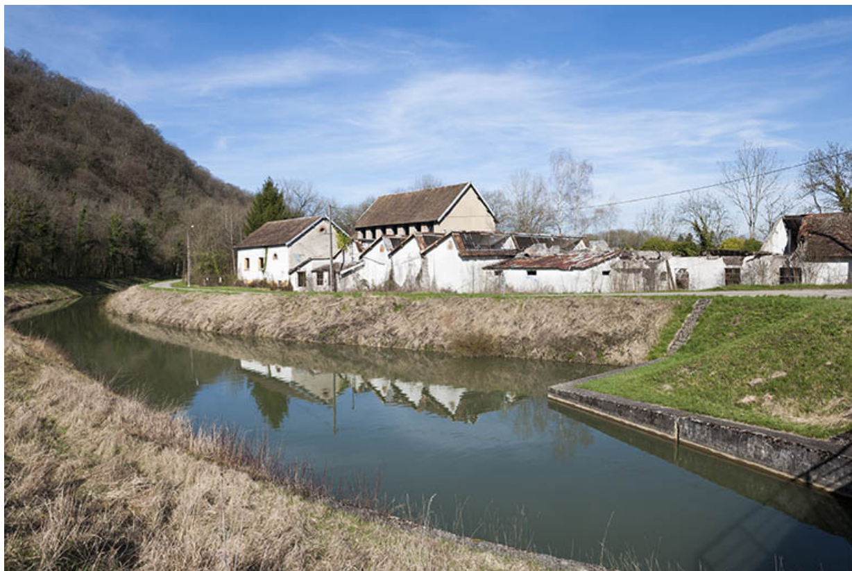
Vue d'ensemble depuis le pont franchissant le canal.