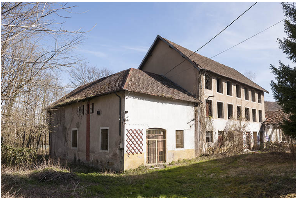
Le moulin vu de trois quarts.