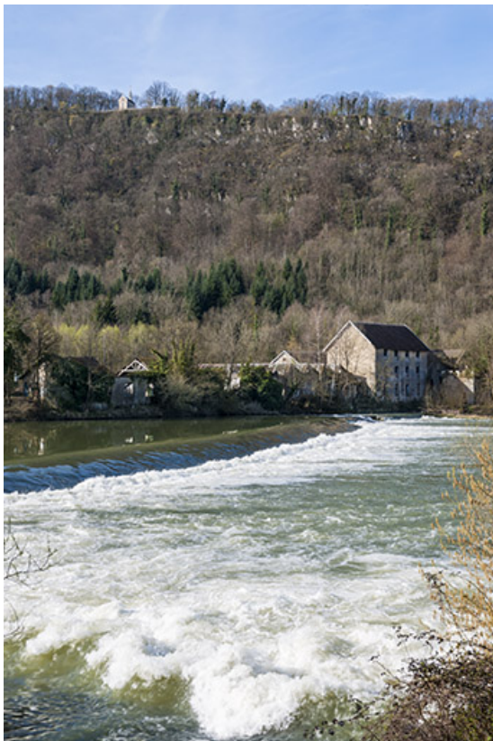
Vue d'ensemble depuis la rive droite.