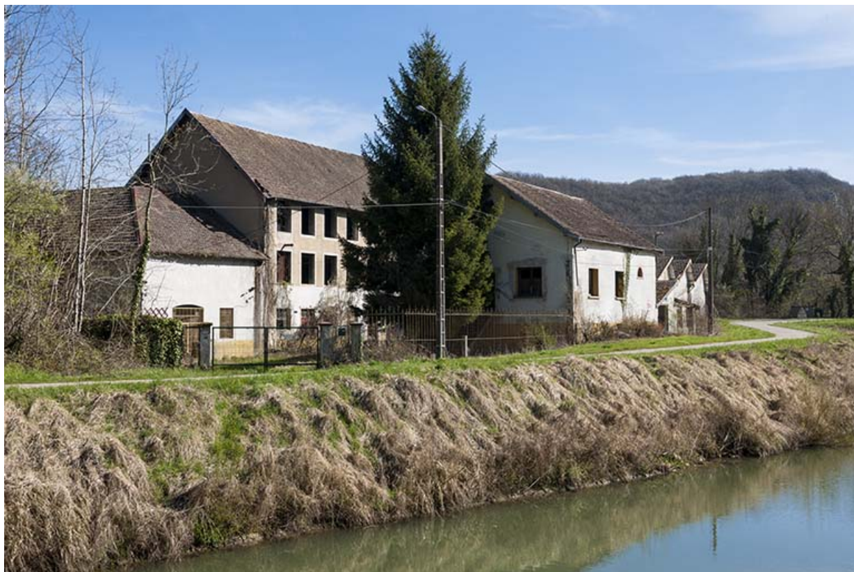
Vue de trois quarts depuis l'Eurovéloroute 6.