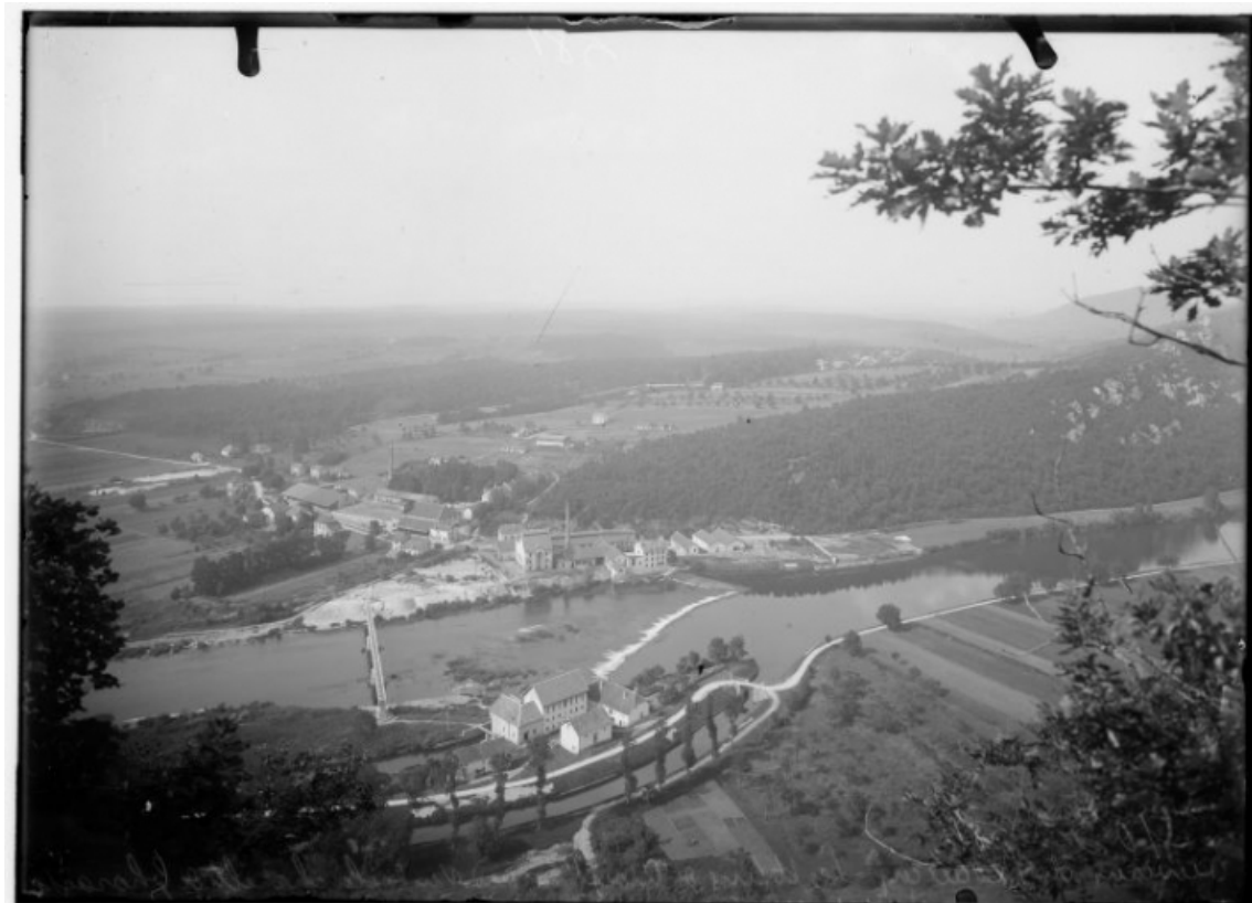
Vue plongeante depuis le sud, Manias phot., s.d. [début 20e siècle].