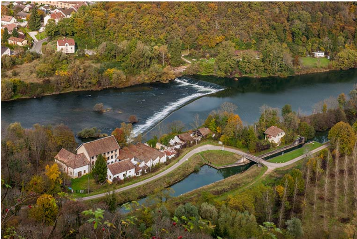
Vue plongeante depuis le sud-ouest.