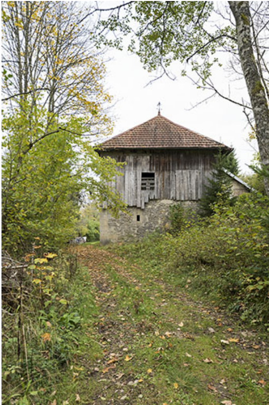
Scierie : façade sud.

25, Montlebon, 17 rue du Moulin, lieudit : Cornabey