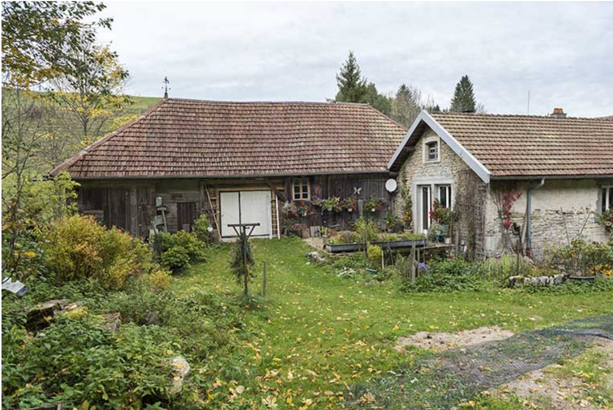
Scierie : façade est.

25, Montlebon, 17 rue du Moulin, lieudit : Cornabey