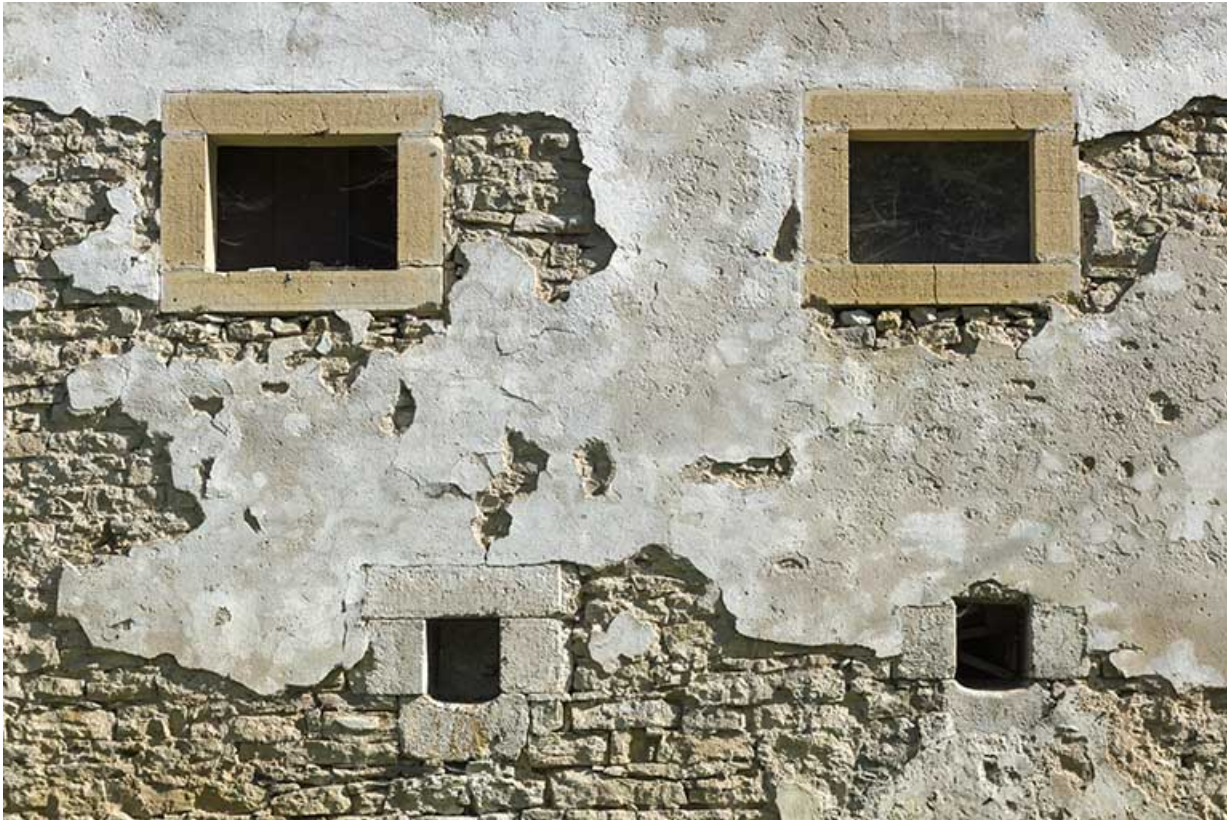
Moulin : fenêtres sur la façade ouest.

25, Montlebon, 17 rue du Moulin, lieudit : Cornabey