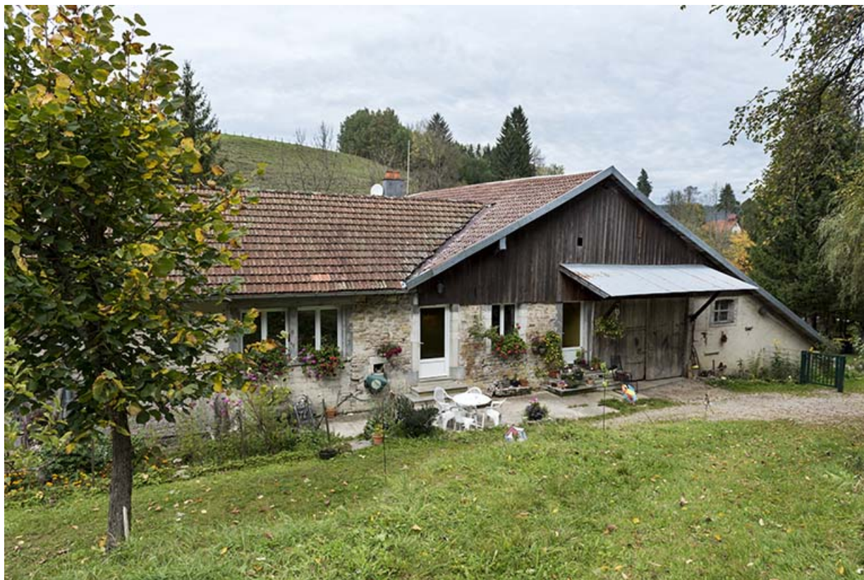
Moulin et logement : façade est.

25, Montlebon, 17 rue du Moulin, lieudit : Cornabey