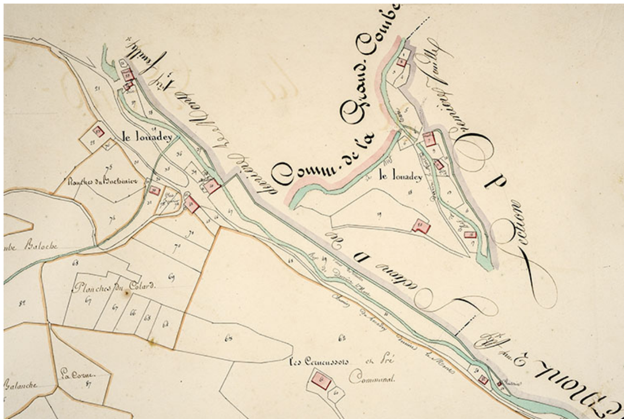
Cadastre de la commune de Montlebon. Atlas parcellaire, 1814, section E [détail : partie nord (le Louadey)], 1/2 500. 25, Montlebon