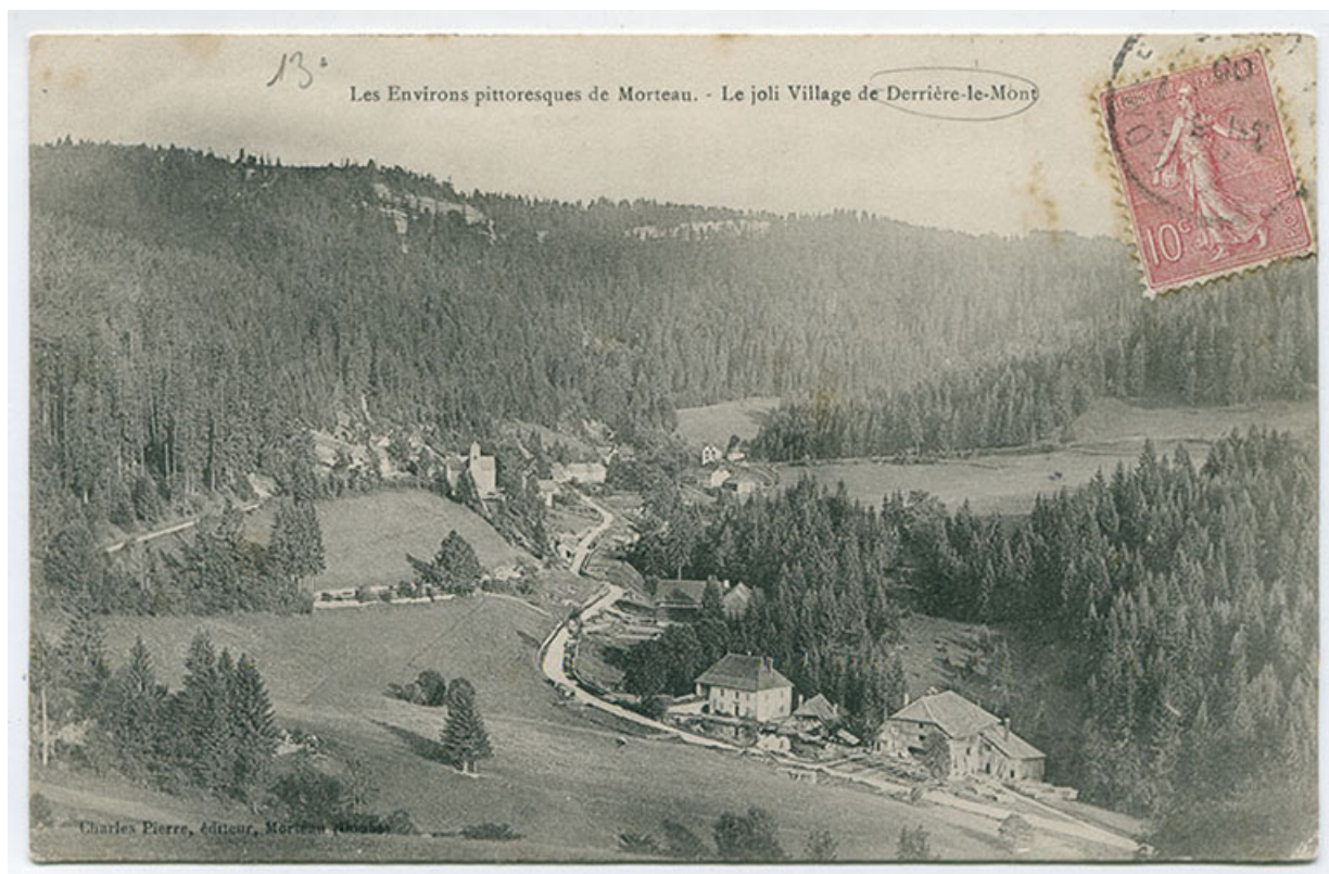
Les environs pittoresques de Morteau. - Le joli village de Derrière-le-Mont, fin 19e siècle ou début 20e siècle [avant 1906 ?]. 25, Montlebon, 16 rue des Coquillards, lieudit : Derrière le Mont

Les environs pittoresques de Morteau. - Le joli village de Derrière-le-Mont, carte postale, s.n., [fin 19e siècle ou début 20e siècle, avant 1906 ?], Charles Pierre éd. à Morteau. Porte la date 1906 (tampon) au recto ? Publiée dans : Vuillet, Bernard. Le val de Morteau et les Brenets en 1900, d'après la collection de cartes postales de Georges Caille. - Les Gras : B. Vuillet, Villers-le-Lac : G. Caille, 1978, p. 200.