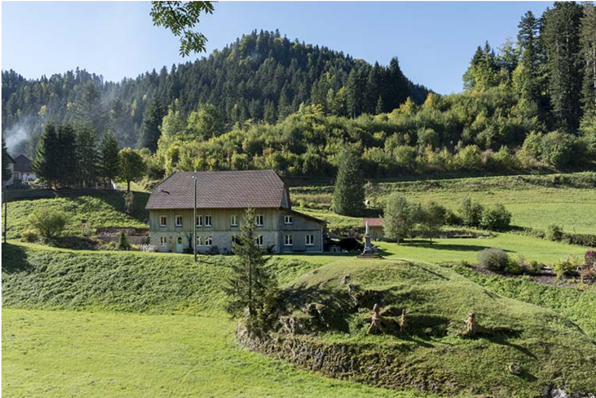
Vue d'ensemble, depuis le nord.

25, Montlebon, 16 rue des Coquillards, lieudit : Derrière le Mont