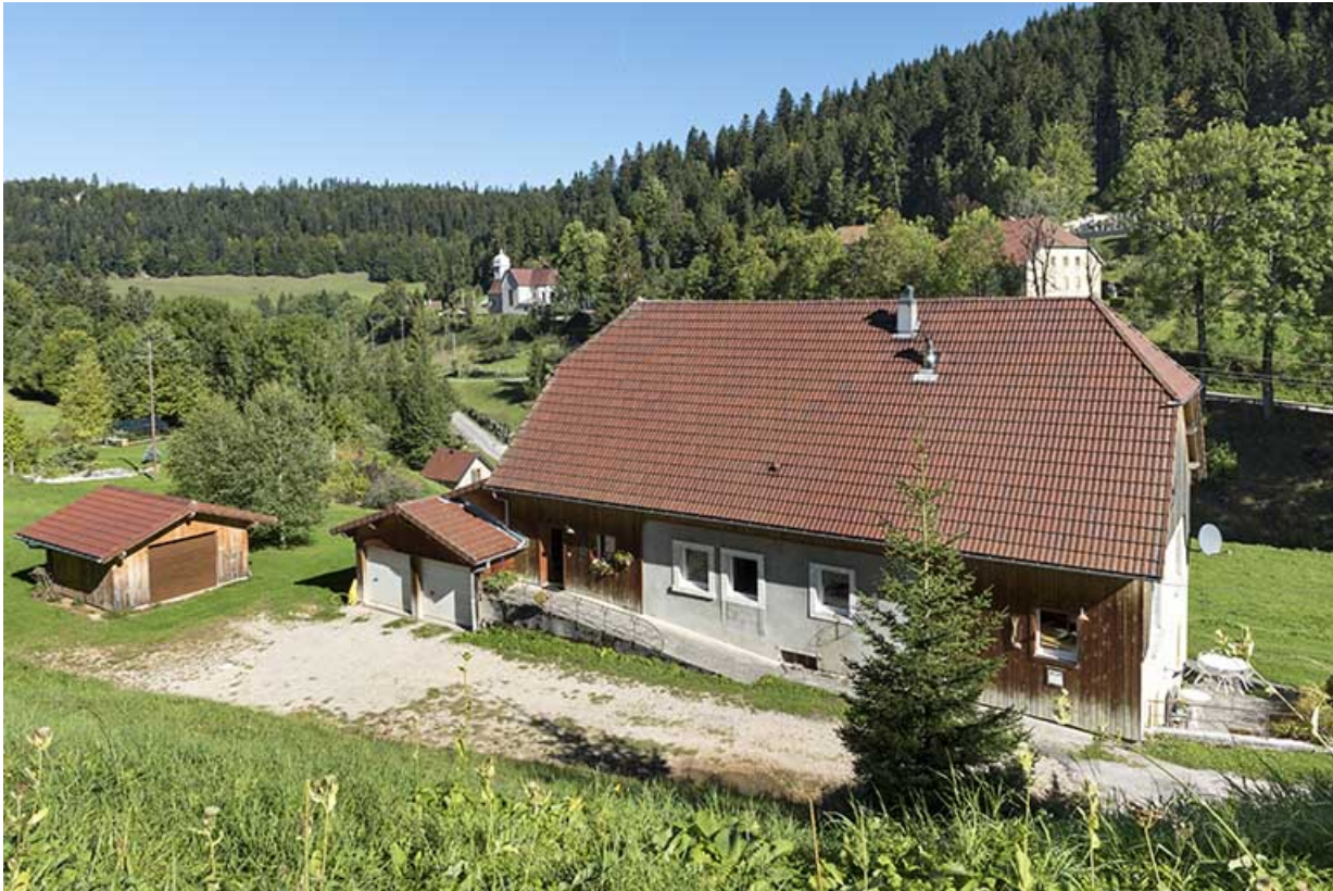
Vue plongeante sur la façade sud.

25, Montlebon, 16 rue des Coquillards, lieudit : Derrière le Mont