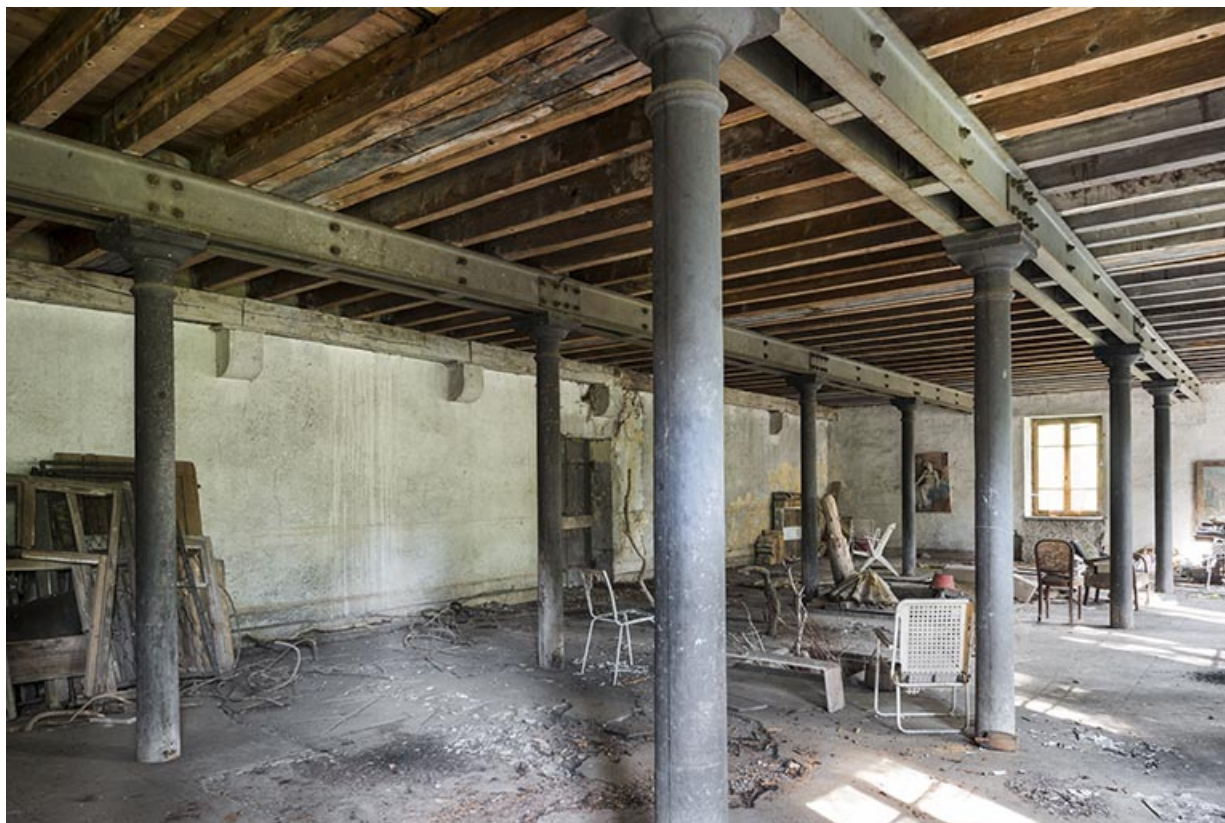
Atelier de fabrication (partie est). Vue de trois quarts.