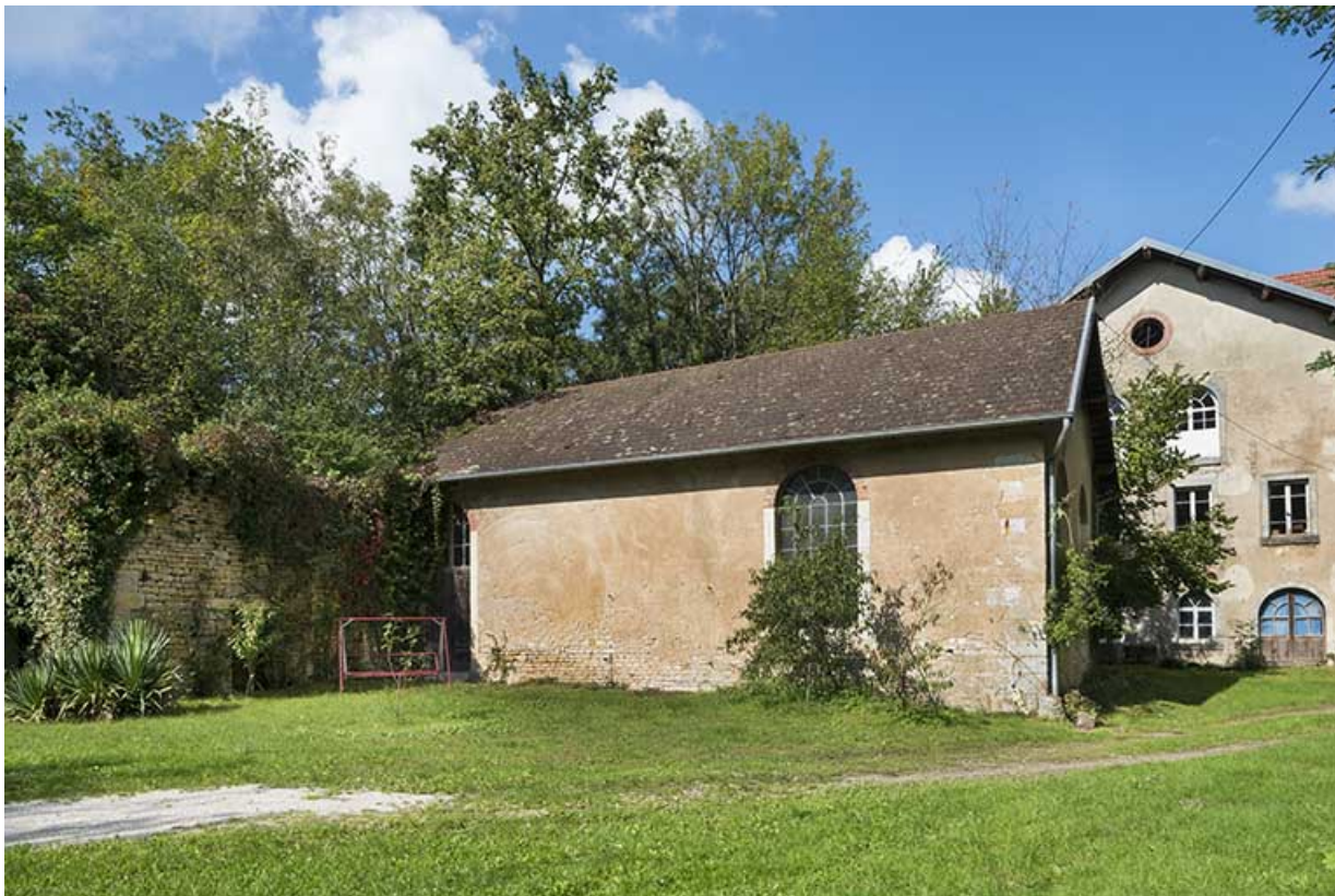
Chaudferie et salle de la machine à vapeur (partie ruinée à gauche).