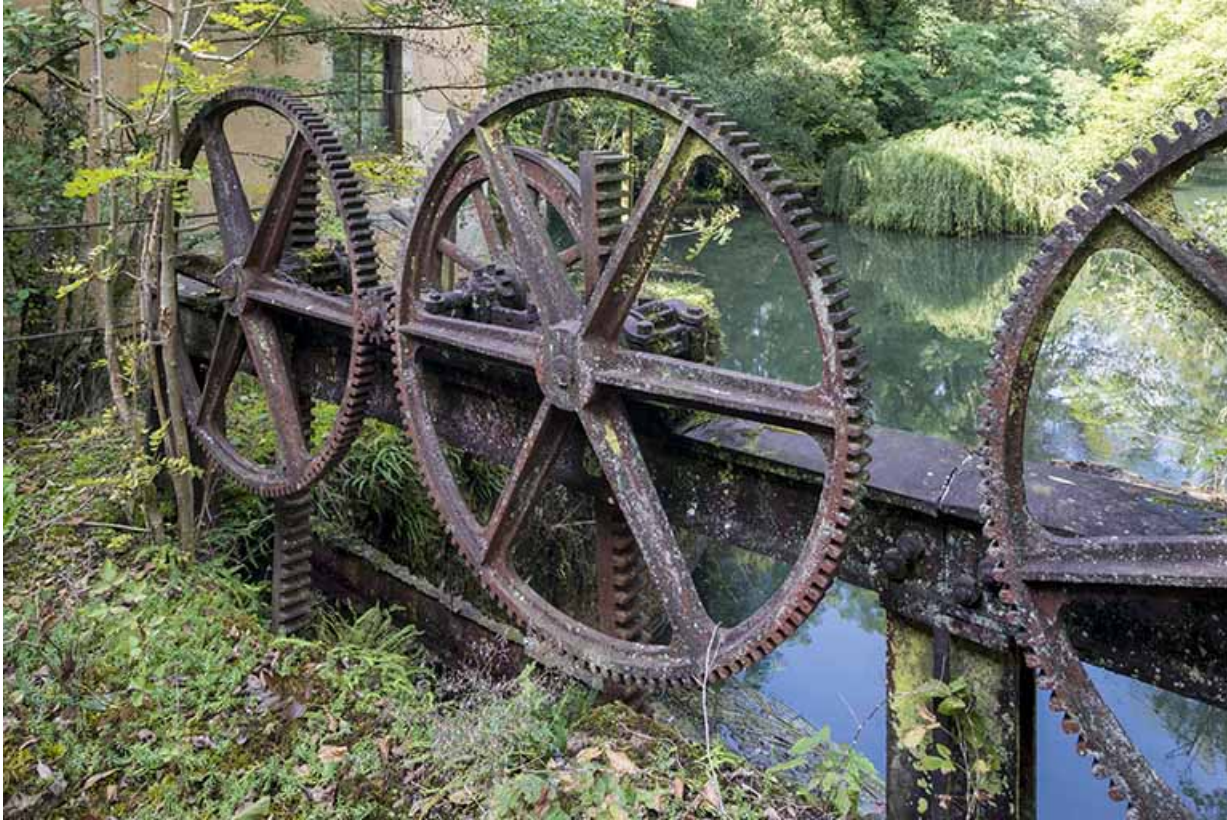
Vannage du canal d'amenée. Détail du mécanisme de levage.