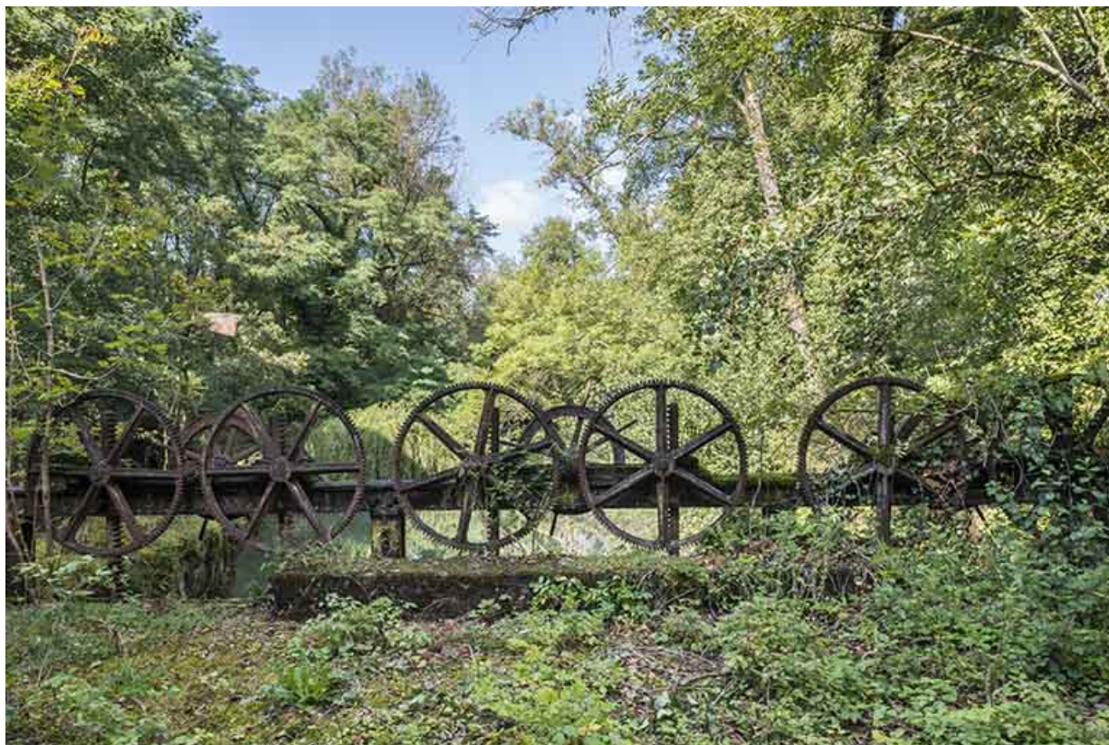
Mécánisme de levage du vannage (canal d'amenée).