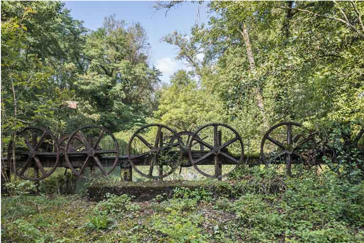
Mécanisme de levage du vannage (canal d'amenée).