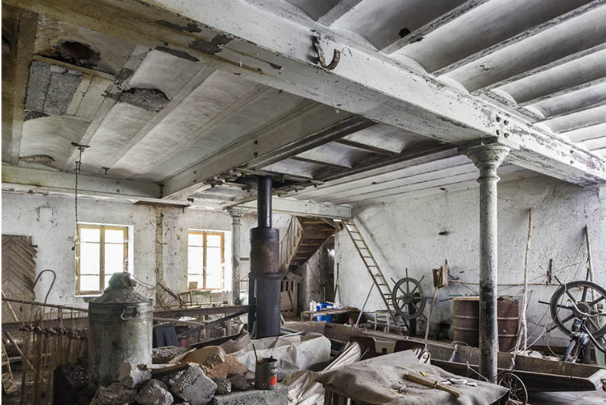
Rez-de-chaussée de l'atelier de fabrication. Au centre, arbre de la turbine. 25, Chevroz chemin de l' Île