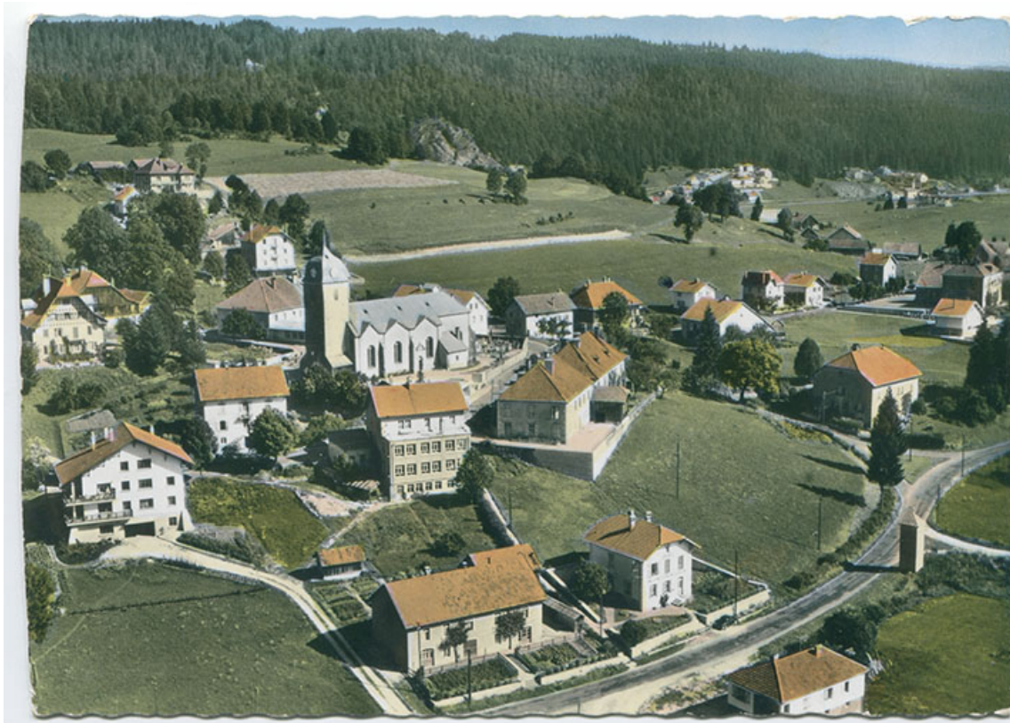
En avion au-dessus de... 12. Grand'Combe-Châteleu (Doubs). Vue générale, 3e quart 20e siècle [décennies 1950-1960]. 25, Grand'Combe-Châteleu, 9 et 11 place du Souvenir français, lieudit : Rossignier