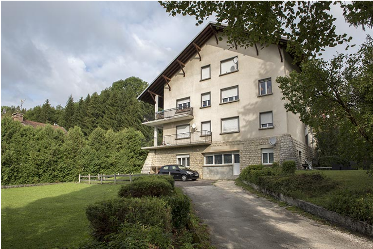
Maison : façade postérieure, de trois quarts droite.

25, Grand'Combe-Châteleu, 9 et 11 place du Souvenir français, lieudit : Rossignier