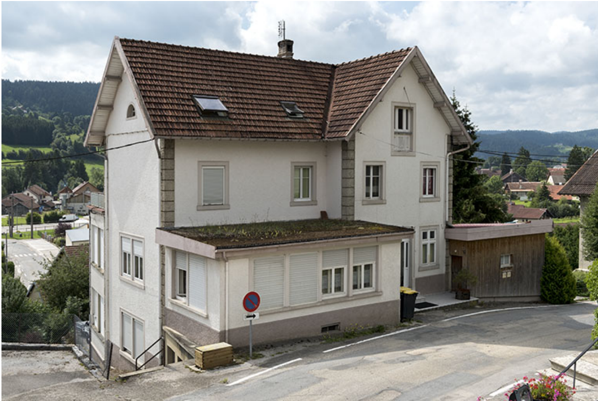
Usine : façade antérieure, de trois quarts gauche.

25, Grand'Combe-Châteleu, 9 et 11 place du Souvenir français, lieudit : Rossignier