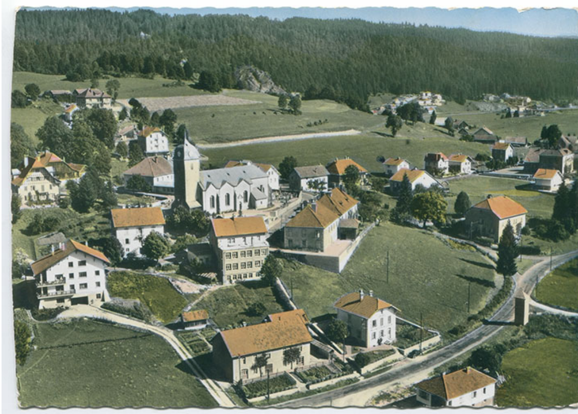
En avion au-dessus de... 12. Grand'Combe-Châteleu (Doubs). Vue générale, 3e quart 20e siècle [décennies 1950-1960]. 25, Grand'Combe-Châteleu, 9 et 11 place du Souvenir français, lieudit : Rossignier