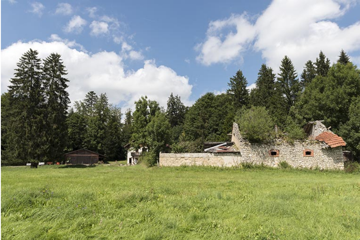
Vestiges de la porcherie, depuis le sud.

25, Grand'Combe-Châteleu, lieudit : le Bûcher Grenier