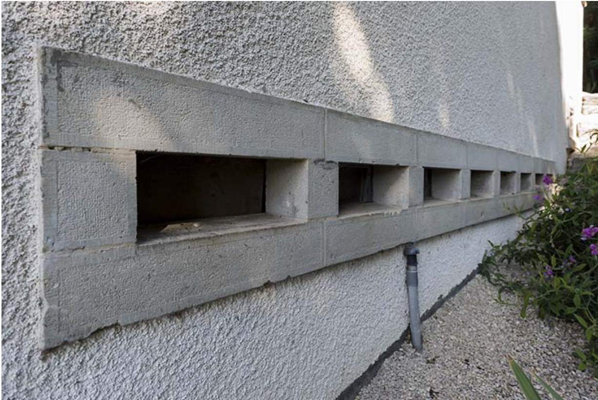
Baies fromagères horizontales, sur la façade latérale droite.

25, Grand'Combe-Château, lieudit : le Bûcher Grenier