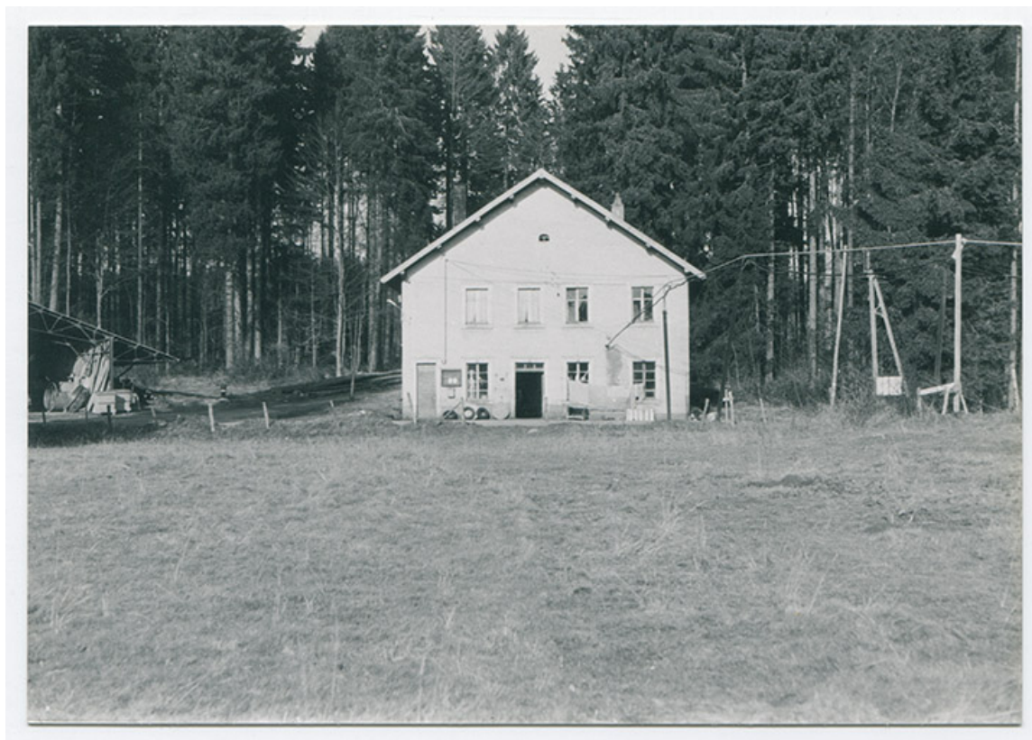
Façade antérieure en 1976.

25, Grand'Combe-Châteleu, lieudit : le Bûcher Grenier