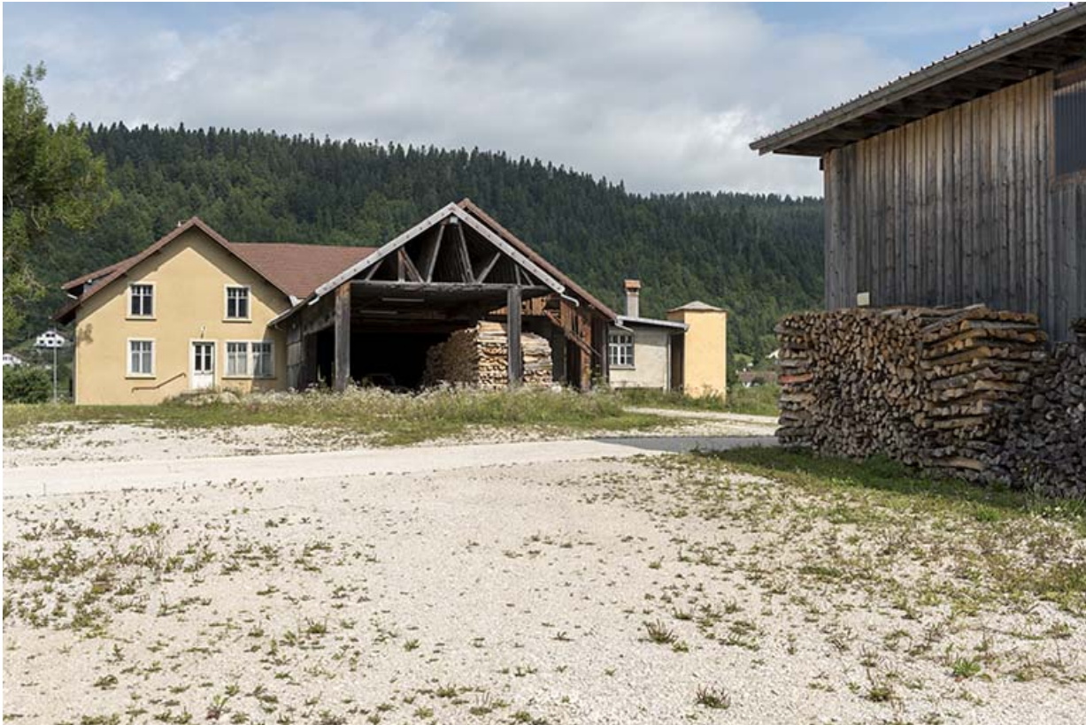
Vue d'ensemble, depuis le sud-est.

25, Grand'Combe-Châteleu, lieudit : les Douffrans