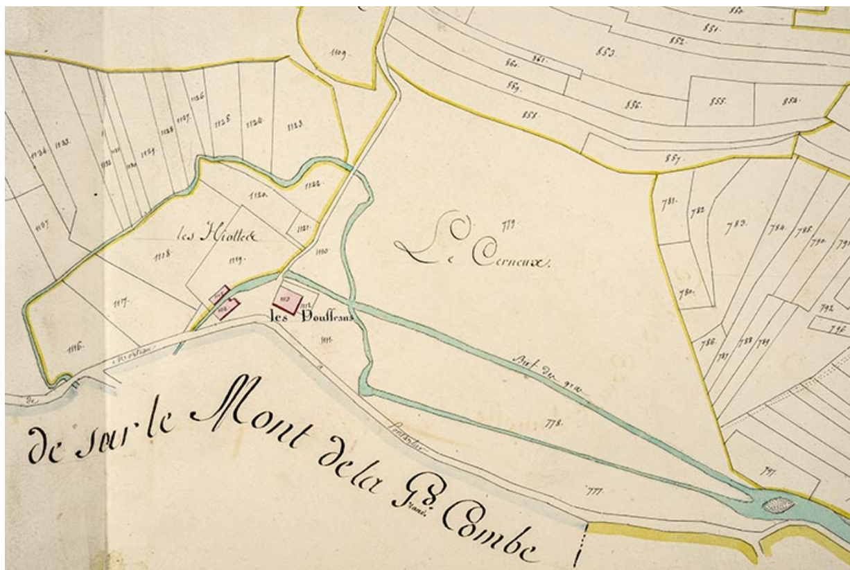
Cadastre de la commune de Grand'Combe-Châteleu. Atlas parcellaire, 1816, section B 5e feuille [détail : les Douffrans], 1/2 500. 25, Grand'Combe-Châteleu