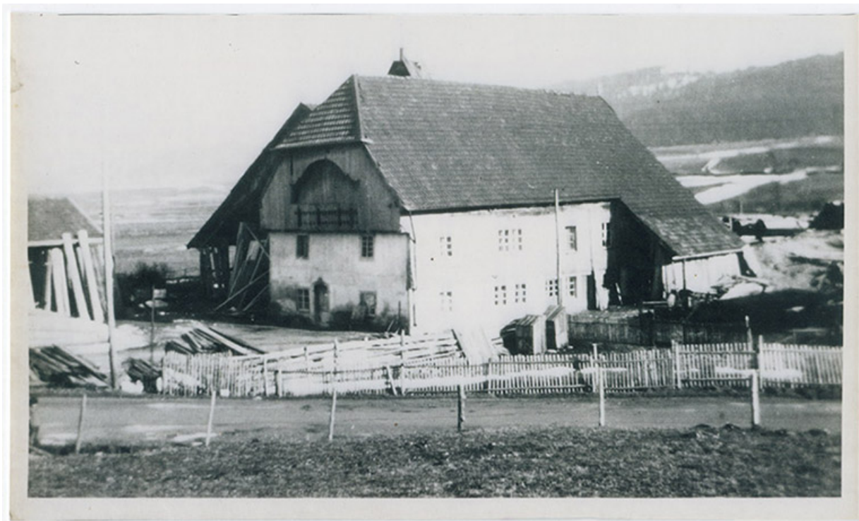
[La scierie Bertin, vue de trois quarts gauche], 2e quart 20e siècle ? 25, Grand'Combe-Châteleu