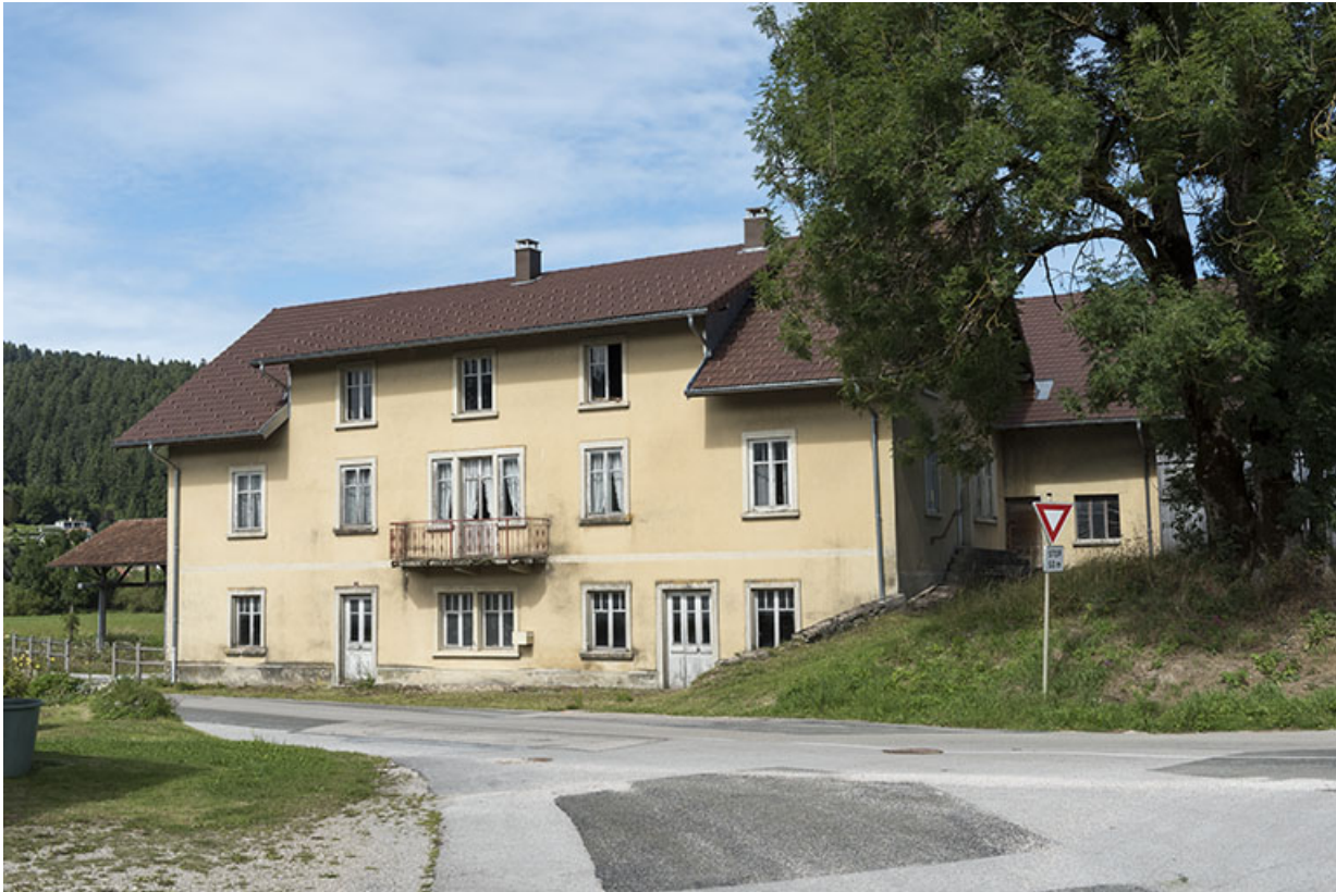
Façade antérieure, de trois quarts droite.

25, Grand'Combe-Châtelet, lieudit : les Douffrans