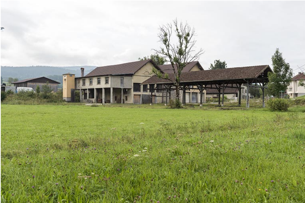
Vue d'ensemble, depuis le nord.