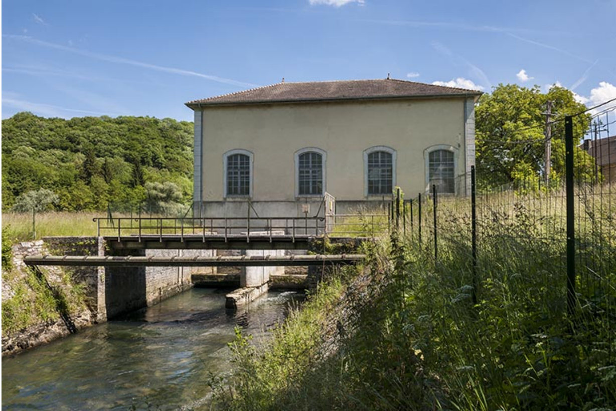
La centrale hydroélectrique et son canal de fuite.

25, Châtillon-sur-Lison chemin des Forges, lieudit : les Forges