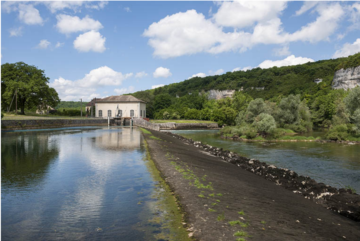
Le barrage de la centrale hydroélectrique.

25, Châtillon-sur-Lison chemin des Forges, lieudit : les Forges