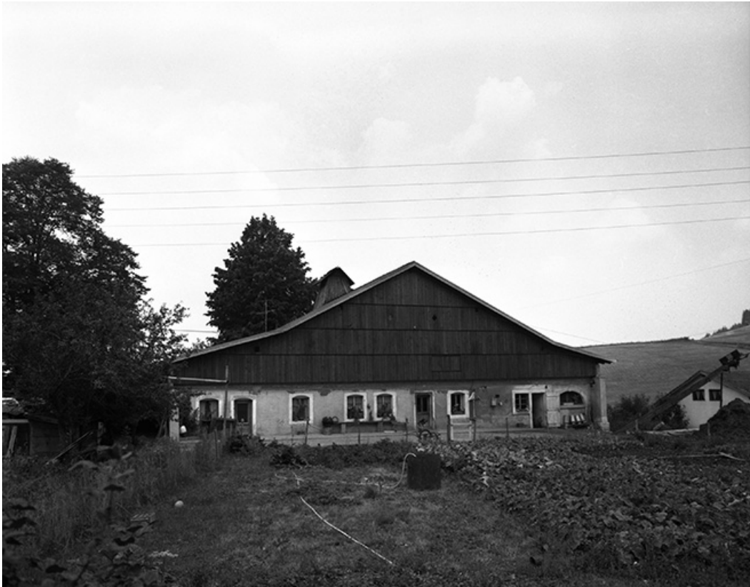
Ferme située au lieudit Le Nid du Fol, cadastrée ZD 68 : façade antérieure et jardin.