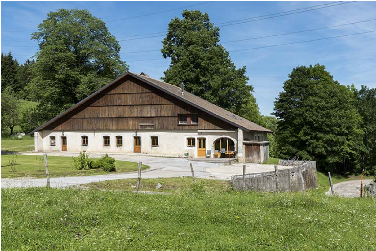
Vue d'ensemble, depuis le sud-est.