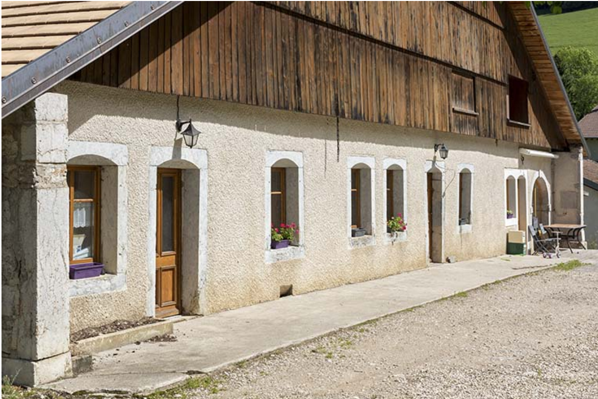
Façade antérieure, vue en enfilade.