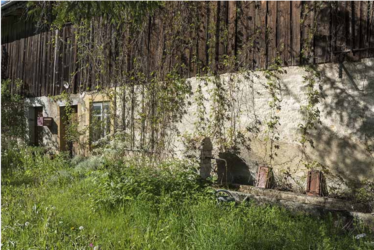
Façade latérale gauche, avec fontaine.

25, Les Gras, 10 rue les Jean-Jacquot, lieudit : les Jean-Jacquot