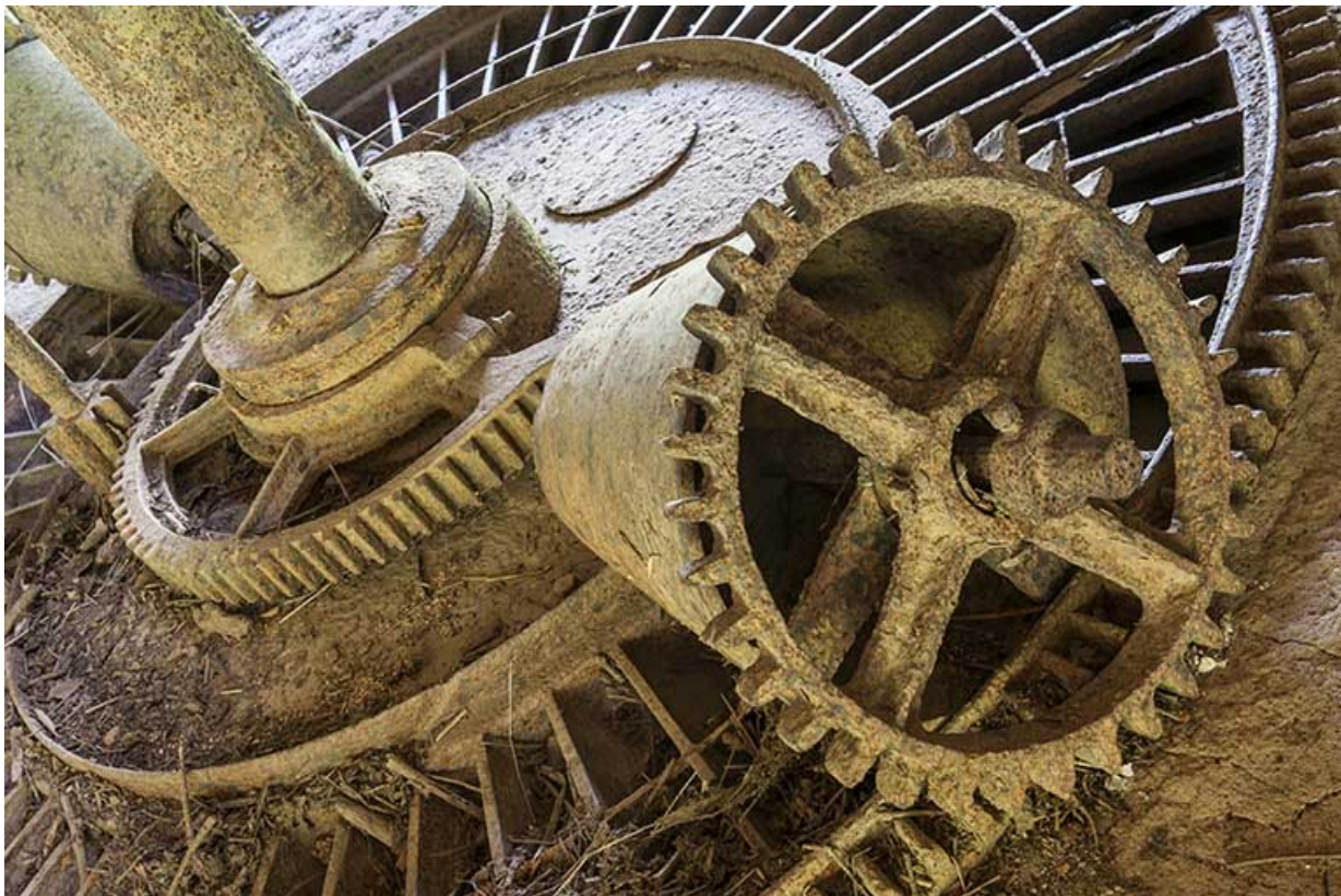
Détail de la partie supérieure de la turbine.

25, Rigney, lieudit : Château de la Roche