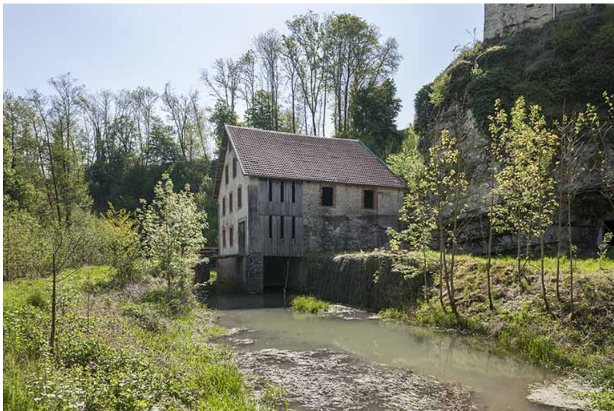
Vue d'ensemble depuis l'ouest, avec le canal de fuite.

25, Rigney, lieudit : Château de la Roche