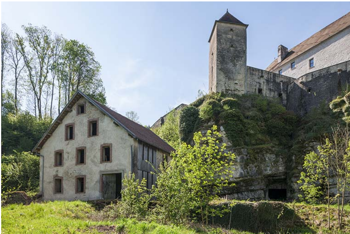
Le moulin et le château de la Roche, depuis le nord-ouest.

25, Rigney, lieudit : Château de la Roche