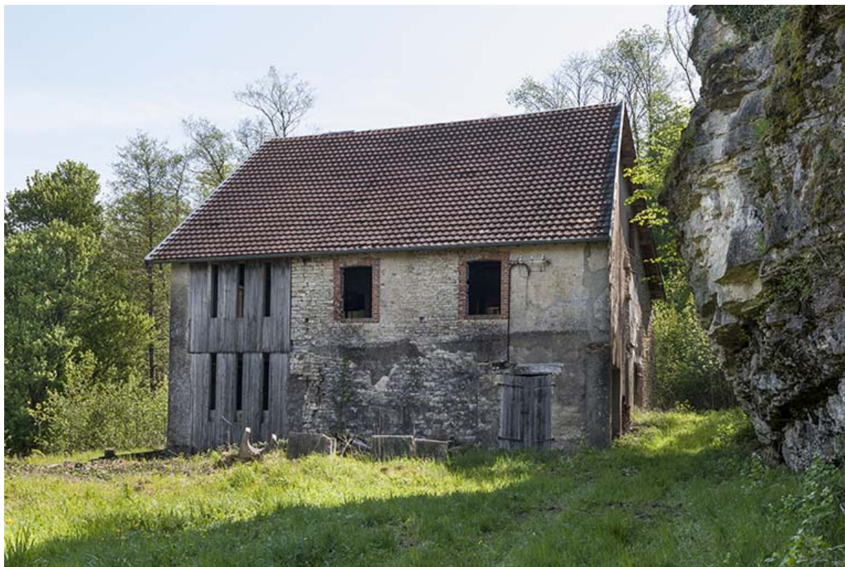
Vue d'ensemble depuis l'ouest.

25, Rigney, lieudit : Château de la Roche