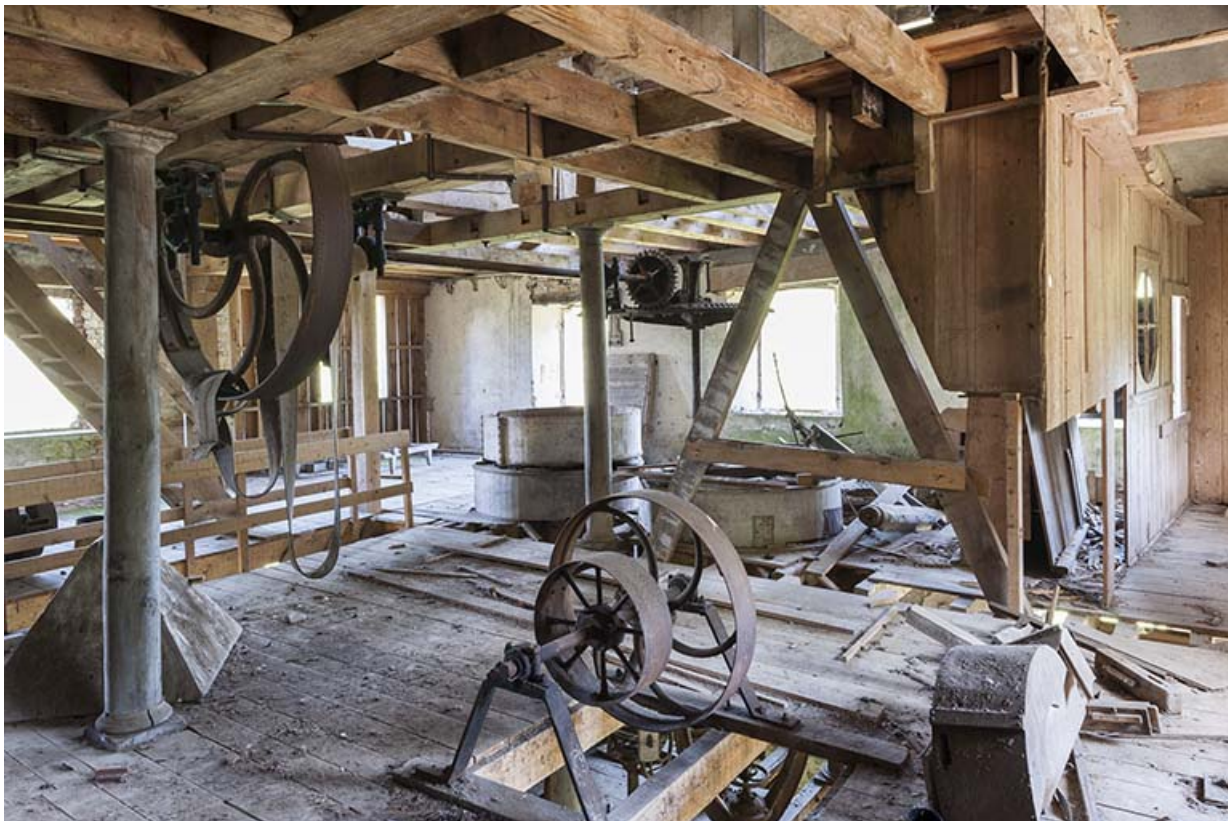
Premier étage. Vue d'ensemble depuis le sud-est.

25, Rigney, lieudit : Château de la Roche