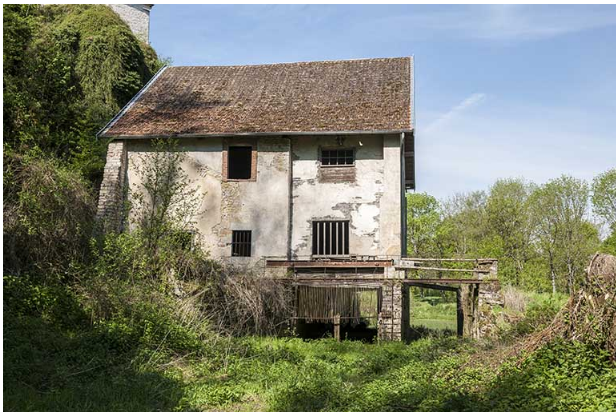
Façade est, depuis le bief d'amenée (à sec).

25, Rigney, lieudit : Château de la Roche