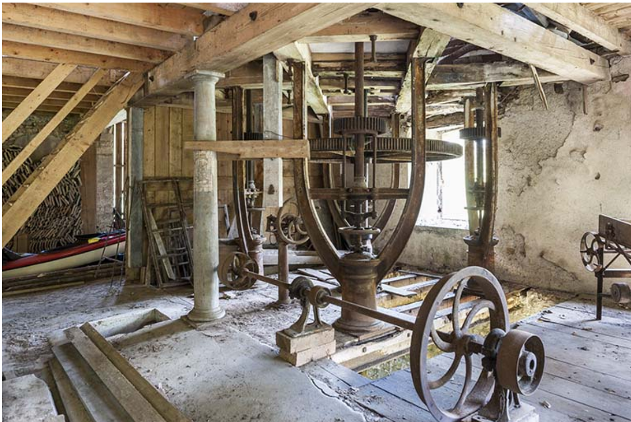
Rez-de-chaussée. Le beffroi du moulin.

25, Rigney, lieudit : Château de la Roche