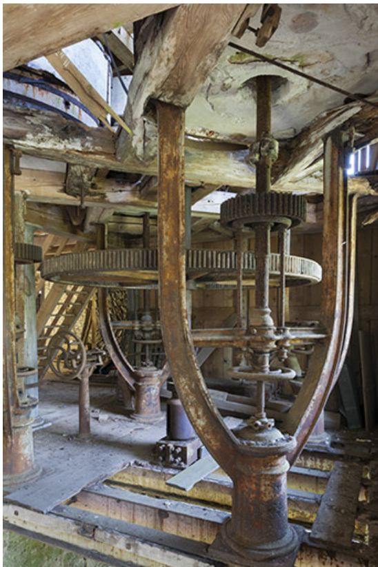
Rez-de-chaussée. Les colonnes "en lyre" du beffroi. 25, Rigney, lieudit : Château de la Roche