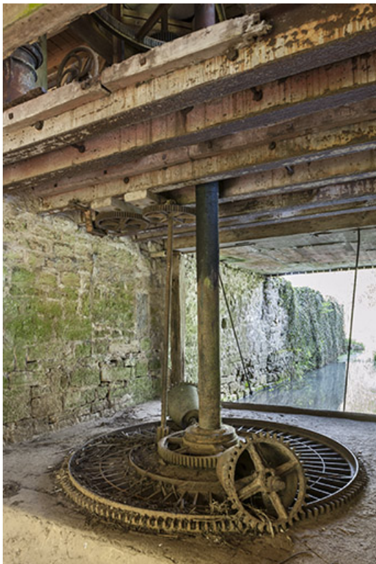
Partie supérieure de la turbine.

25, Rigney, lieudit : Château de la Roche