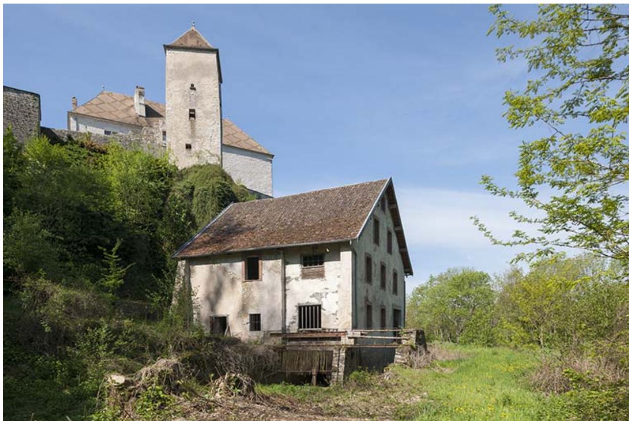
Vue d'ensemble depuis le nord-est, avec le château au second plan.

25, Rigney, lieudit : Château de la Roche