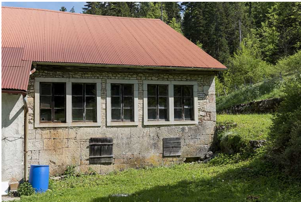
Façade latérale droite (sud) : baies horlogères de l'atelier.

25, Les Gras, 6 rue le Dessus de la Fin, lieudit : le Dessus de la Fin