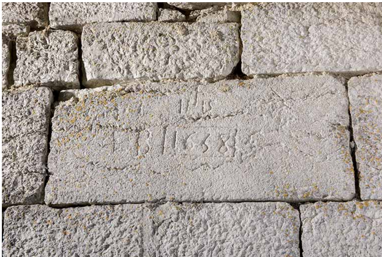
Façade latérale gauche (nord) : pierre portant la date 1658 (avec IHS). 25, Les Gras, 6 rue le Dessus de la Fin, lieudit : le Dessus de la Fin