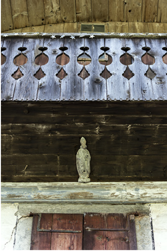
Façade antérieure : statuette de saint Eloi sous la galerie.

25, Les Gras, 6 rue le Dessus de la Fin, lieudit : le Dessus de la Fin