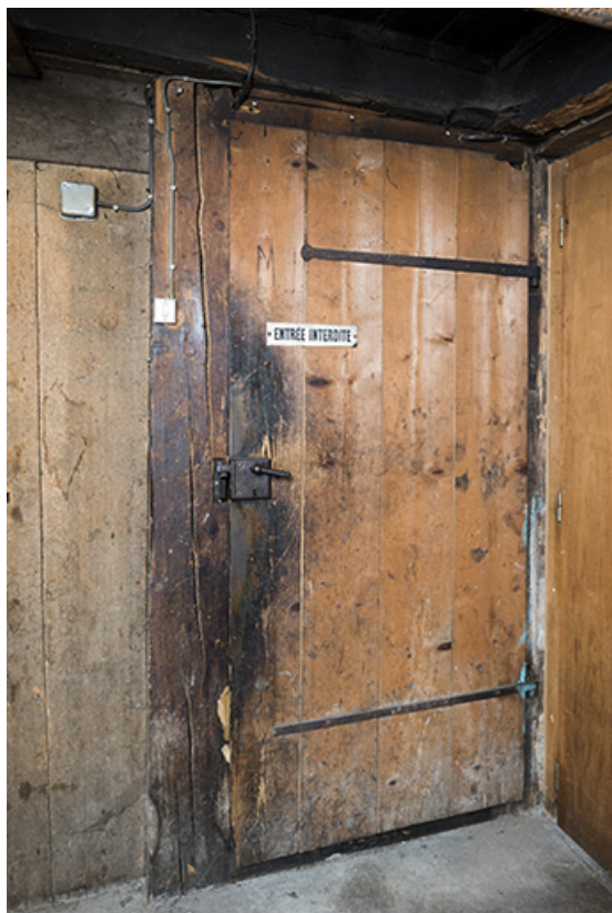
Intérieur : porte de l'atelier.

25, Les Gras, 6 rue le Dessus de la Fin, lieudit : le Dessus de la Fin