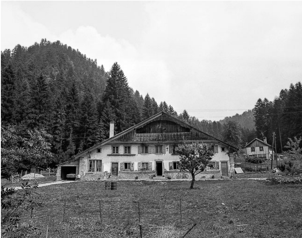
Ferme située au lieu-dit Le Dessus de la Fin, cadastrée B 1-6 : façade antérieure.

25, Les Gras, 6 rue le Dessus de la Fin, lieudit : le Dessus de la Fin