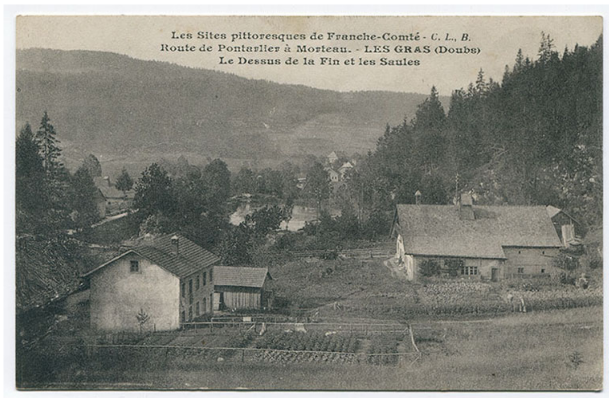
Les sites pittoresques de Franche-Comté. Route de Pontarlier à Morteau. - Les Gras (Doubs). Le Dessus de la Fin et les Saules, 1er quart 20e siècle. Les fenêtres horlogères de l'atelier n'ont pas encore été percées et la scierie existe encore derrière le bâtiment. 25, Les Gras, 6 rue le Dessus de la Fin, lieudit : le Dessus de la Fin

Les sites pittoresques de Franche-Comté. Route de Pontarlier à Morteau. - Les Gras (Doubs). Le Dessus de la Fin et les Saules, carte postale, s.n., s.d. [1er quart 20e siècle], Phototypie artistique de l'Est C. Lardier à Besançon.