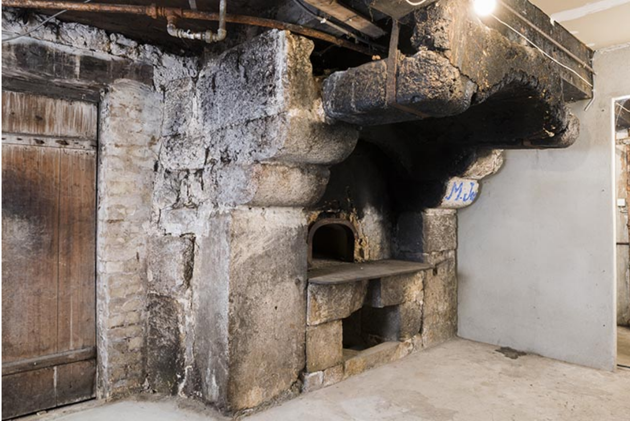
Intérieur : cheminée et four.

25, Les Gras, 6 rue le Dessus de la Fin, lieudit : le Dessus de la Fin