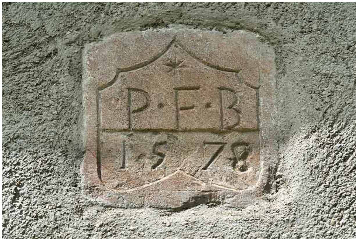
Façade latérale droite (sud) : pierre portant la date 1578 (avec les initiales PFB). 25, Les Gras, 6 rue le Dessus de la Fin, lieudit : le Dessus de la Fin