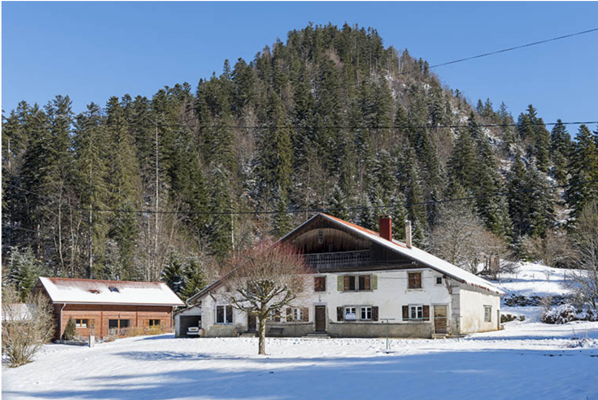
Vue d'ensemble, depuis l'ouest, en hiver.

25, Les Gras, 6 rue le Dessus de la Fin, lieudit : le Dessus de la Fin