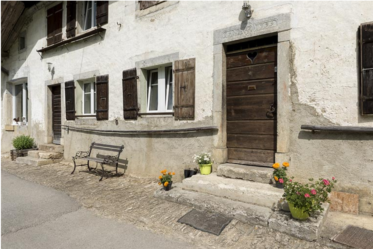
Façade antérieure : portes et fenêtres au rez-de-chaussée.

25, Les Gras, 6 rue le Dessus de la Fin, lieudit : le Dessus de la Fin