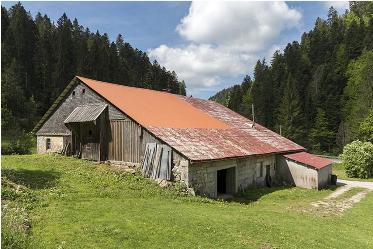
Vue d'ensemble, depuis le nord-ouest (façades postérieure et latérale gauche).

25, Les Gras, 6 rue le Dessus de la Fin, lieudit : le Dessus de la Fin