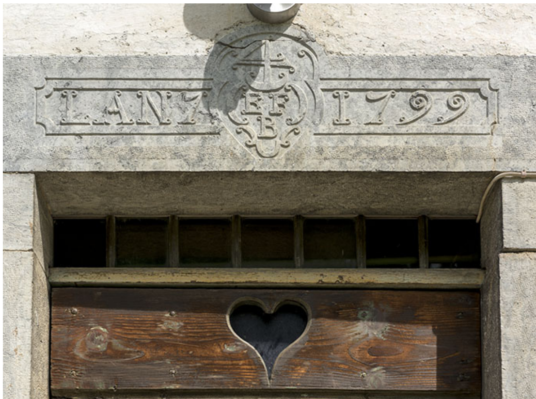
Façade antérieure : linteau daté 1799.

25, Les Gras, 6 rue le Dessus de la Fin, lieudit : le Dessus de la Fin