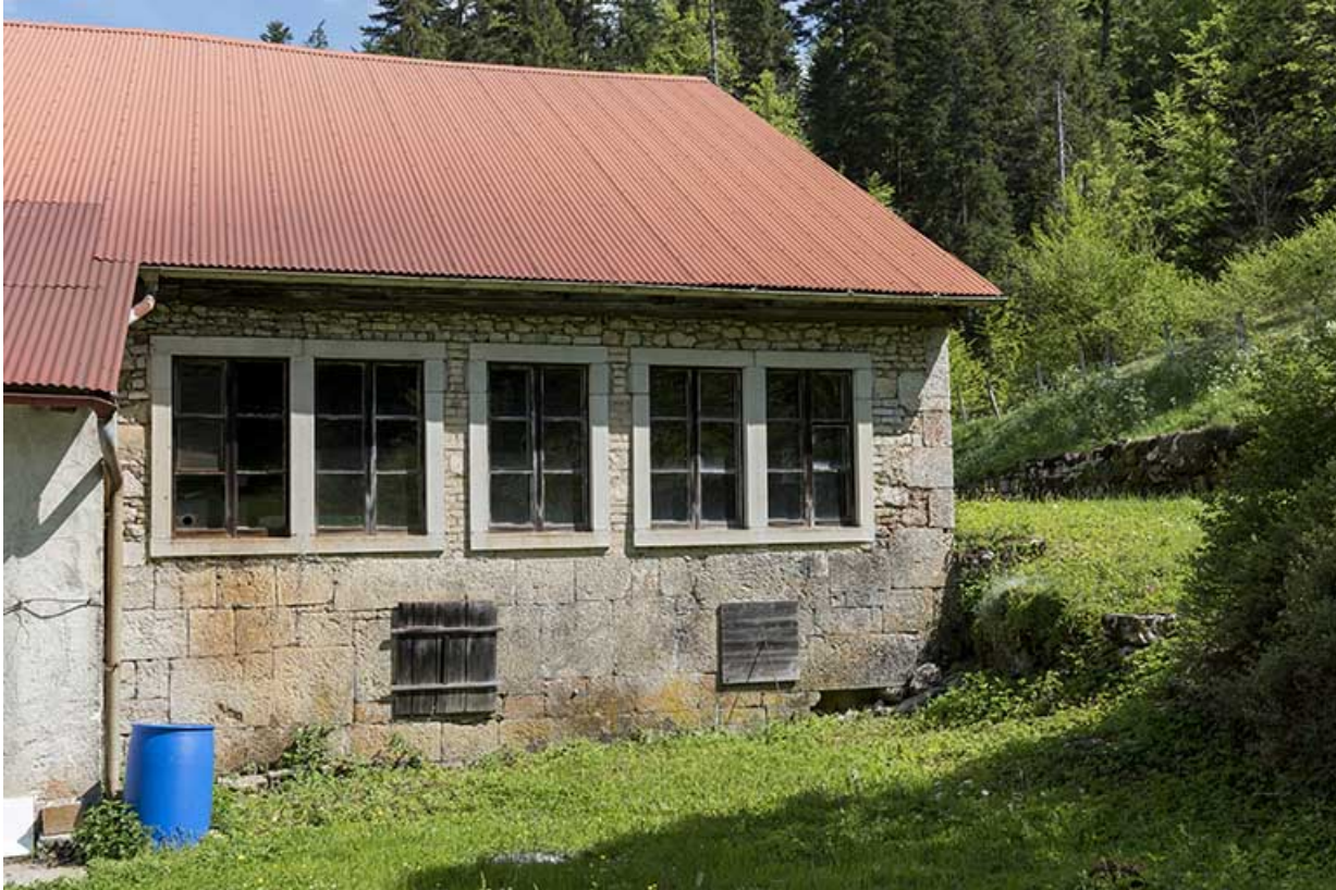
Façade latérale droite (sud) : baies horlogères de l'atelier.

25, Les Gras, 6 rue le Dessus de la Fin, lieudit : le Dessus de la Fin