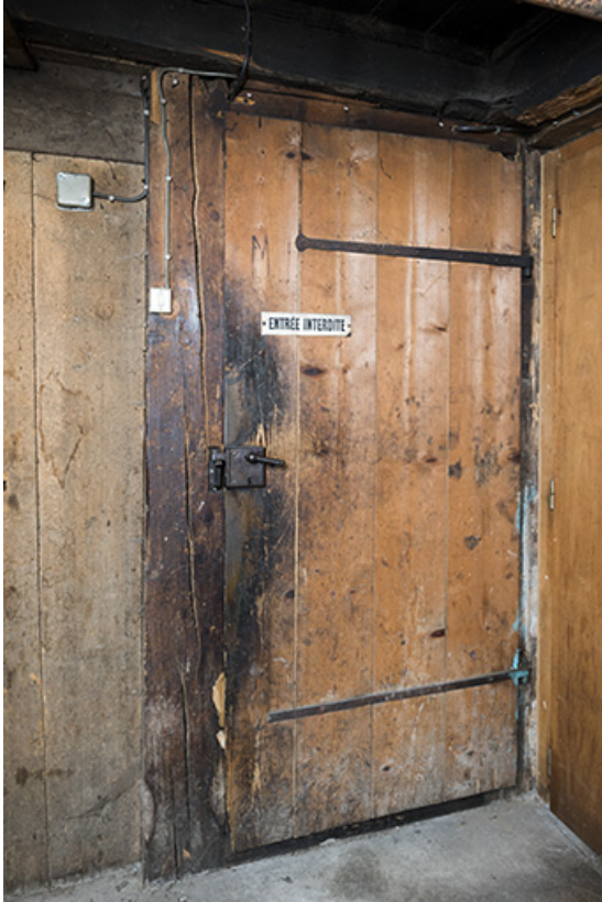
Intérieur : porte de l'atelier.

25, Les Gras, 6 rue le Dessus de la Fin, lieudit : le Dessus de la Fin