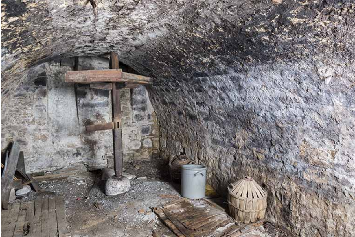
Intérieur de la cave en sous-sol.

25, Les Gras, 6 rue le Dessus de la Fin, lieudit : le Dessus de la Fin