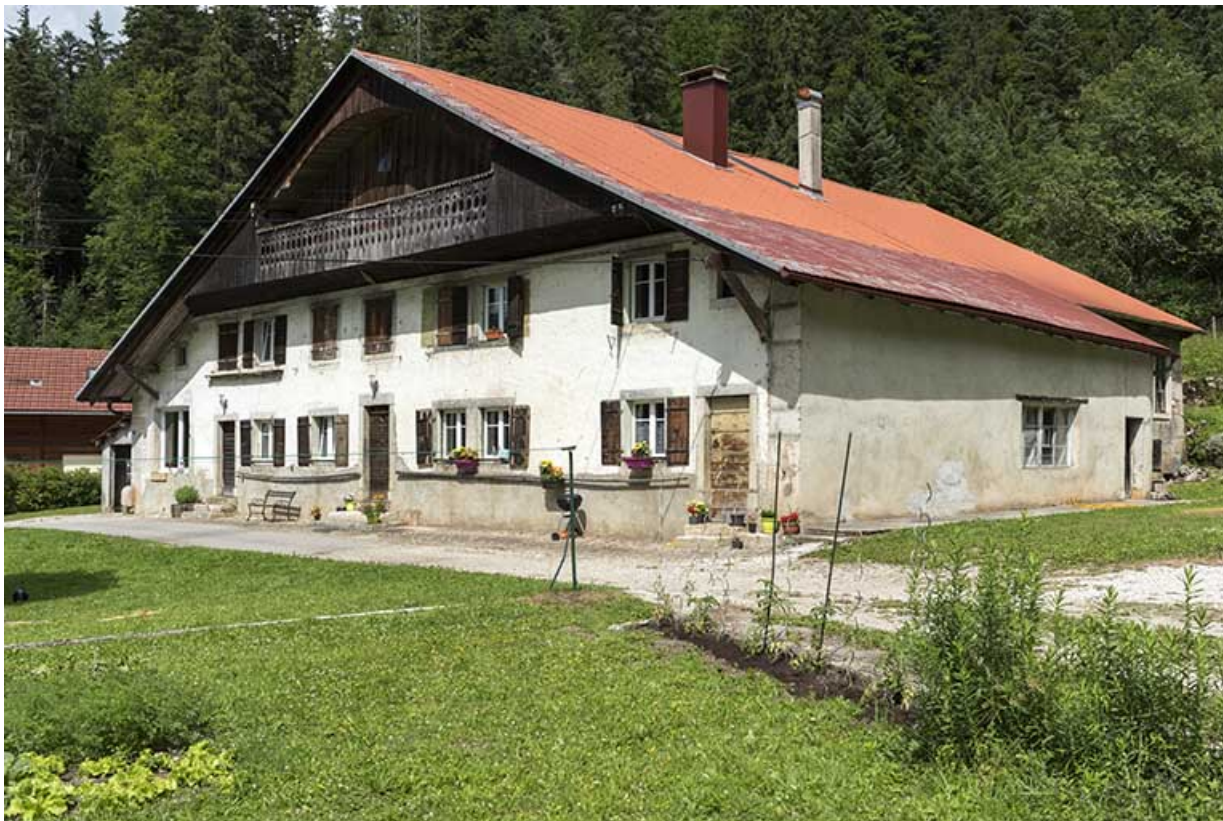
Vue d'ensemble, depuis le sud-est (façades antérieure et latérale droite).

25, Les Gras, 6 rue le Dessus de la Fin, lieudit : le Dessus de la Fin