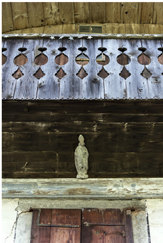
Façade antérieure : statuette de saint Eloi sous la galerie.

25, Les Gras, 6 rue le Dessus de la Fin, lieudit : le Dessus de la Fin