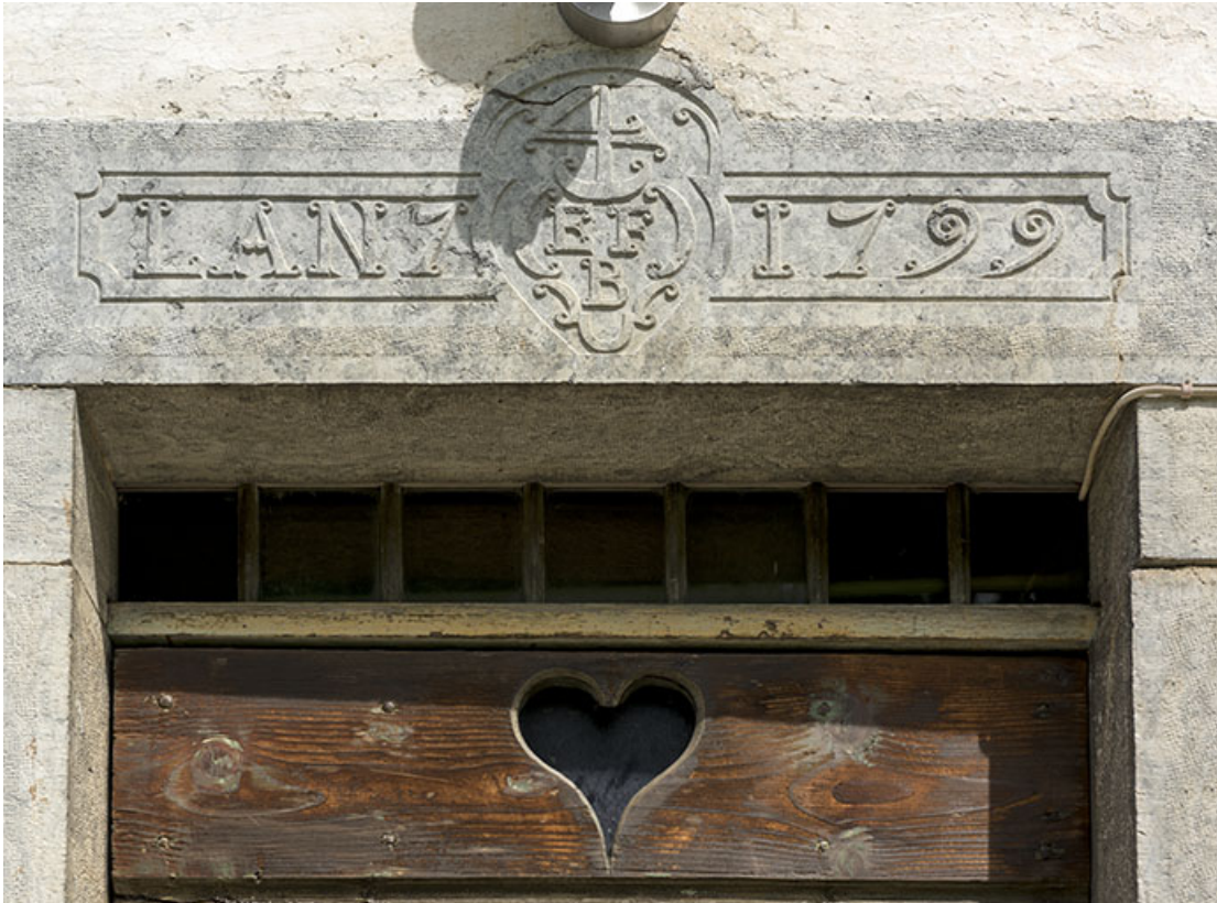
Façade antérieure : linteau daté 1799.

25, Les Gras, 6 rue le Dessus de la Fin, lieudit : le Dessus de la Fin