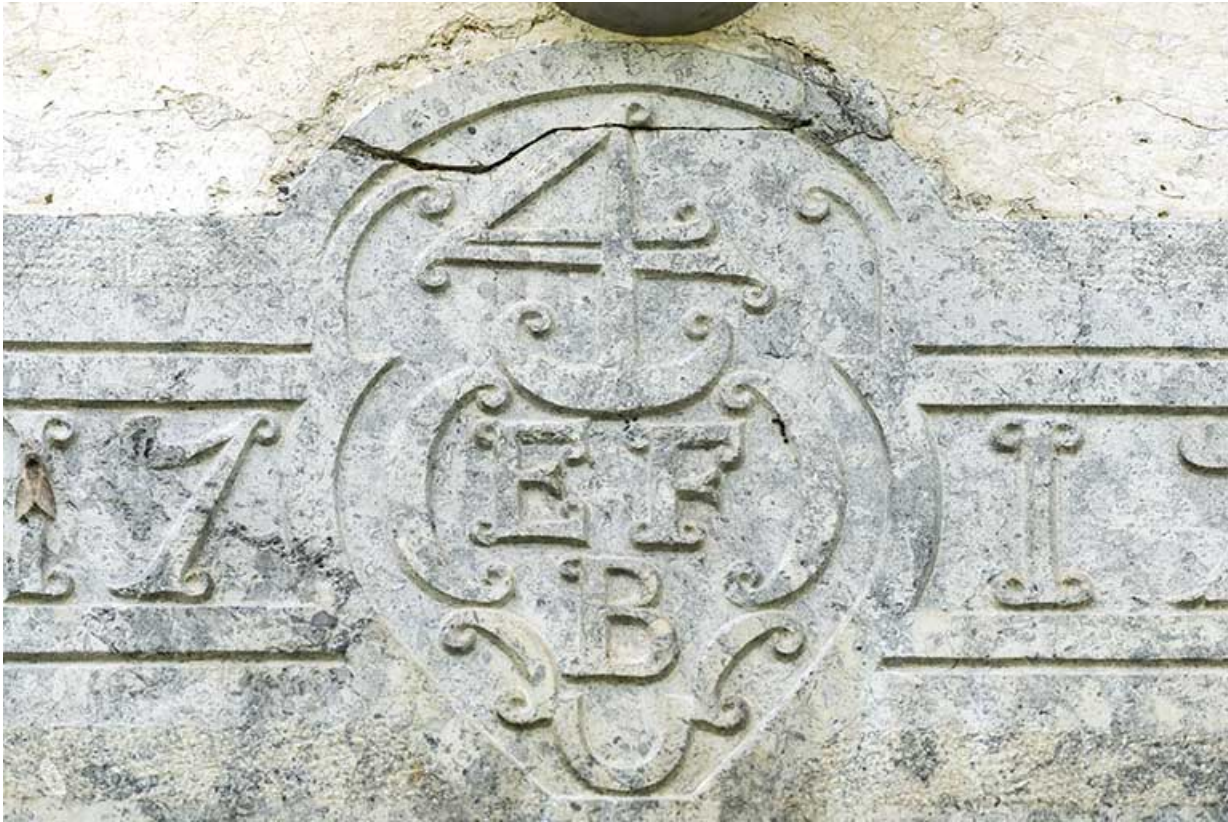
Façade antérieure : détail du 4 de chiffre sur le linteau daté 1799.

25, Les Gras, 6 rue le Dessus de la Fin, lieudit : le Dessus de la Fin