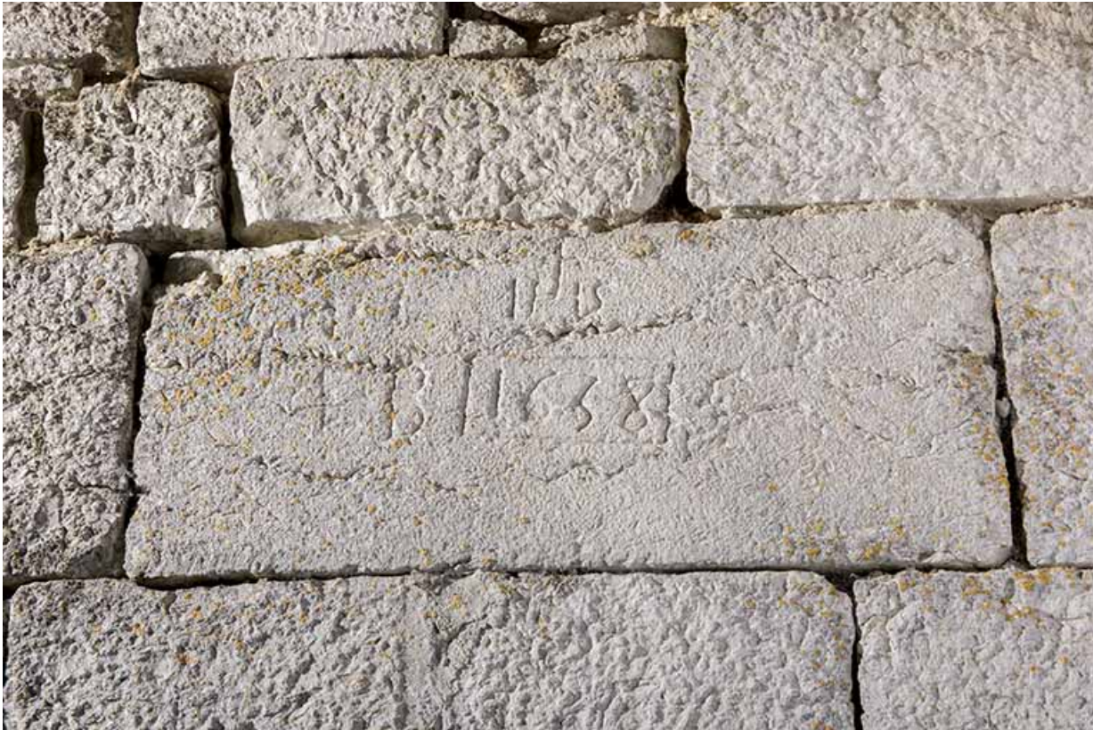
Façade latérale gauche (nord) : pierre portant la date 1658 (avec IHS).

25, Les Gras, 6 rue le Dessus de la Fin, lieudit : le Dessus de la Fin