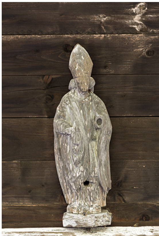
Façade antérieure : statuette de saint Eloi.

25, Les Gras, 6 rue le Dessus de la Fin, lieudit : le Dessus de la Fin