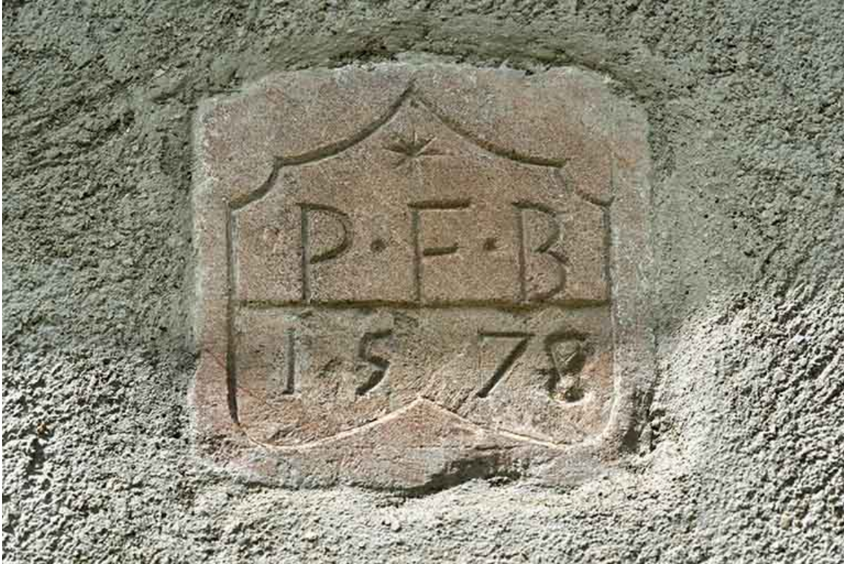
Façade latérale droite (sud) : pierre portant la date 1578 (avec les initiales PFB).

25, Les Gras, 6 rue le Dessus de la Fin, lieudit : le Dessus de la Fin