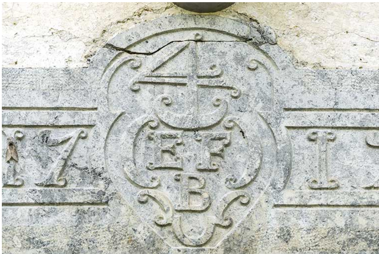
Façade antérieure : détail du 4 de chiffre sur le linteau daté 1799.

25, Les Gras, 6 rue le Dessus de la Fin, lieudit : le Dessus de la Fin