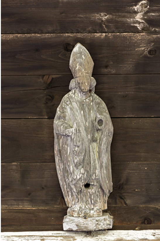
Façade antérieure : statuette de saint Eloi.

25, Les Gras, 6 rue le Dessus de la Fin, lieudit : le Dessus de la Fin