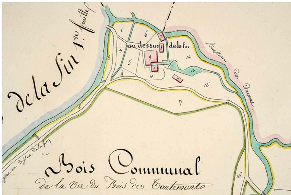
Cadastre de la commune des Gras. Atlas parcellaire, 1816, section B 1ère feuille [détail : le Dessus de la Fin], 1/2 500. 25, Les Gras, 6 rue le Dessus de la Fin, lieudit : le Dessus de la Fin