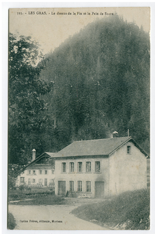
393. - Les Gras. - Le dessus de la Fin et le Pain de Sucre, 1er quart 20e siècle. 25, Les Gras, 6 rue le Dessus de la Fin, lieudit : le Dessus de la Fin

393. - Les Gras. - Le dessus de la Fin et le Pain de Sucre, carte postale, s.n., s.d. [1er quart 20e siècle], Farine Frères éd. à Morten.