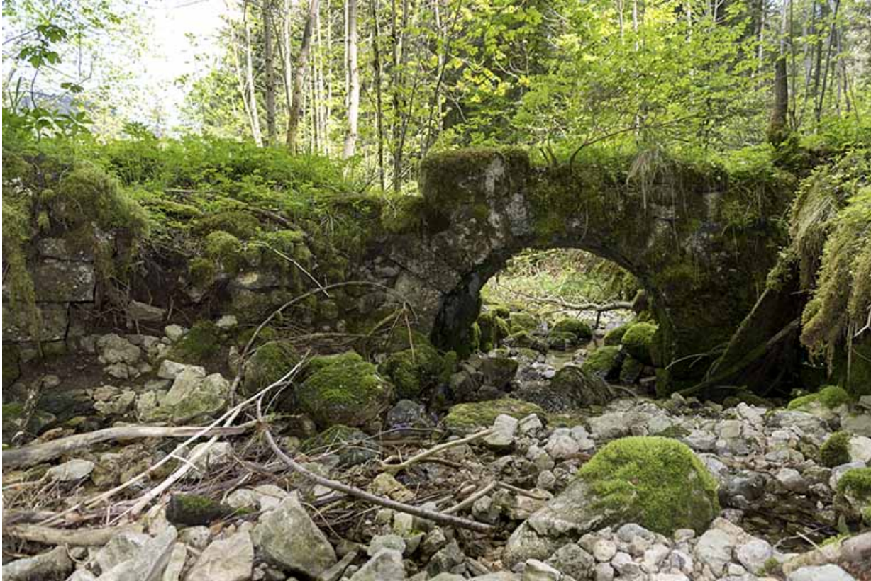
Pont en ruine.