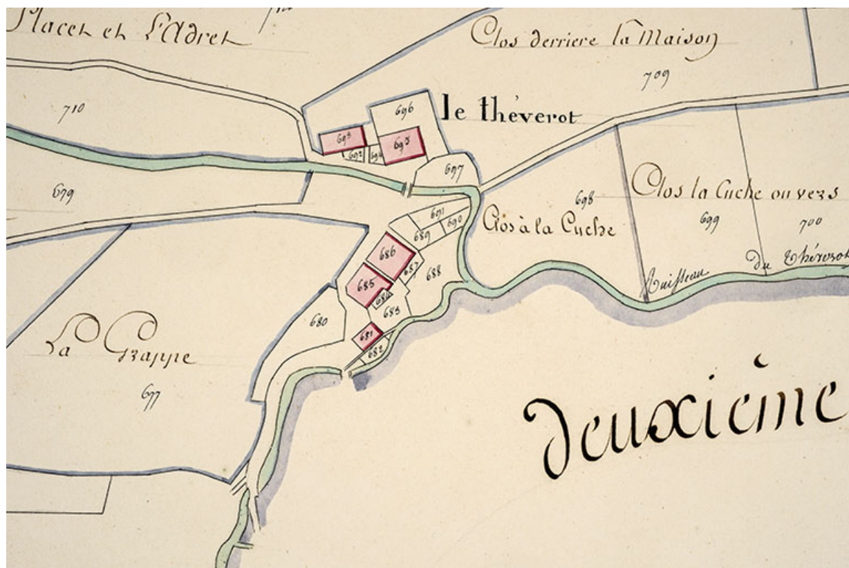
Cadastre de la commune des Gras. Atlas parcellaire, 1816, section D 3e feuille [détail : le Théverot], 1/2 500. 25, Les Gras, lieudit : le Théverot