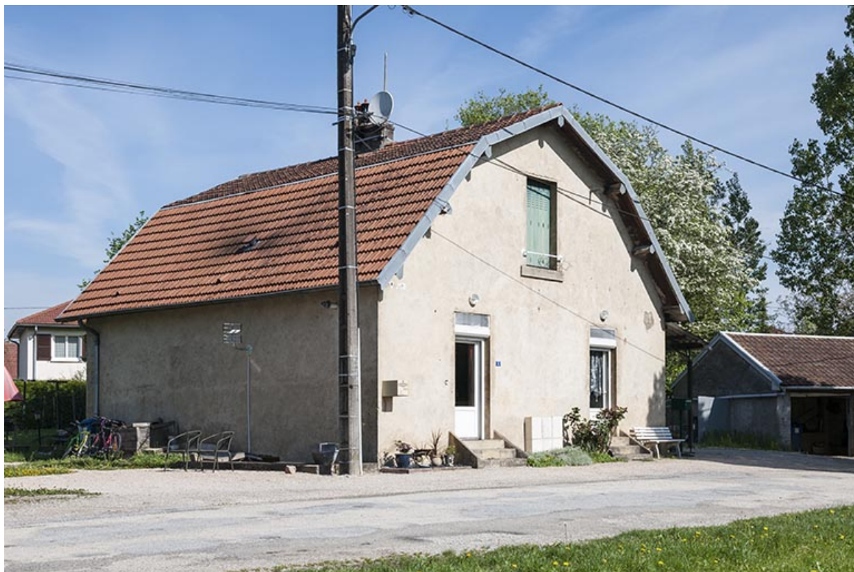
Logement ouvrier double (4 allée des Rompeux).