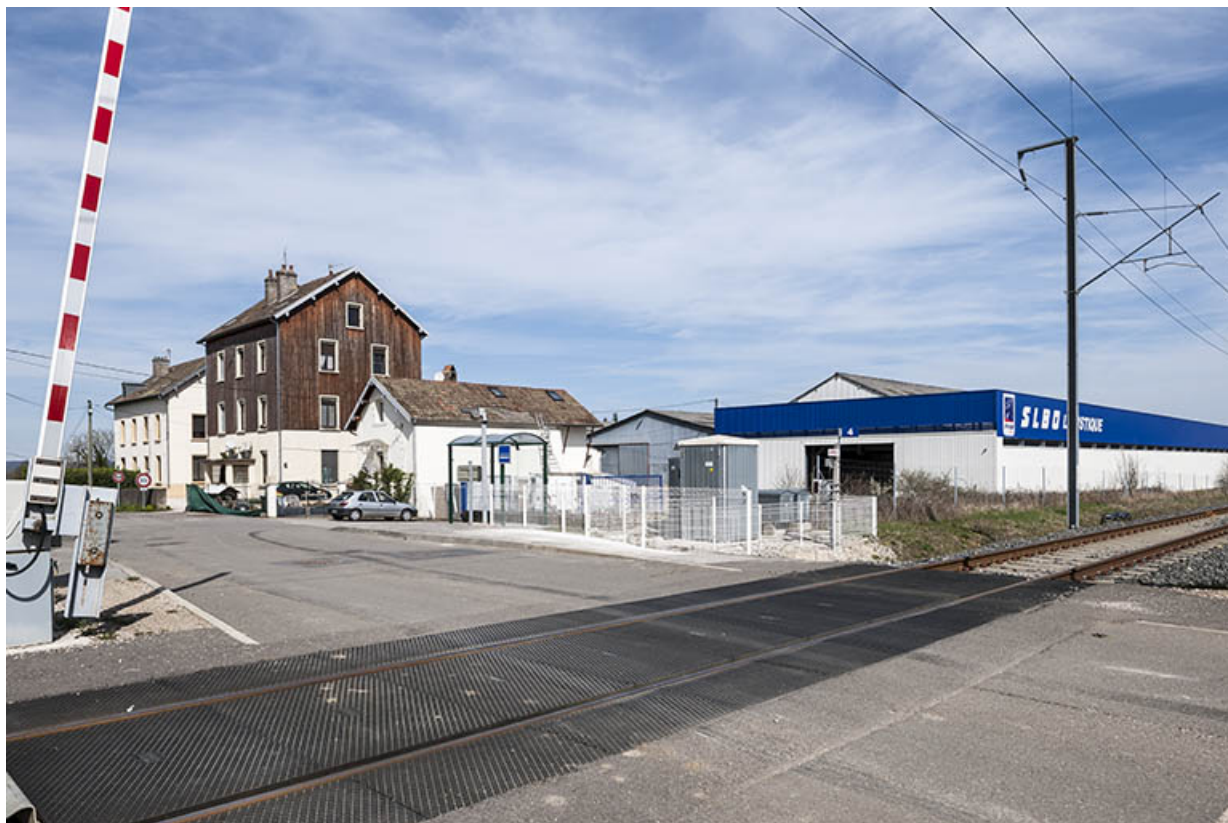
Vue d'ensemble depuis le sud.