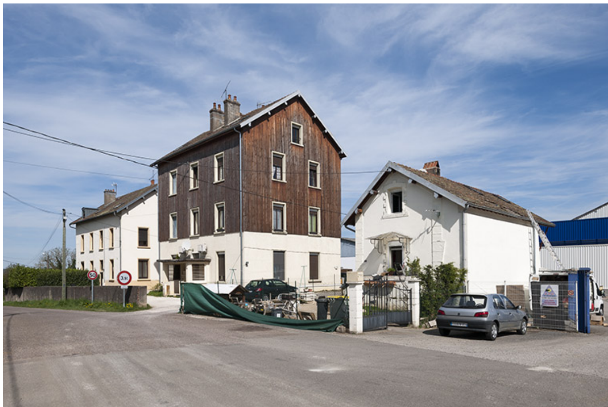
Logements, bureaux et conciergerie depuis la route.