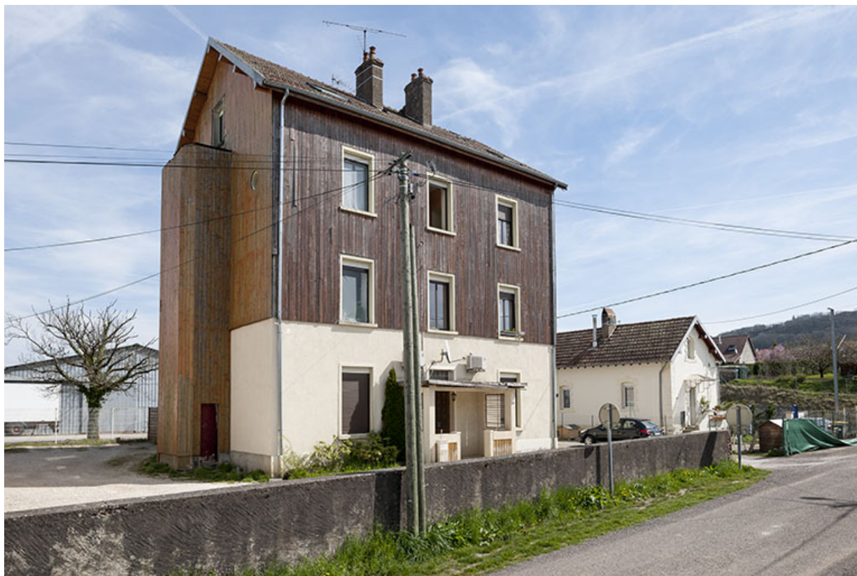
Ancien bâtiment de bureaux et logements.