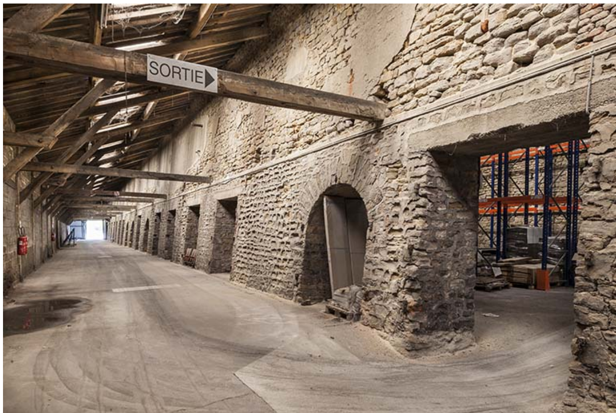
Ancien quai de chargement.