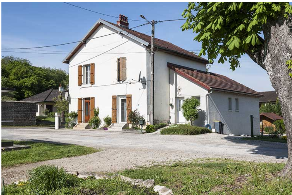
Logement ouvrier double (8-10 allée des Rompeux).