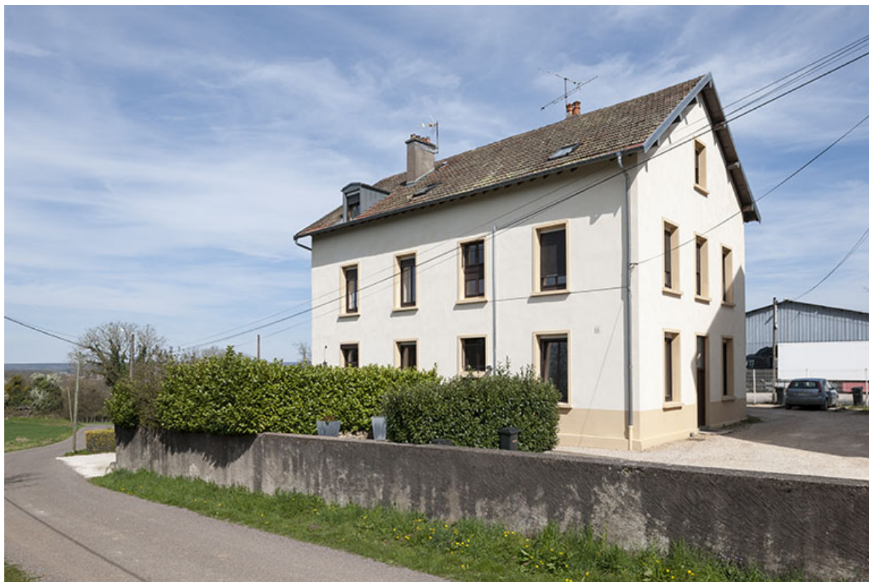
Logements (ancien bâtiment des contributions indirectes).