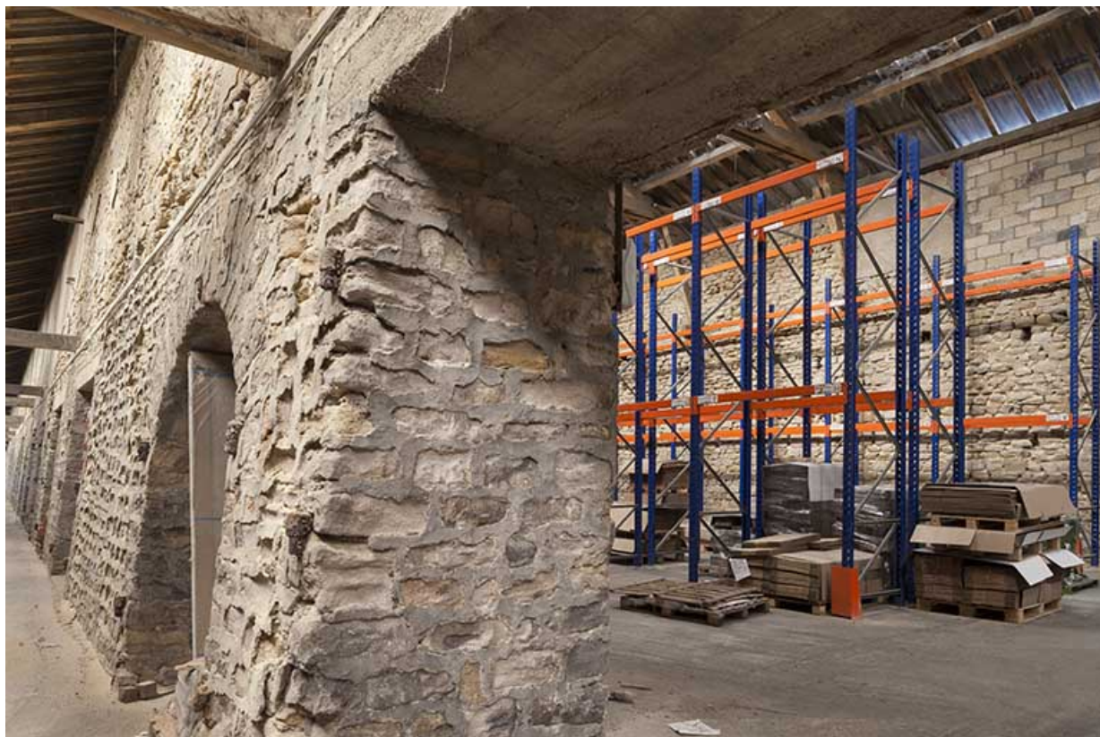
Mur séparant le quai de l'atelier (ouvertures modifiées).