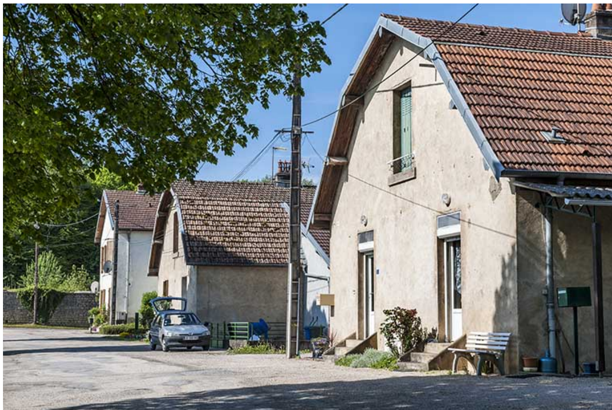
Pignons des logements ouvriers (allée des Rompeux).