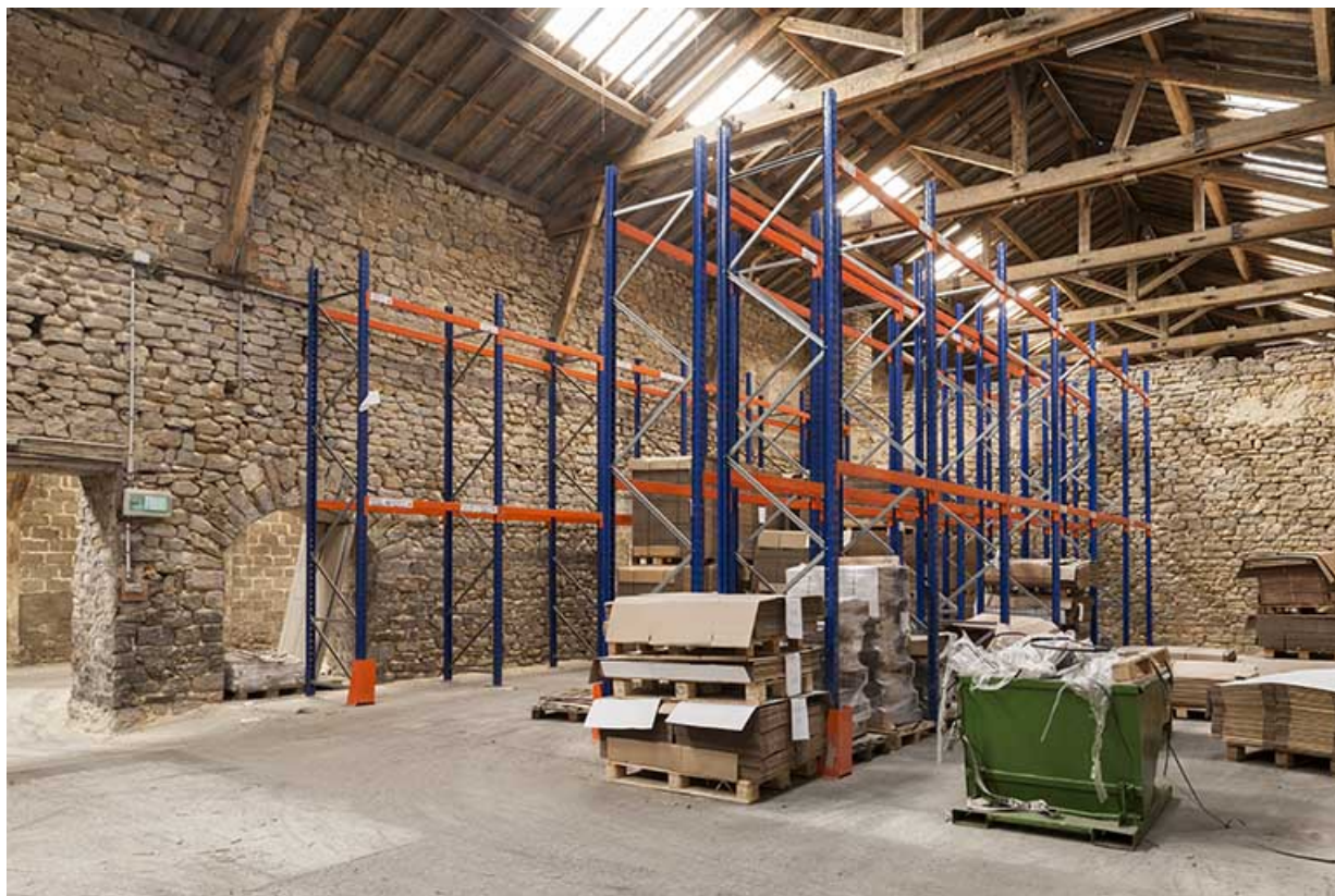
Berne (ancienne salle de fabrication).