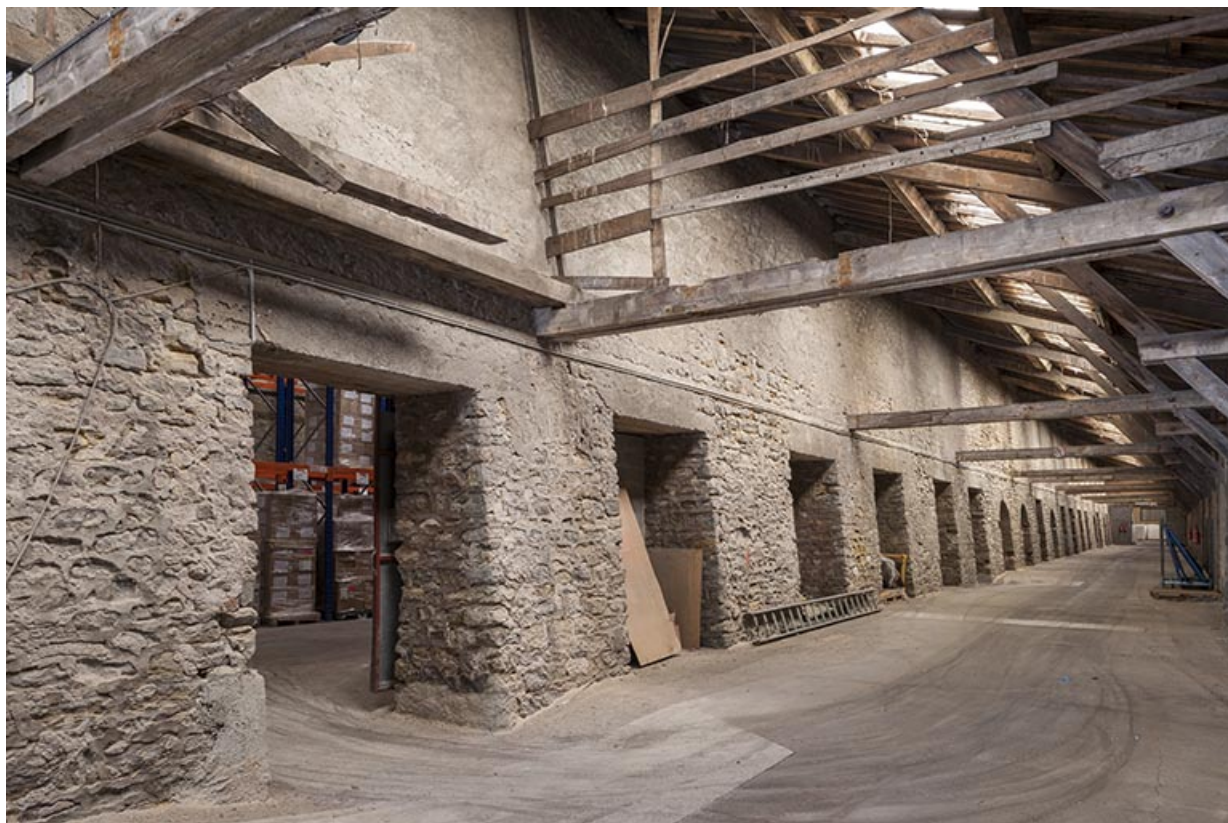
Atelier de fabrication (berne) : ancien quai. 25, Geneuille, 20 chemin des Salines