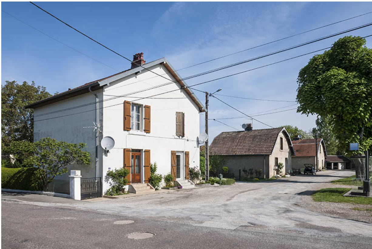
Logements ouvriers (4 à 10 allée des Rompeux).