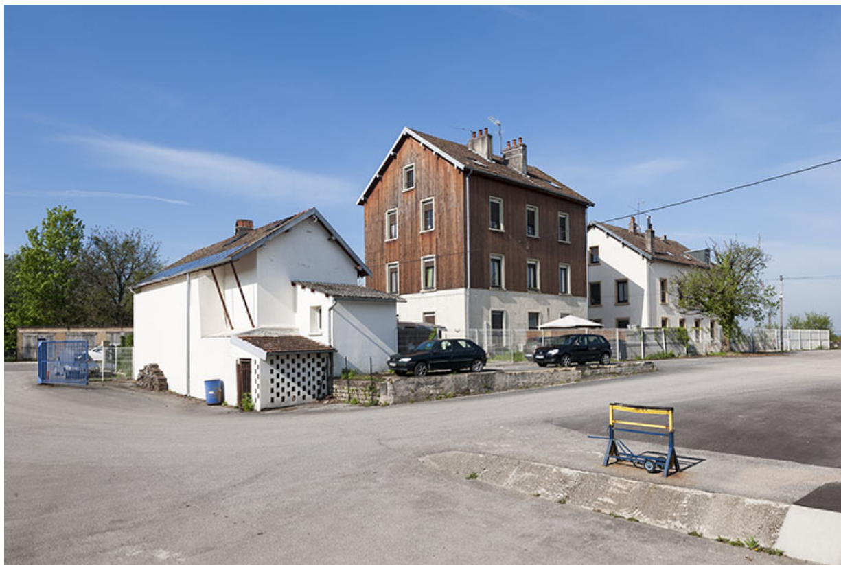
Conciergerie, bureaux et logements depuis la cour.