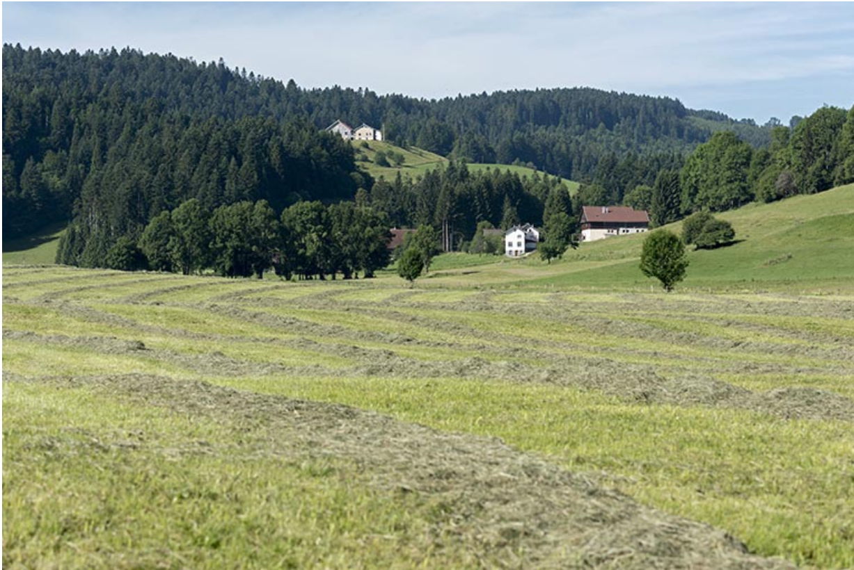
Vue d'ensemble éloignée des Jean-Jacquot, depuis le nord-est.

25, Les Gras, 24 rue les Jean-Jacquot, lieudit : les Jean-Jacquot