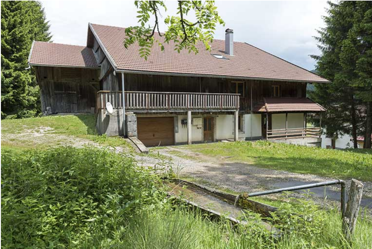
Façade latérale gauche, de trois quarts gauche, avec la fontaine.

25, Les Gras, 24 rue les Jean-Jacquot, lieudit : les Jean-Jacquot