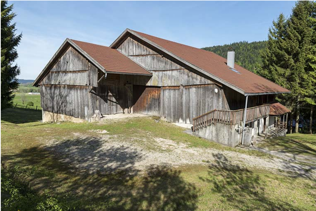
Façades postérieure et latérale gauche.

25, Les Gras, 24 rue les Jean-Jacquot, lieudit : les Jean-Jacquot