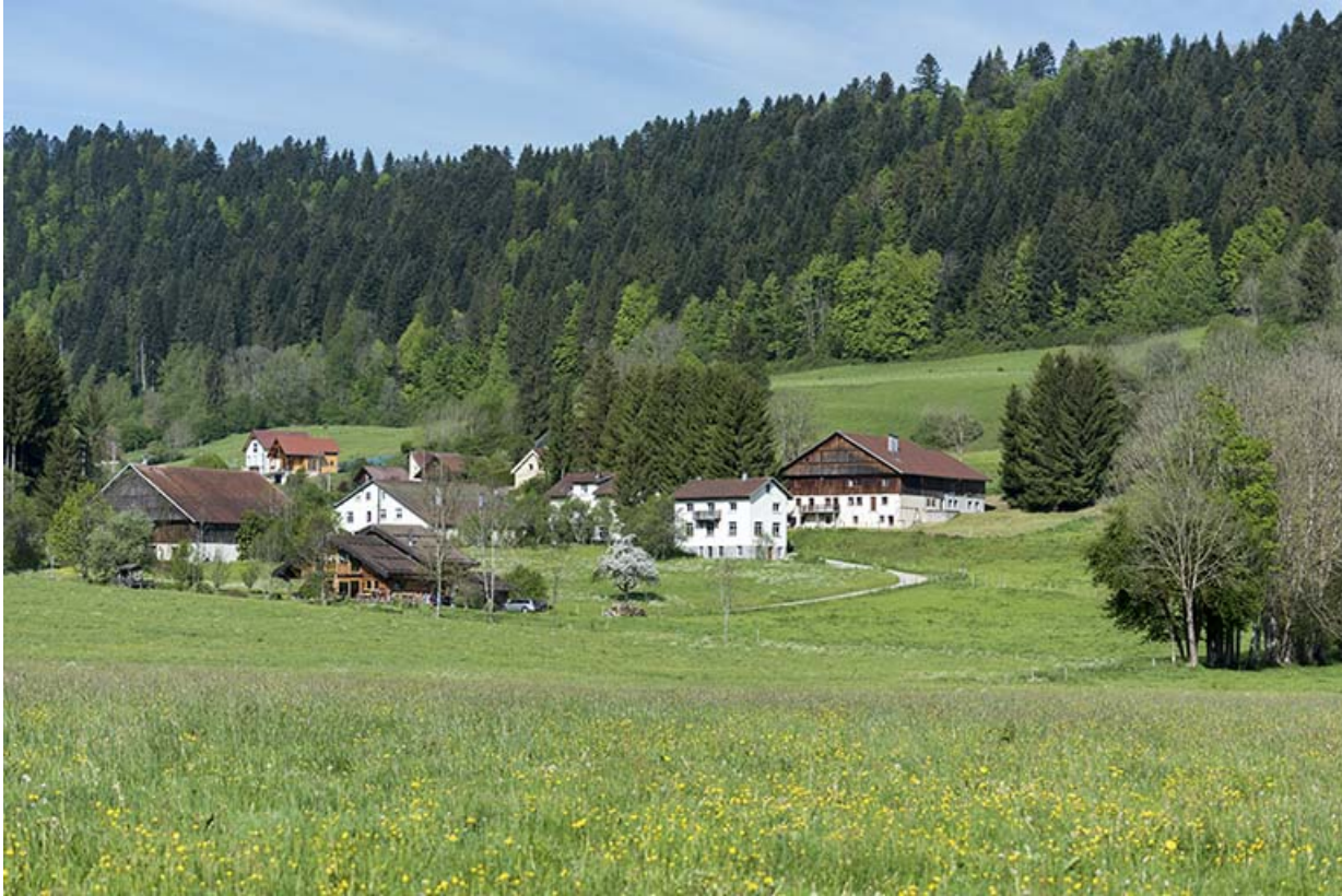
Vue d'ensemble des Jean-Jacquot, depuis l'est.

25, Les Gras, 24 rue les Jean-Jacquot, lieudit : les Jean-Jacquot