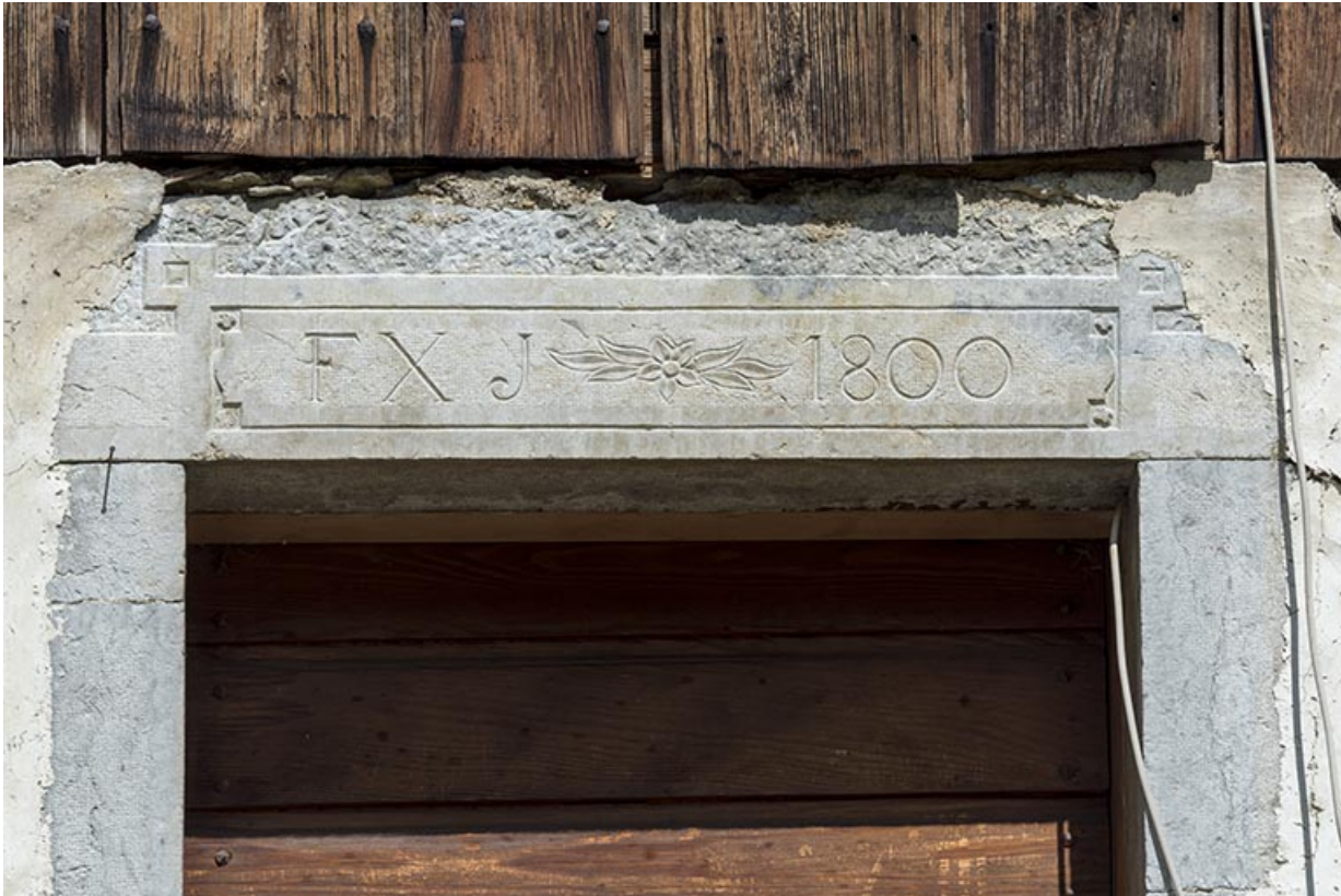
Date 1800 portée (façade antérieure).

25, Les Gras, 24 rue les Jean-Jacquot, lieudit : les Jean-Jacquot