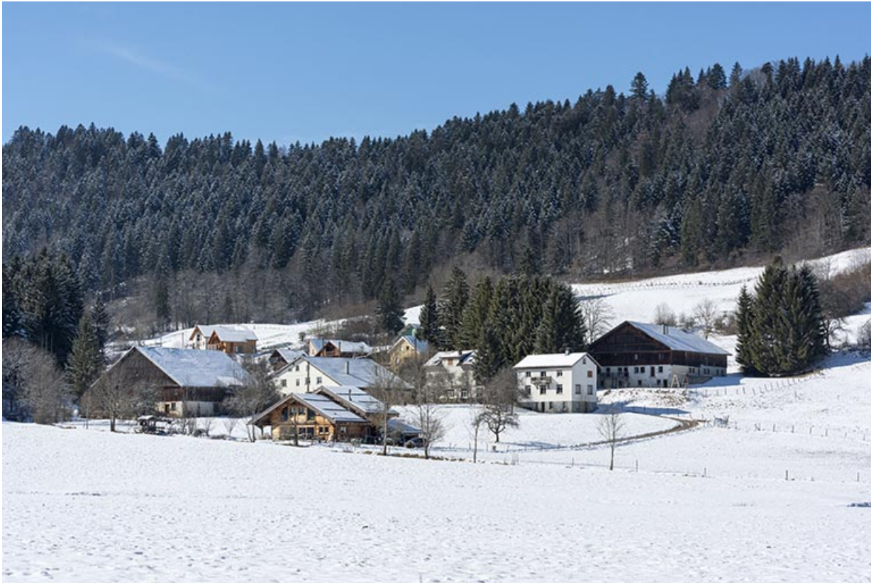
Vue d'ensemble des Jean-Jacquot, depuis l'est, en hiver.

25, Les Gras, 24 rue les Jean-Jacquot, lieudit : les Jean-Jacquot