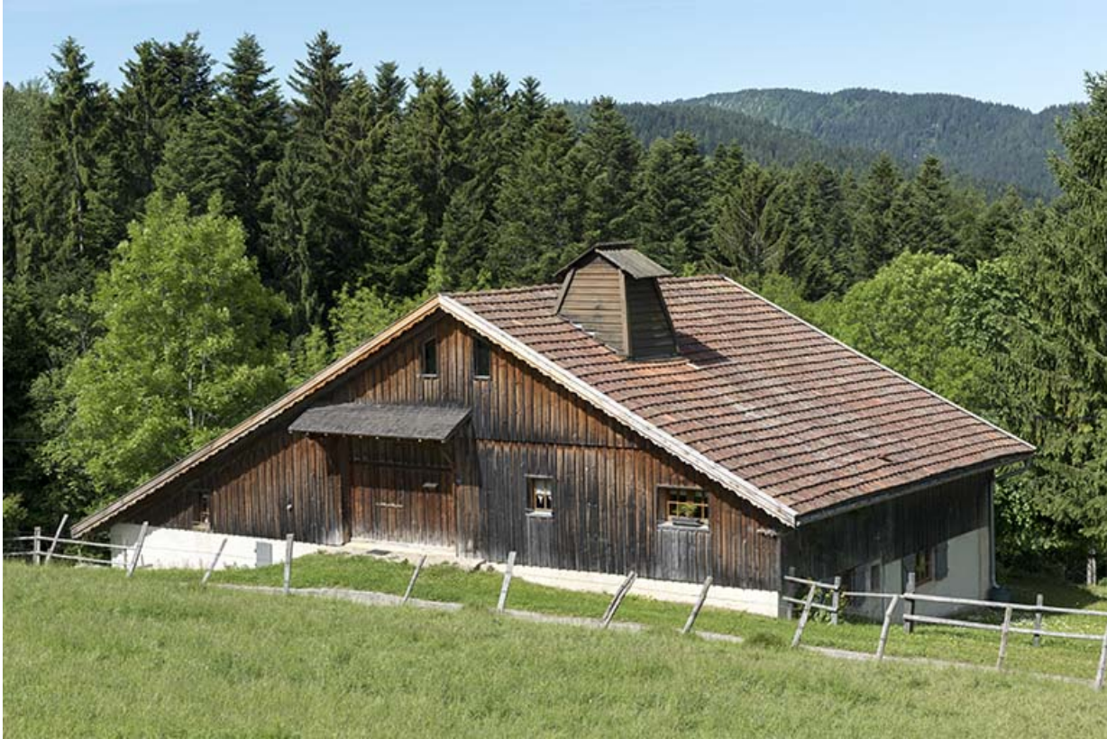
Elévations est (avec sa levée de grange) et nord.