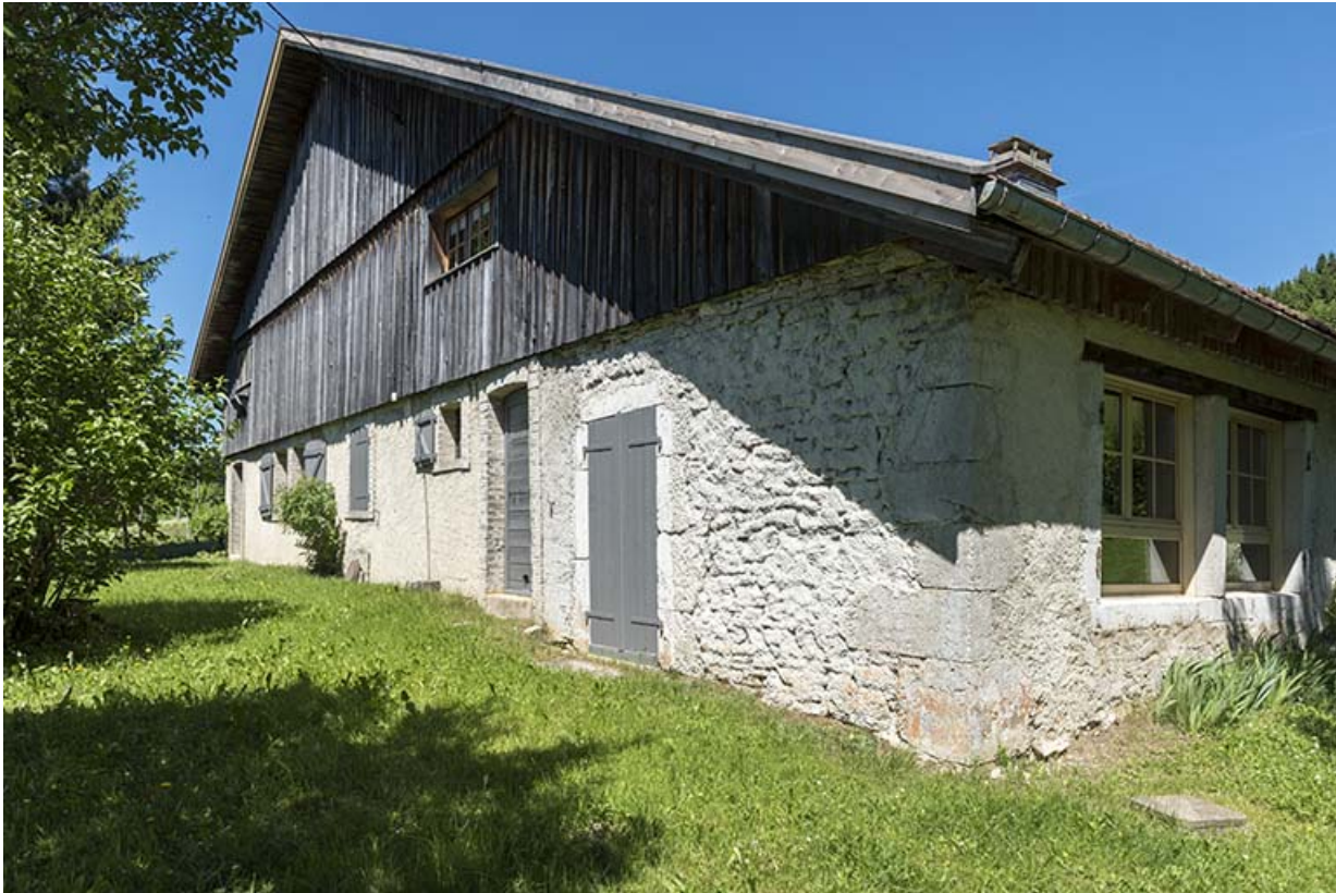
Elévation ouest, vue en enfilade.