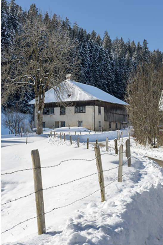
Façades nord et est, en hiver.

25, Les Gras, 65 rue les Seignes, lieudit : les Seignes