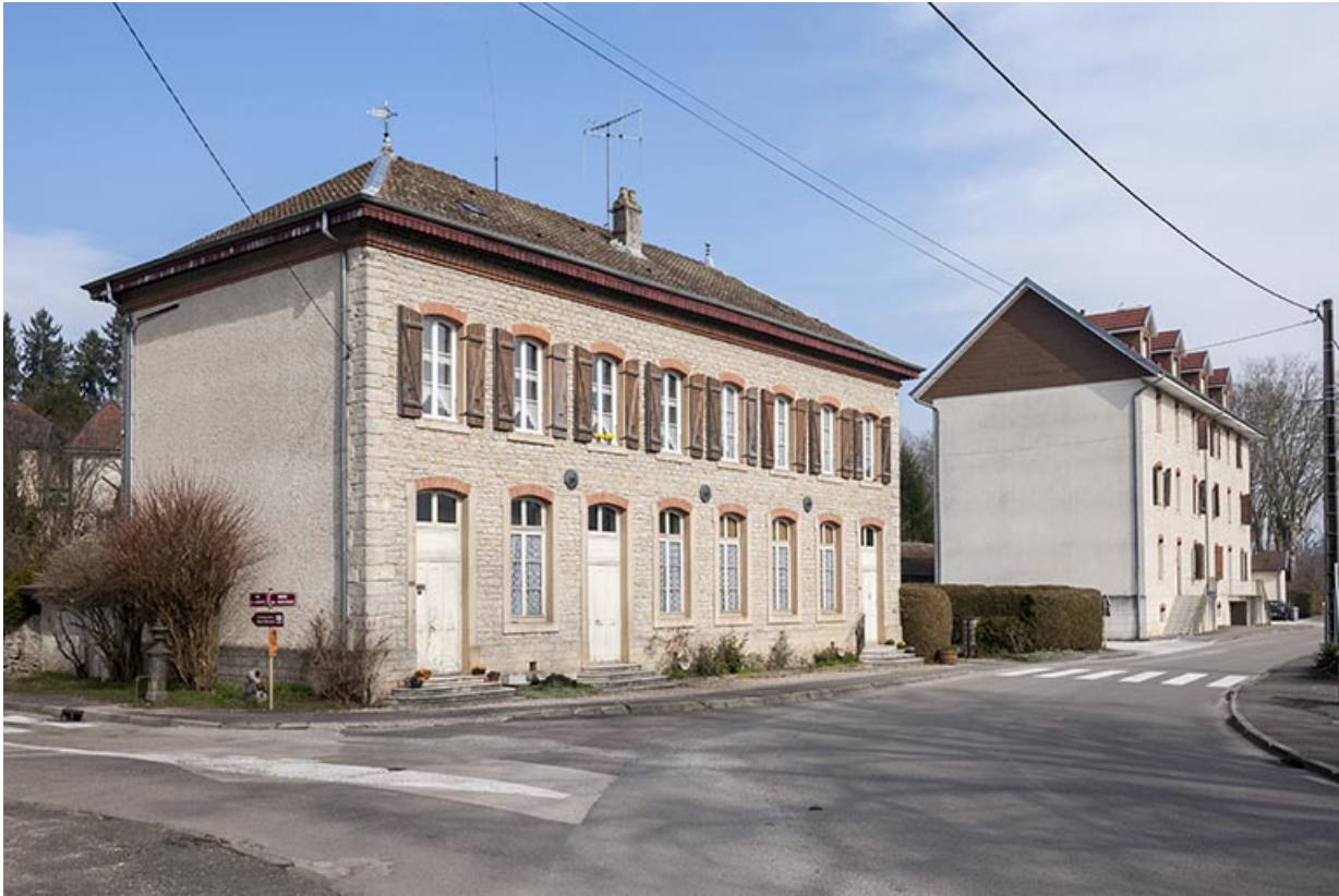
Vue d'ensemble depuis le sud.

25, Geneuille, 13, 15 route des Papetiers