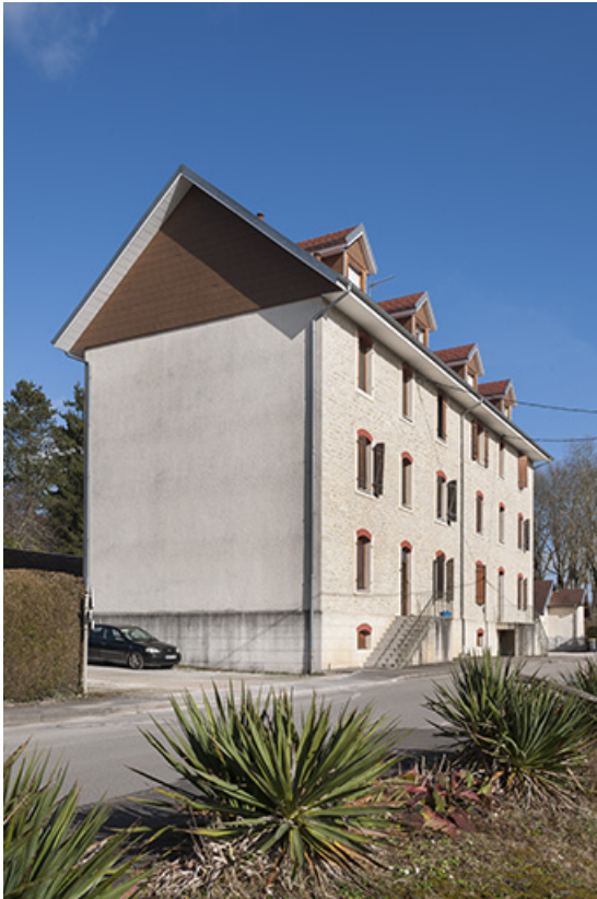
Immeuble de logements. Vue d'ensemble.

25, Geneuille, 13, 15 route des Papetiers