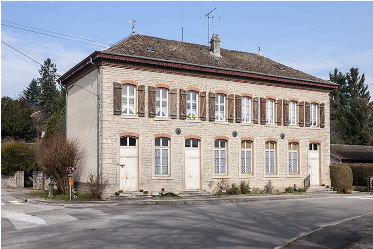
Bâtiment de l'école et du magasin coopératif. Vue d'ensemble.

25, Geneuille, 13, 15 route des Papetiers