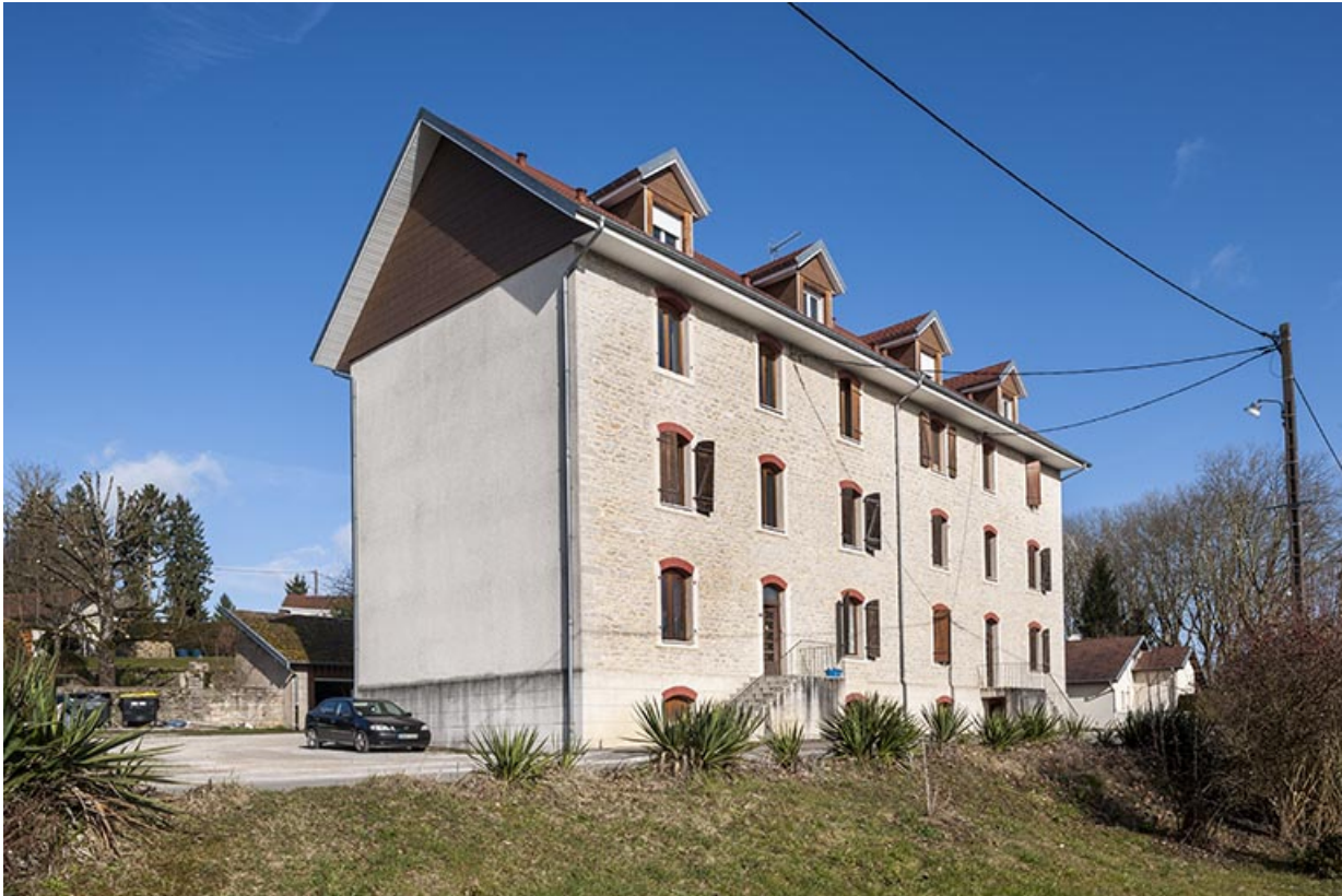
Immeuble de logements. Vue de trois quarts gauche.

25, Geneuille, 13, 15 route des Papetiers