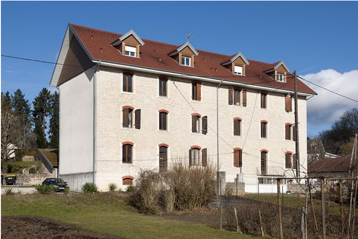
Immeuble de logements. Vue depuis le sud.

25, Geneuille, 13, 15 route des Papetiers