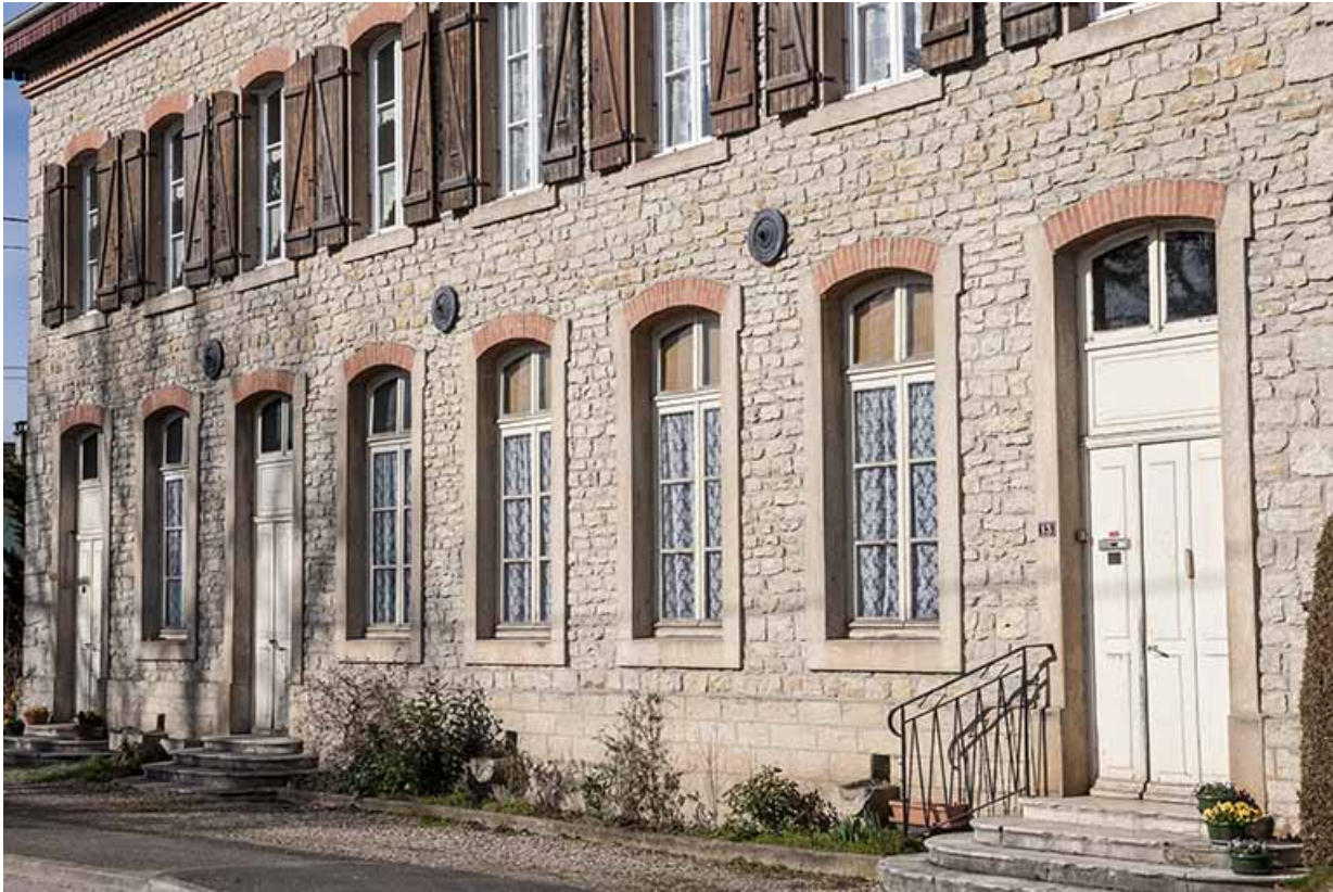
Bâtiment de l'école et du magasin coopératif. Détail de la façade.

25, Geneuille, 13, 15 route des Papetiers