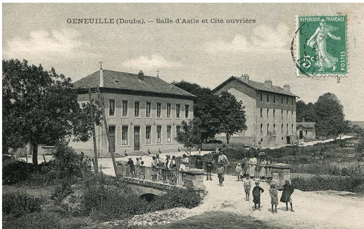
Geneuille (Doubs) - Salle d'asile et cité ouvrière, carte postale, s.d. [fin 19e ou début 20e siècle].

25, Geneuille, 13, 15 route des Papetiers