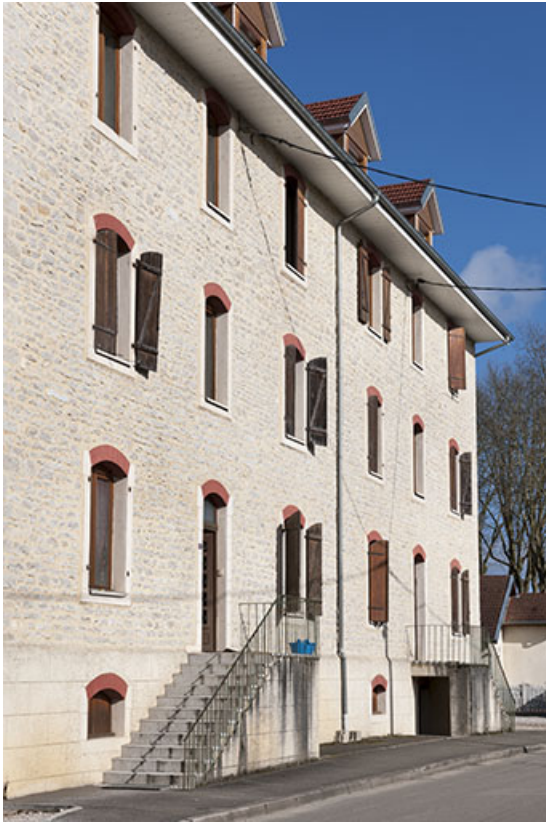
Immeuble de logements. Façade antérieure vue de trois quarts.

25, Geneuille, 13, 15 route des Papetiers