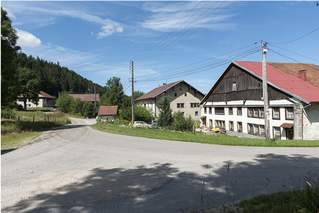
Vue d'ensemble des Seignes, depuis l'est.

25, Les Gras, 60 rue les Seignes, lieudit : les Seignes