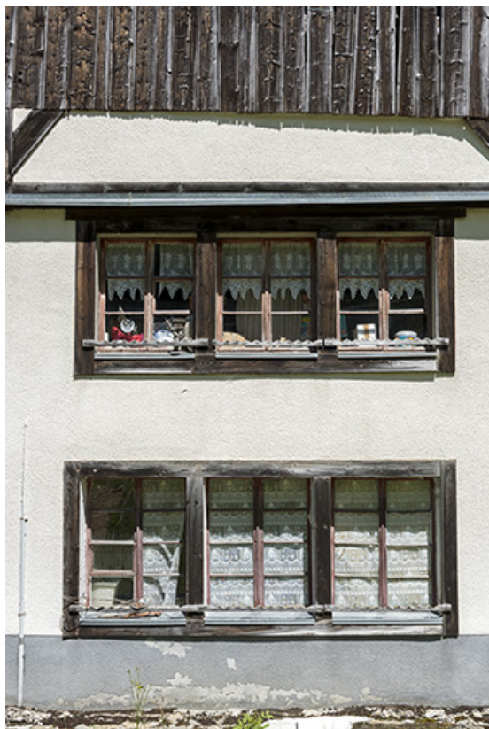
Façade antérieure : fenêtres multiples.

25, Les Gras, 60 rue les Seignes, lieudit : les Seignes