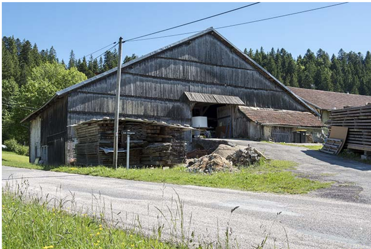
Façade postérieure, de trois quarts gauche.

25, Les Gras, 60 rue les Seignes, lieudit : les Seignes