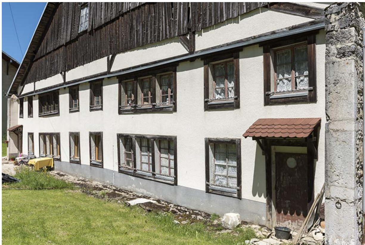
Façade antérieure, vue en enfilade.

25, Les Gras, 60 rue les Seignes, lieudit : les Seignes