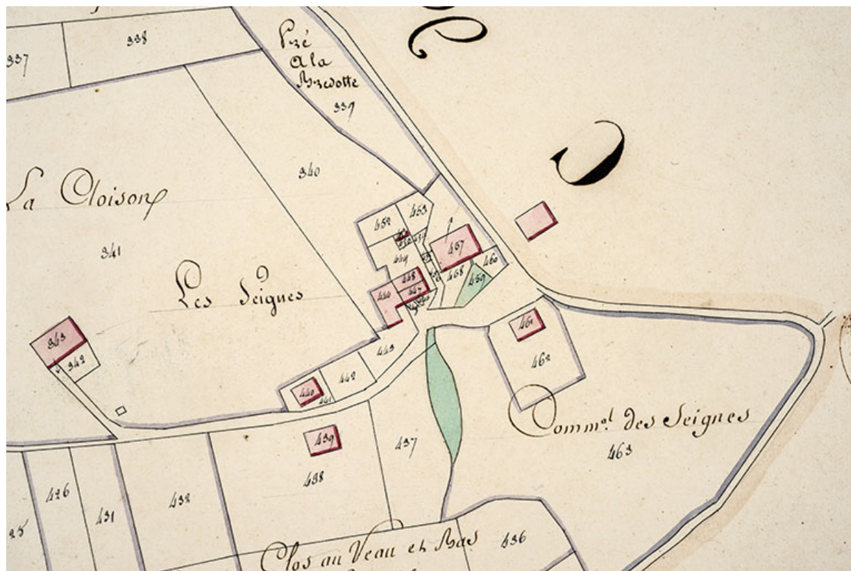
Cadastre de la commune des Gras. Atlas parcellaire, 1816, section D 2e feuille [détail : les Seignes], 1/2 500. 25, Les Gras, 60 rue les Seignes, lieudit : les Seignes