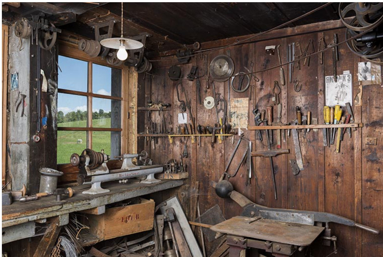
Atelier : outils, tour Burri Frères (Tramelan, Suisse) et massicot. 25, Les Gras, 61 rue les Seignes, lieudit : les Seignes