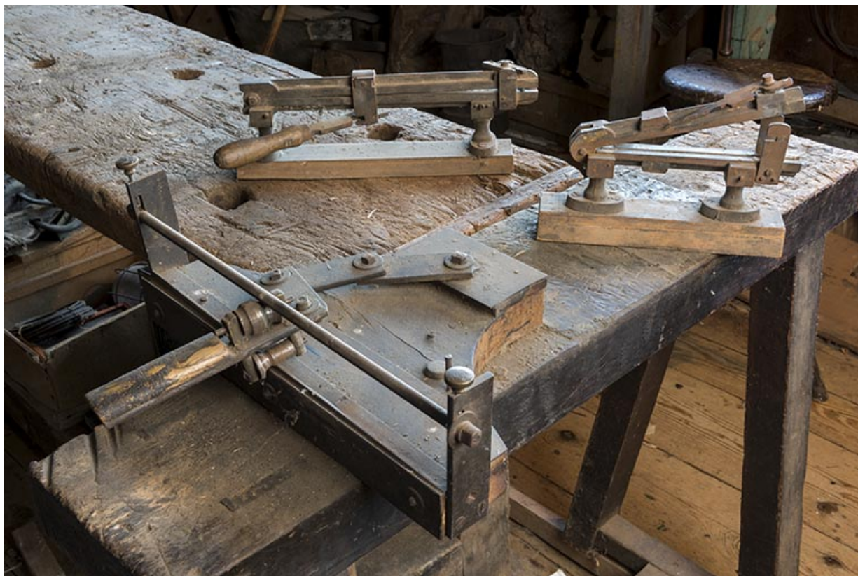
Atelier : machine à redresser les barres et autres machines.

25, Les Gras, 61 rue les Seignes, lieudit : les Seignes