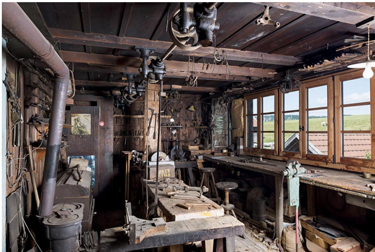
Atelier à l'étage : vue d'ensemble.

25, Les Gras, 61 rue les Seignes, lieudit : les Seignes