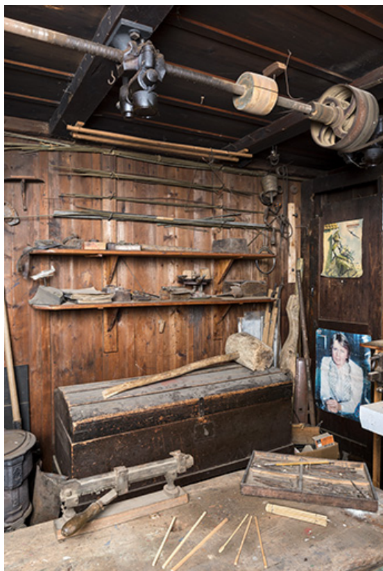
Atelier : établi, transmission, stockage des barres métalliques au mur.

25, Les Gras, 61 rue les Seignes, lieudit : les Seignes