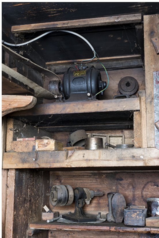
Atelier : moteur électrique et étagères.

25, Les Gras, 61 rue les Seignes, lieudit : les Seignes