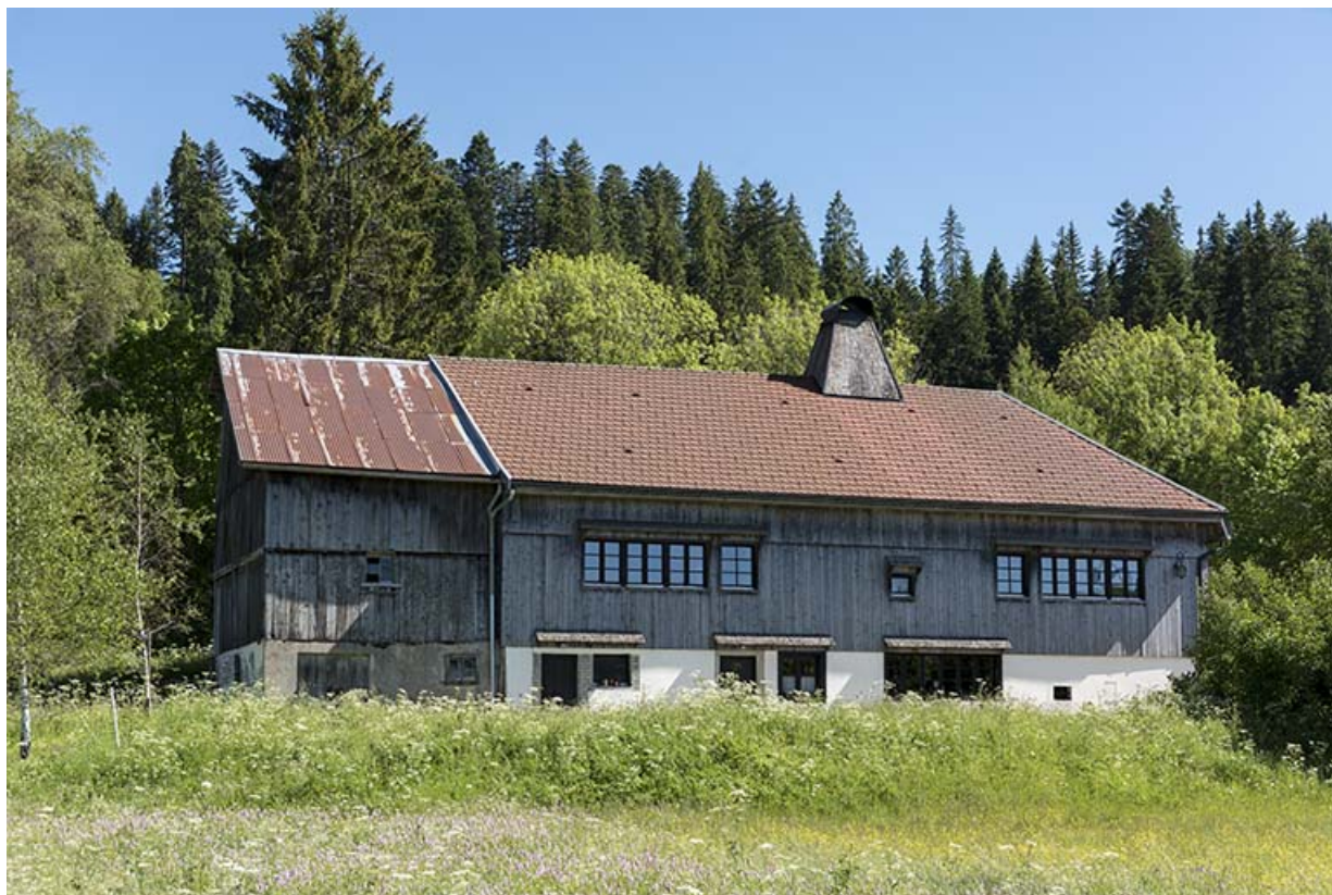
Les Seignes : ferme (1779) et atelier d'outillage de Juvénal Garnache-Barthod puis d'Urbain Voynet, 61 les Seignes. 25, Les Gras, 61 rue les Seignes, lieudit : les Seignes