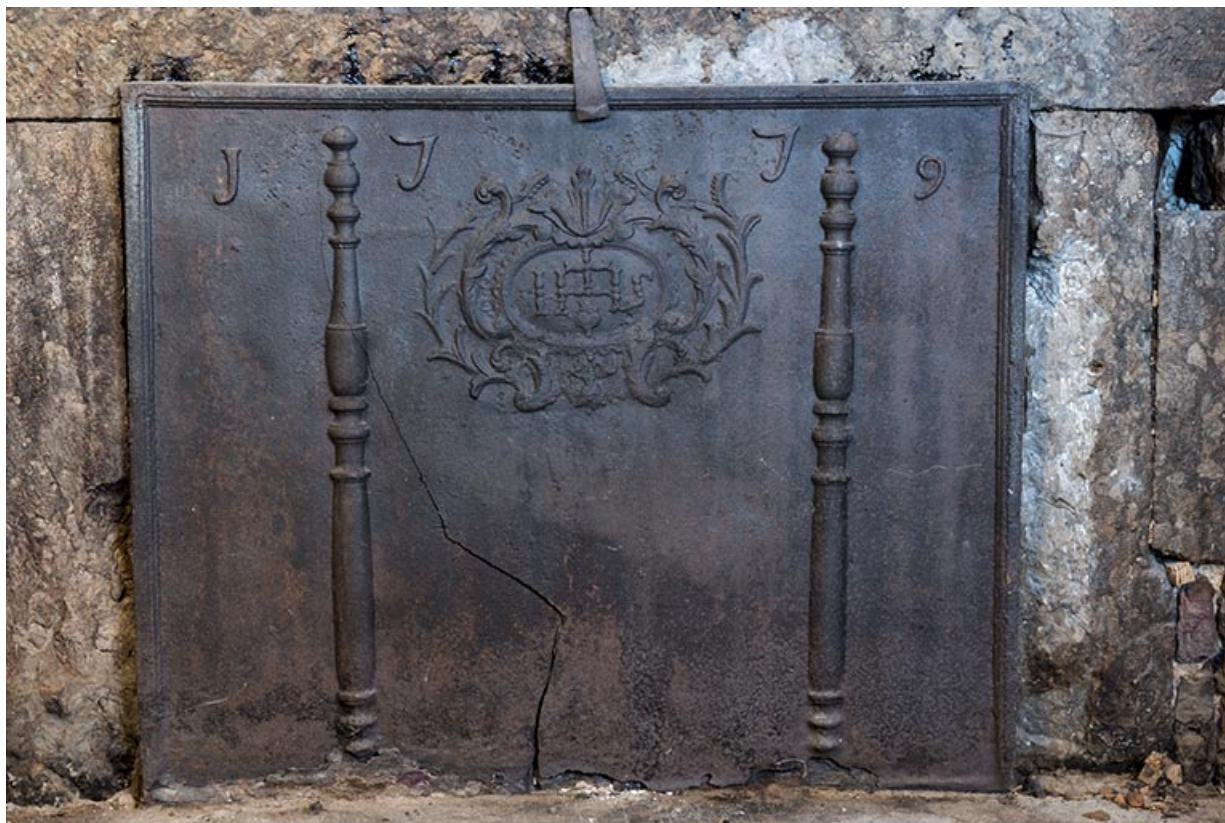
Plaque de cheminée datée 1779.

25, Les Gras, 61 rue les Seignes, lieudit : les Seignes