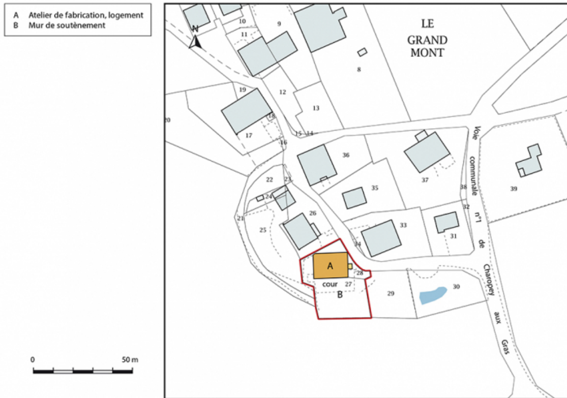
Plan-masse et de situation. Extrait du plan cadastral, 2017, section AD, 1/1 000. 25, Les Gras, 28 rue le Grand Mont, lieudit : le Grand Mont