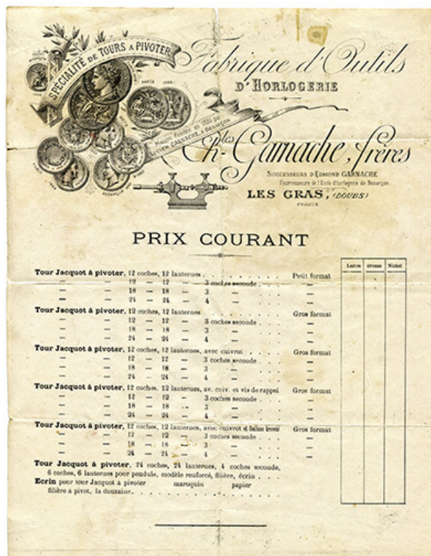
Prix courant de la société Charles Garnache Frères, s.d. [limite 19e siècle 20e siècle]. 25, Besançon