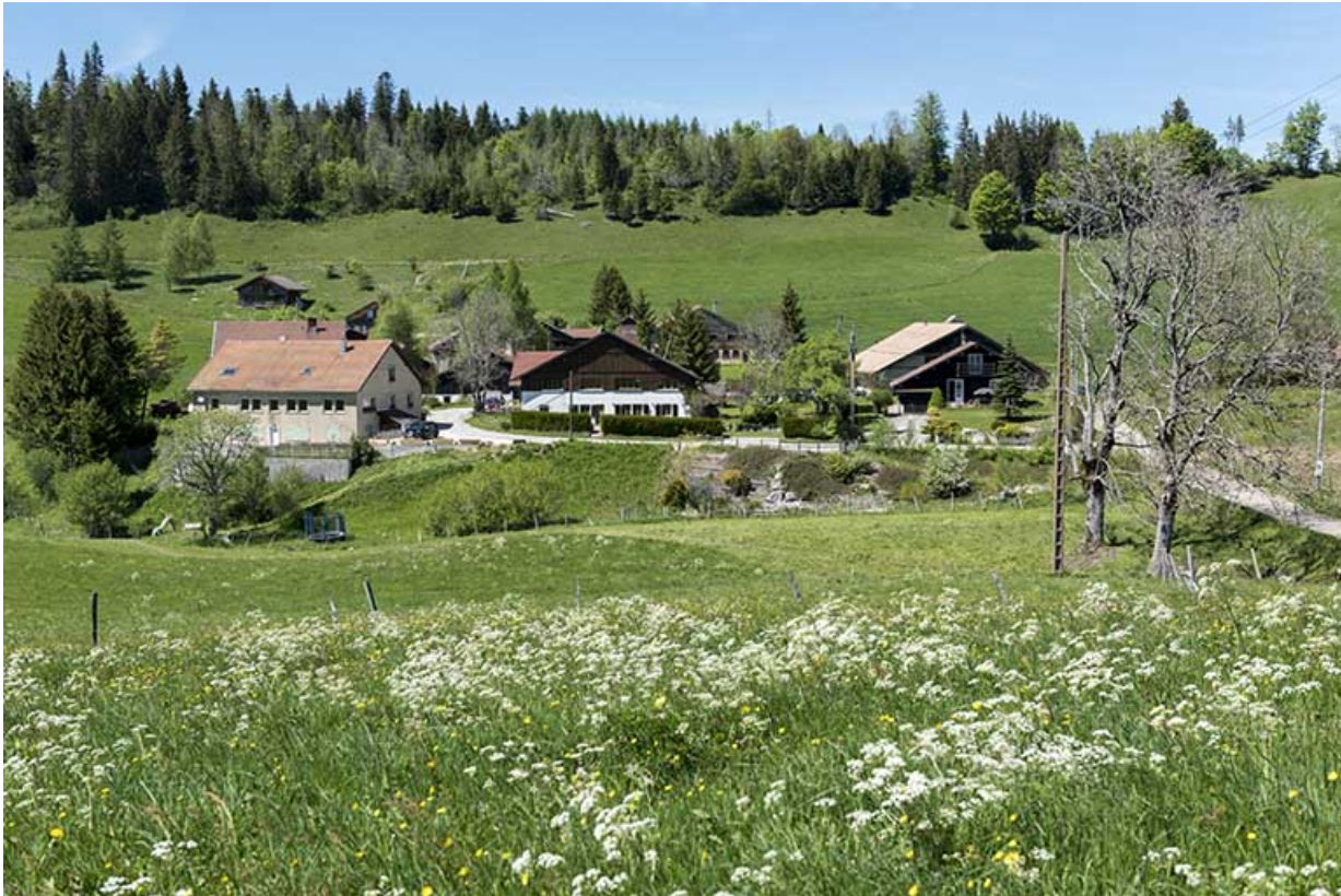
Vue d'ensemble du Grand Mont, depuis le sud.

25, Les Gras, 28 rue le Grand Mont, lieudit : le Grand Mont