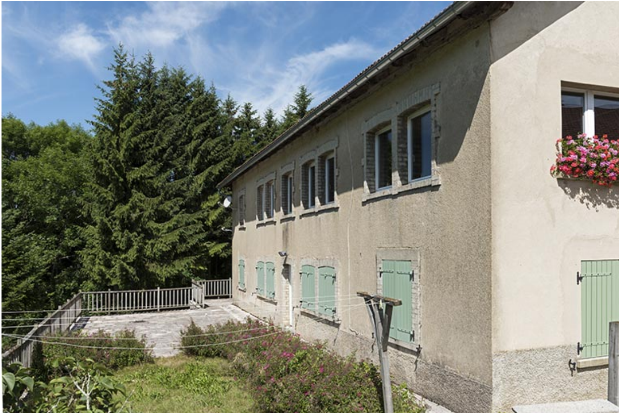
Façade sud, vue en enfilade.

25, Les Gras, 28 rue le Grand Mont, lieudit : le Grand Mont