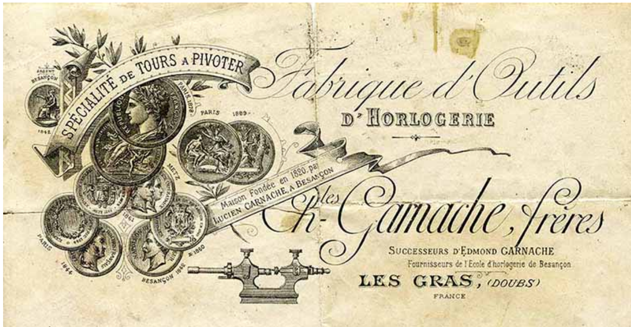
Prix courant de la société Charles Garnache Frères [détail de l'en-tête], s.d. [limite 19e siècle 20e siècle]. 25, Besançon