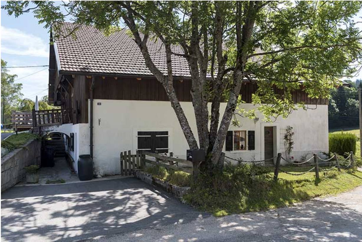
Façade latérale gauche et pont de grange.

25, Les Gras, 19 rue le Grand Mont, lieudit : le Grand Mont