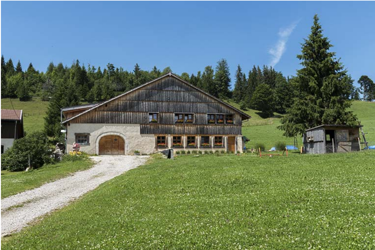
Le Grand Mont : ferme (18e siècle ou début 19e siècle) et atelier d'outillage de Philimin puis d'Ernest Dornier, 10 le Grand Mont. 25, Les Gras, 10 rue le Grand Mont, lieudit : le Grand Mont