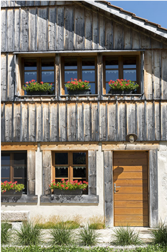
Façade antérieure : fenêtre multiple.

25, Les Gras, 10 rue le Grand Mont, lieudit : le Grand Mont