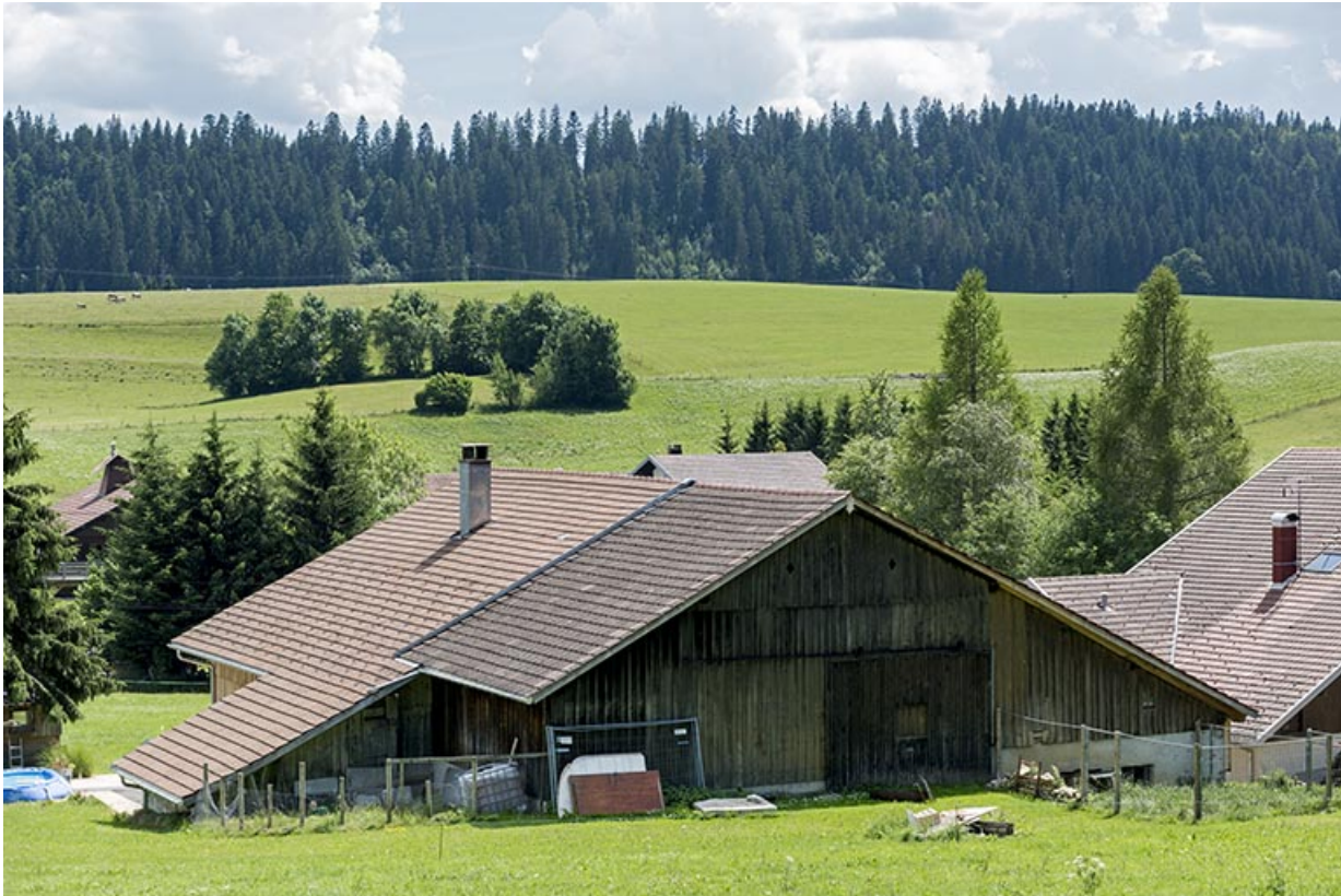
Façade postérieure, de trois quarts gauche.

25, Les Gras, 10 rue le Grand Mont, lieudit : le Grand Mont