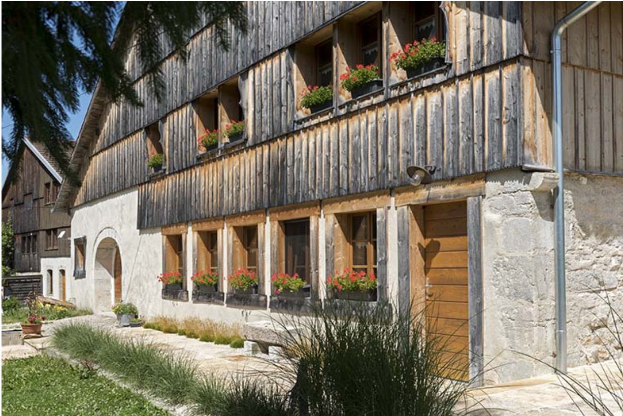
Façade antérieure, vue en enfilade.

25, Les Gras, 10 rue le Grand Mont, lieudit : le Grand Mont