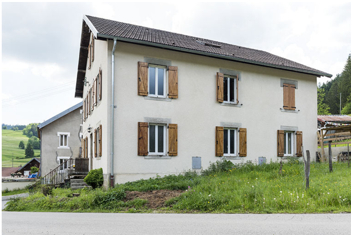
Façade latérale droite.

25, Les Gras, 11 rue les Epaisses, lieudit : les Epaisses