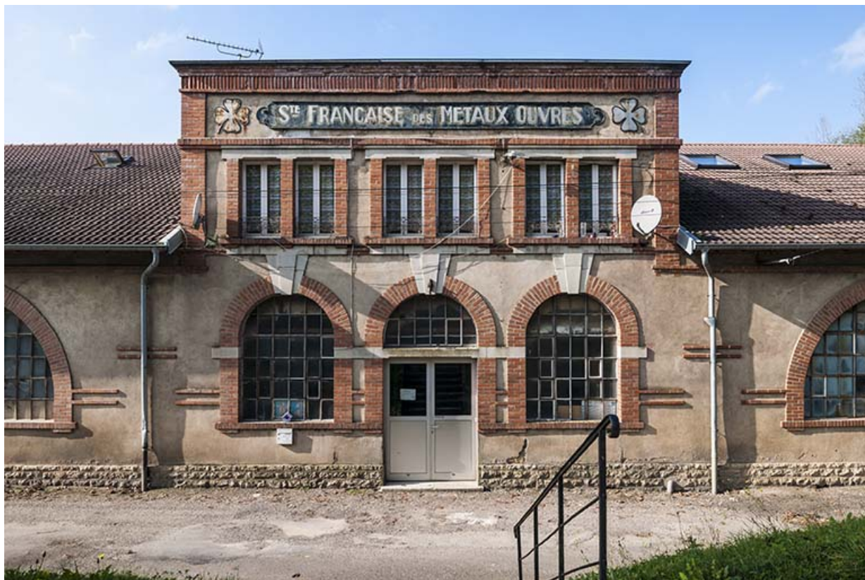
Atelier de fabrication de la Société française des Métaux ouvrés. Travée centrale.