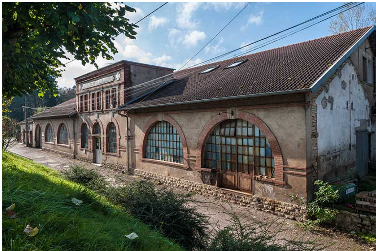
Atelier de fabrication sud. Vue de trois quarts droite.