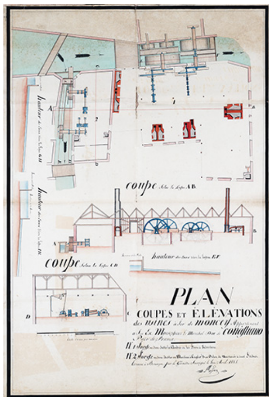
Plan, coupes et élévations des usines à fer de Moncey [...], 1828.