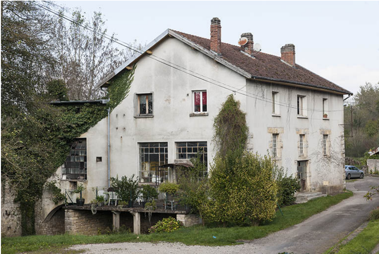
Atelier nord de la Société française des Métaux ouverts.