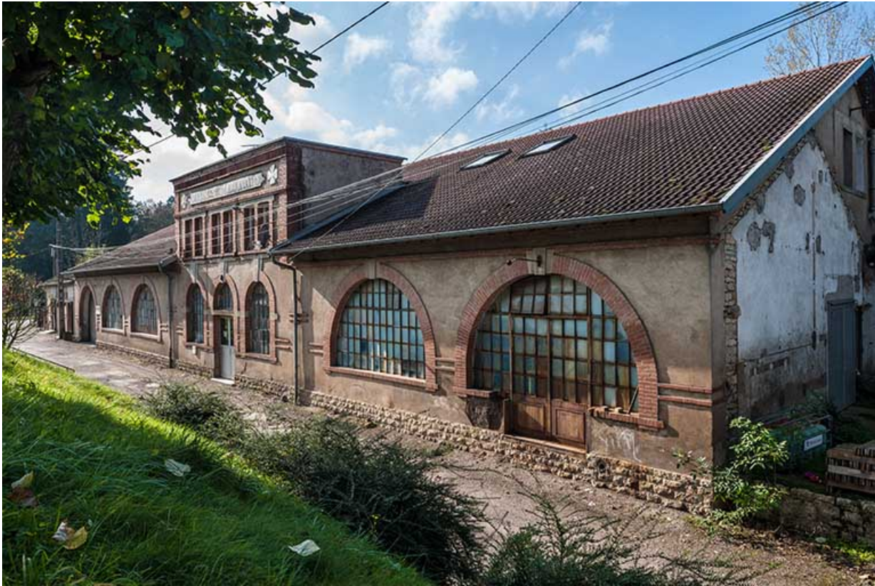
Atelier de fabrication sud. Vue de trois quarts droite.