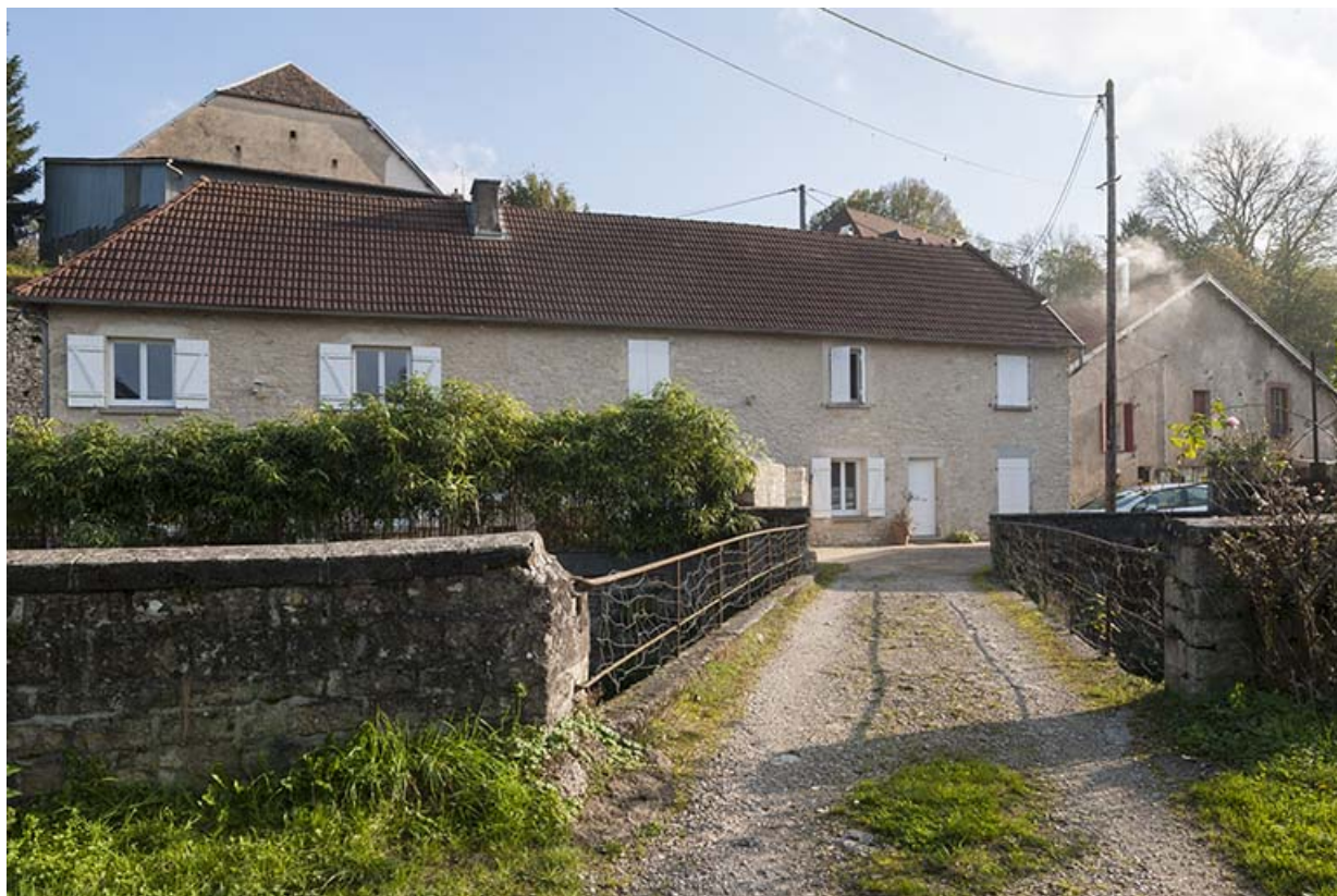
Façade ouest du logement patronal.