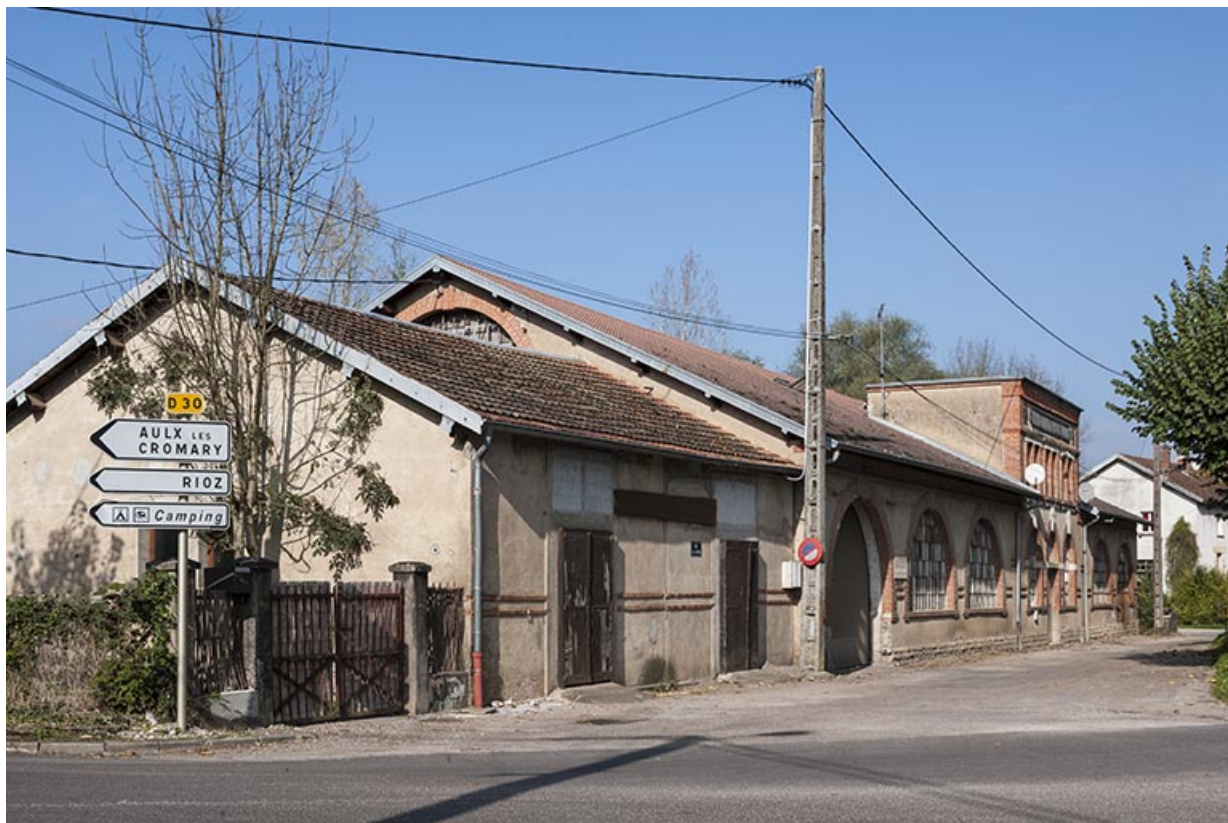
Atelier de fabrication sud de la Société française des Métaux ouvrés. Vue de trois quarts gauche. 25, Moncey, 1 à 5 rue André Fournaud