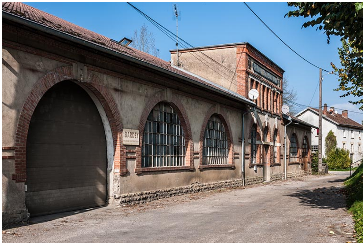
Façade est de l'atelier de la Société française des Métaux ouvriers.