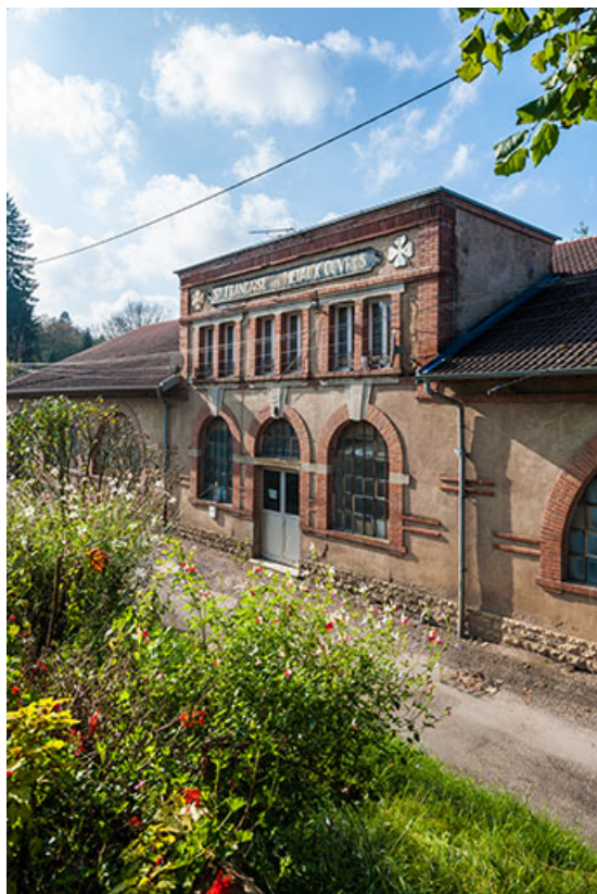
Travée centrale de l'atelier.