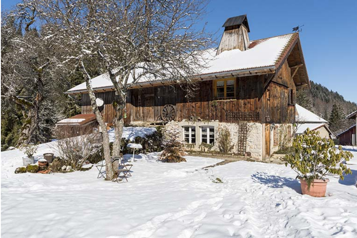
Façade latérale gauche, de trois quarts droite, en hiver.

25, Les Gras, 14 rue les Epaisses, lieudit : les Epaisses