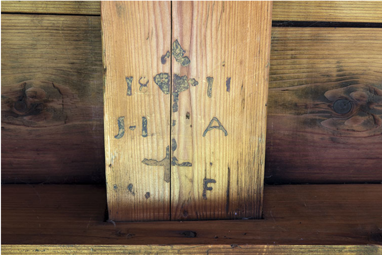
Date et initiales inscrites sur une poutre.

25, Les Gras, 14 rue les Epaisses, lieudit : les Epaisses