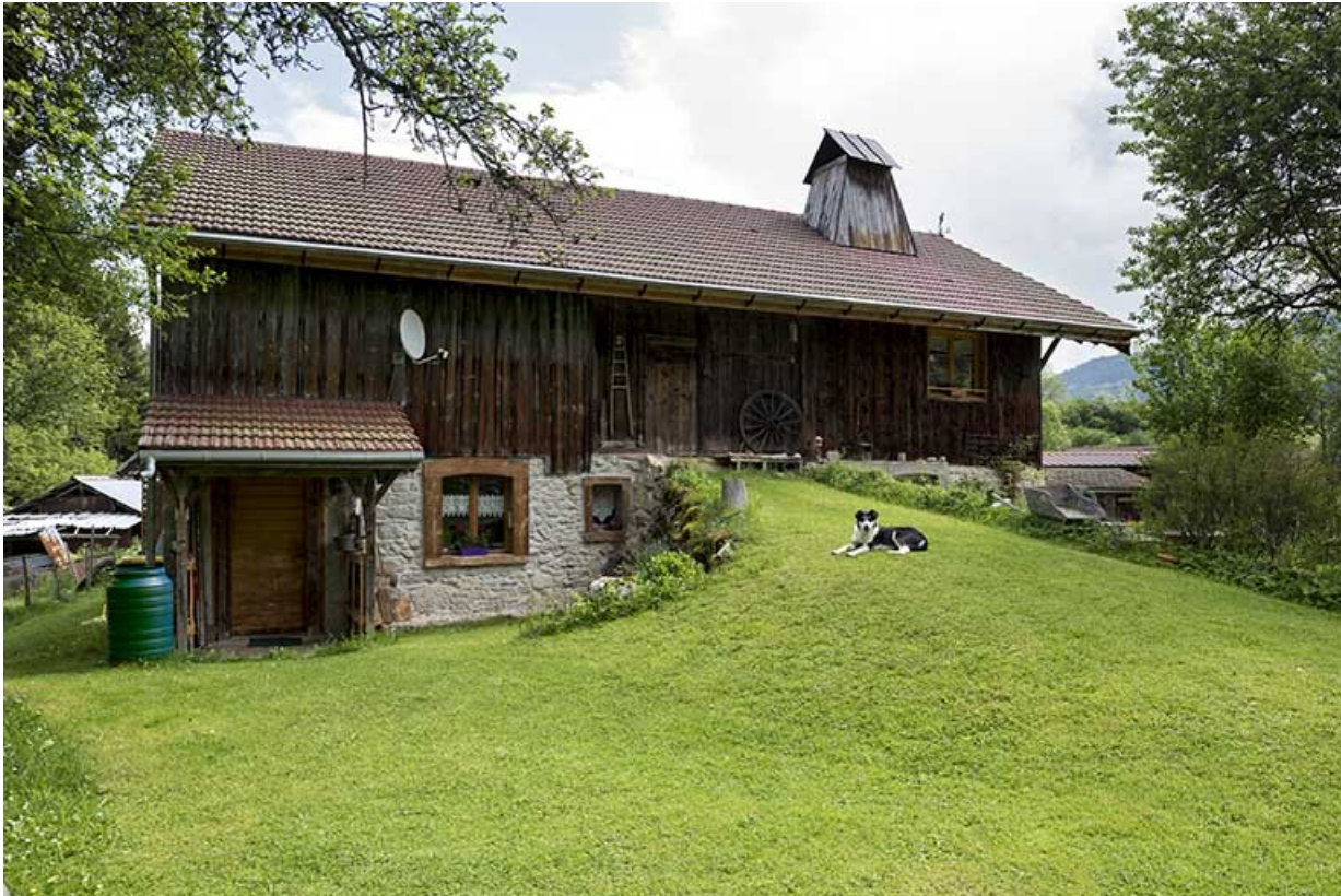
Façade latérale gauche.

25, Les Gras, 14 rue les Epaisses, lieudit : les Epaisses