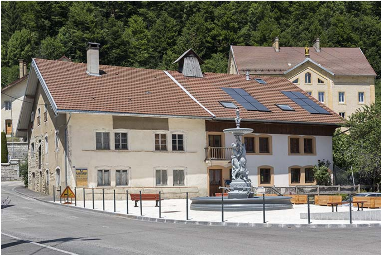
Façade antérieure, de trois quart gauche.

25, Les Gras, 5-6 place de la Libération et du Souvenir français