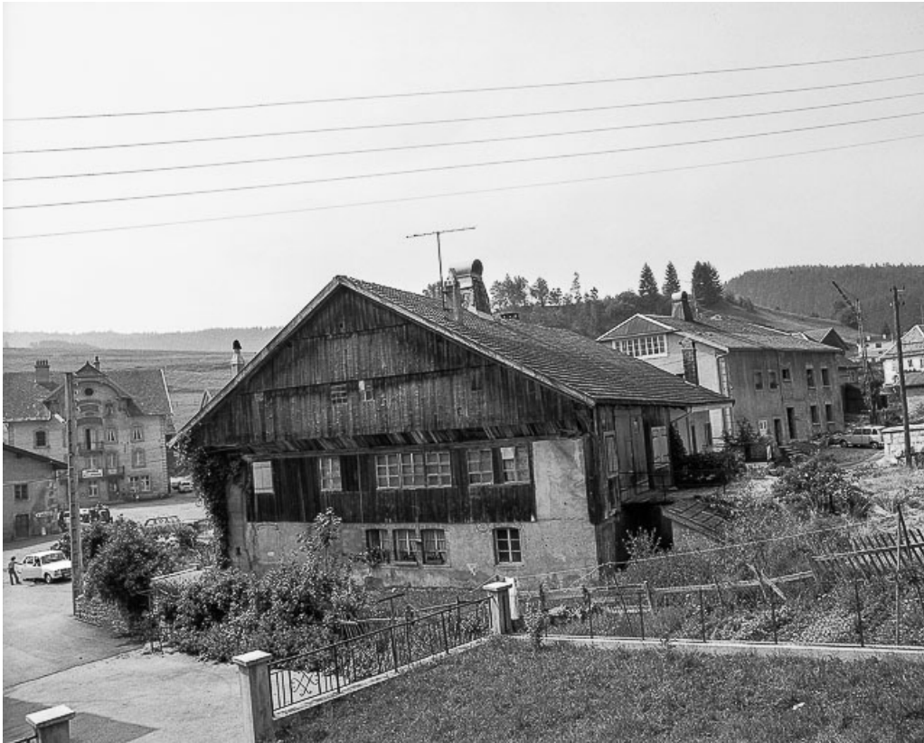
Ferme située sur la place du village.

25, Les Gras, 5-6 place de la Libération et du Souvenir français