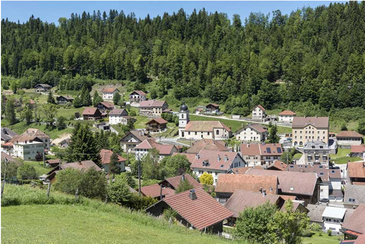
Vue d'ensemble du centre du village, depuis l'est.