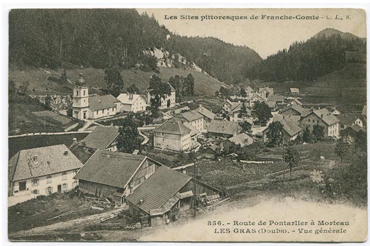
Les sites pittoresques de Franche-Comté. 856. Route de Pontarlier à Morteau. Les Gras (Doubs). - Vue générale, 1er quart 20e siècle [entre 1908 et 1917].