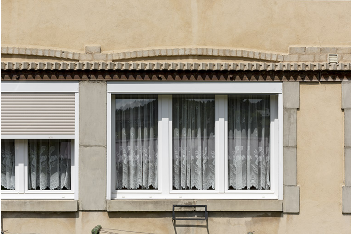
Baie d'atelier au rez-de-chaussée de la façade latérale droite.

25, Les Gras, 8 place de la Libération et du Souvenir français