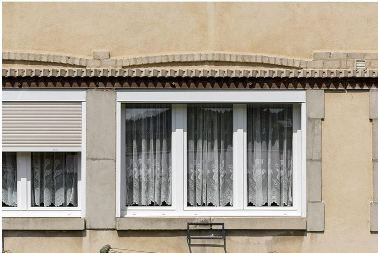
Baie d'atelier au rez-de-chaussée de la façade latérale droite.

25, Les Gras, 8 place de la Libération et du Souvenir français