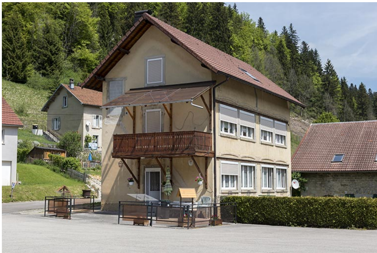
Un atelier d'allure moderne des années 1910 : la fabrique d'outillage et d'aiguilles médicales de Louis Laithier, 8 place de la Libération et du Souvenir français.

25, Les Gras, 8 place de la Libération et du Souvenir français