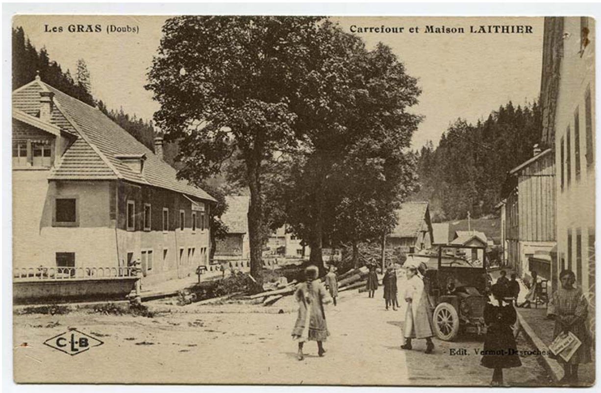
Les Gras (Doubs). Carrefour et maison Laithier, 1er quart 20e siècle [avant 1917]. La fabrique de Louis Laithier (qui sera détruite par un incendie en 1917) est visible à gauche.

25, Les Gras, 8 place de la Libération et du Souvenir français