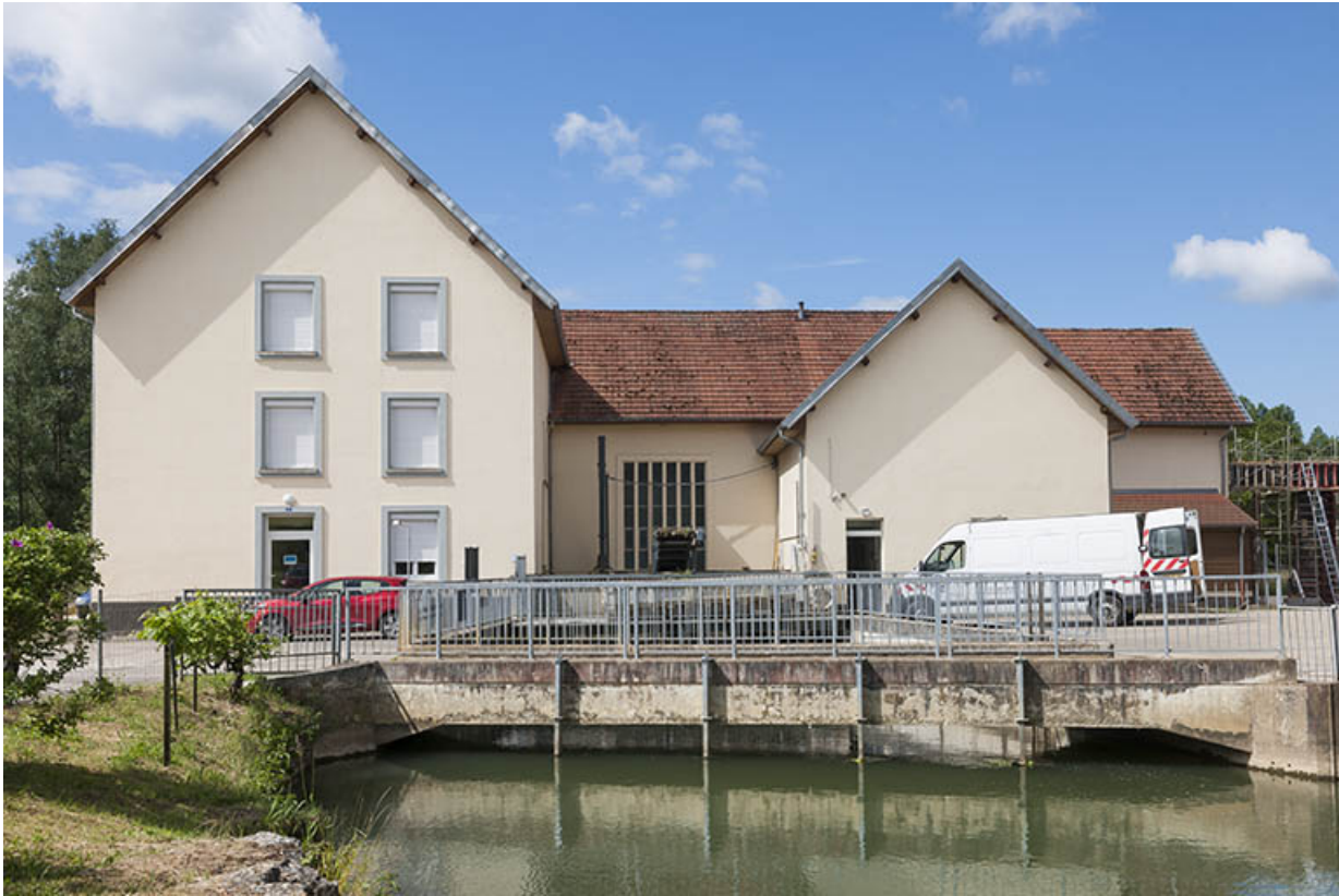
La centrale hydroélectrique depuis le canal d'amenée.