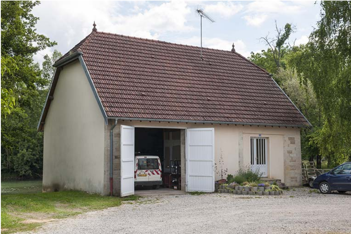
Garage et logement (ancien atelier de scierie).