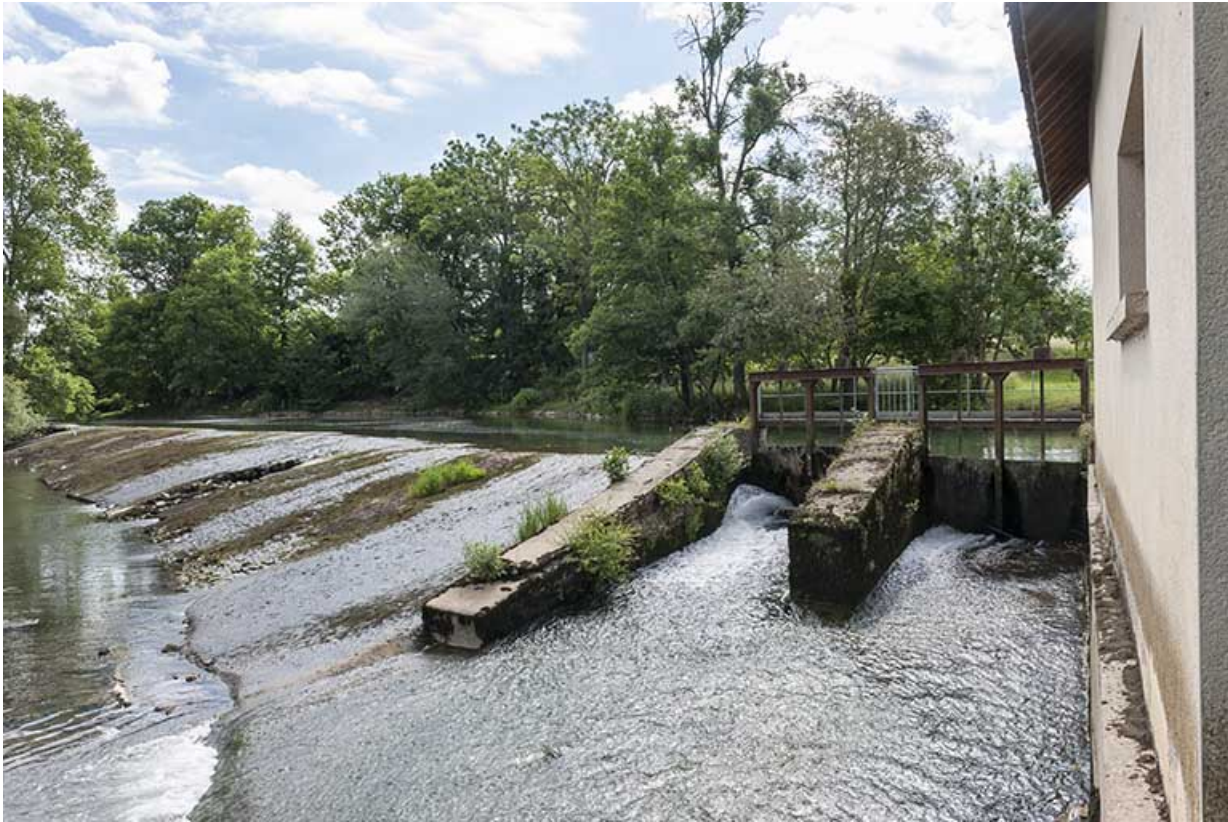
La barrage depuis l'aval et le vannage de décharge.