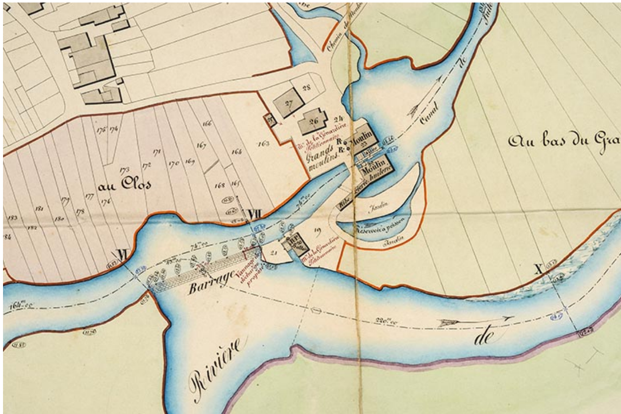
[Plan de situation], 1859.