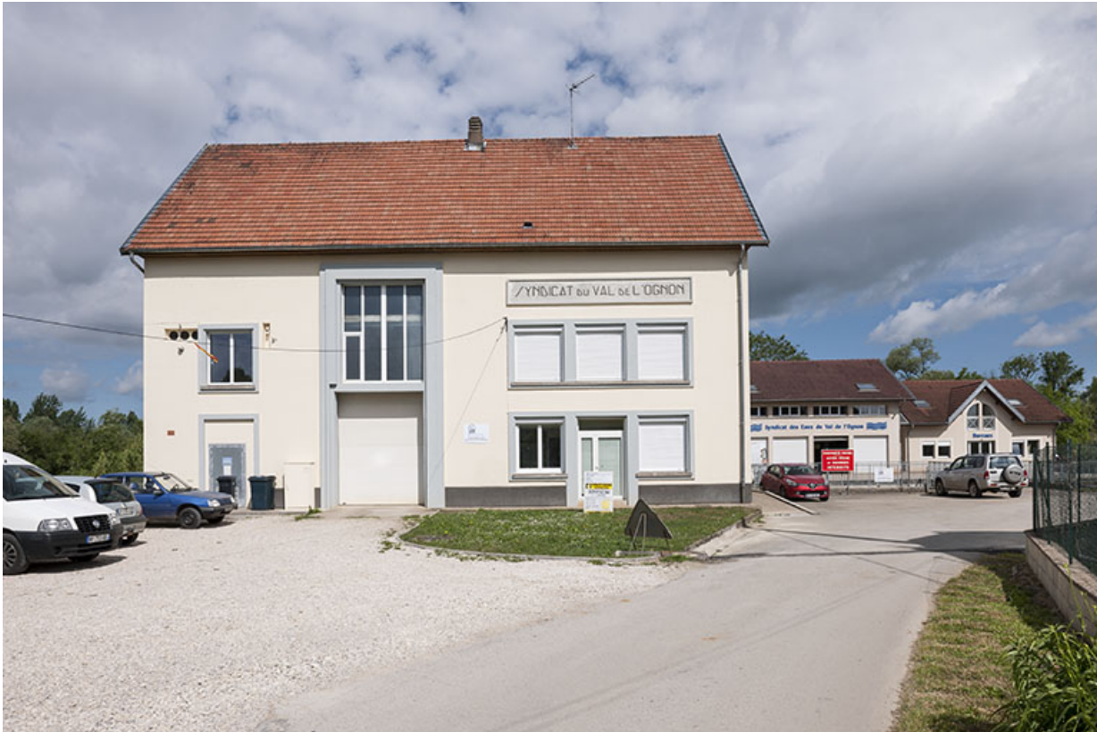
Vue d'ensemble depuis l'arrivée.