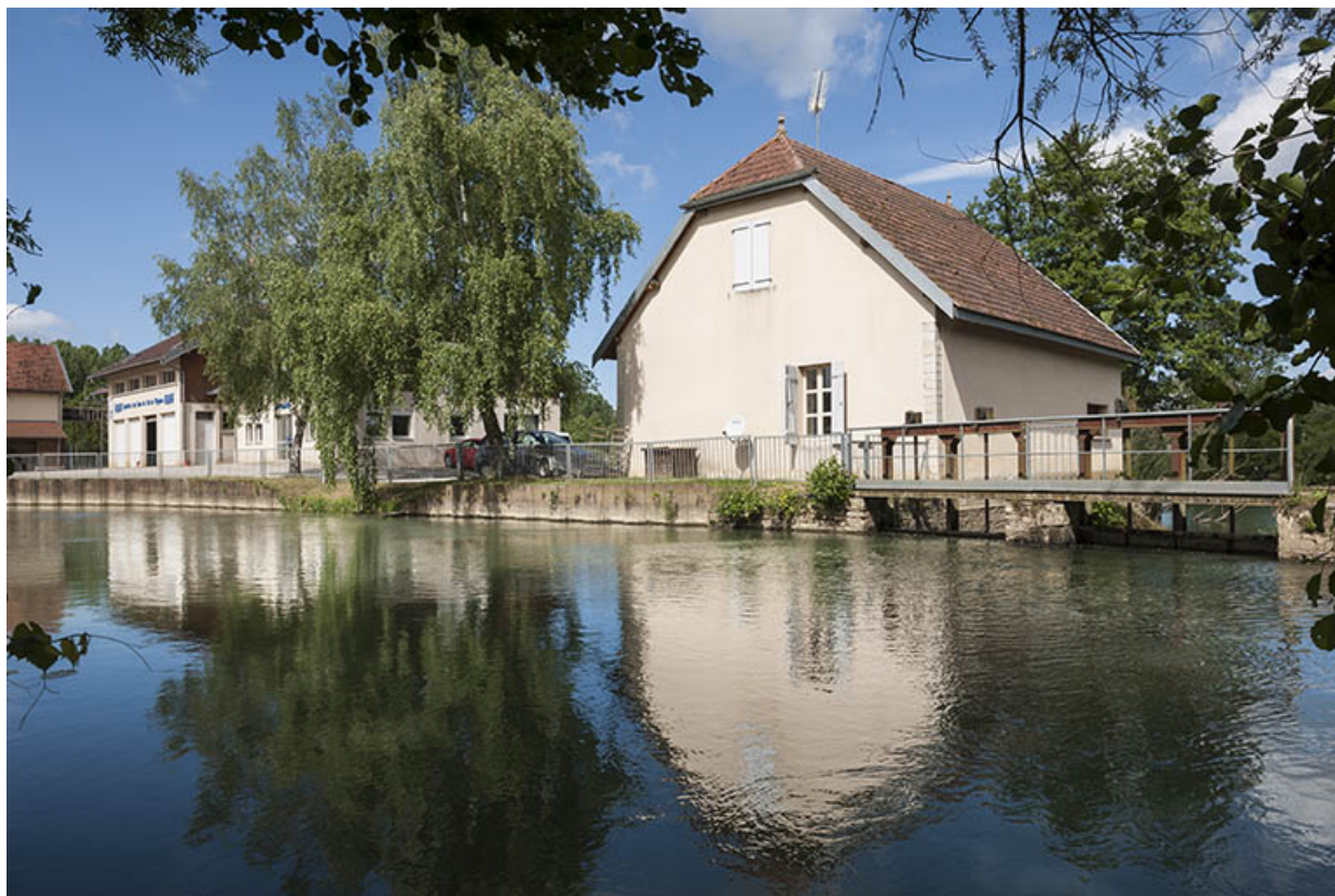
Vue depuis le début du canal d'aménée.