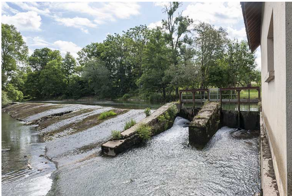
La barrage depuis l'aval et le vannage de décharge.