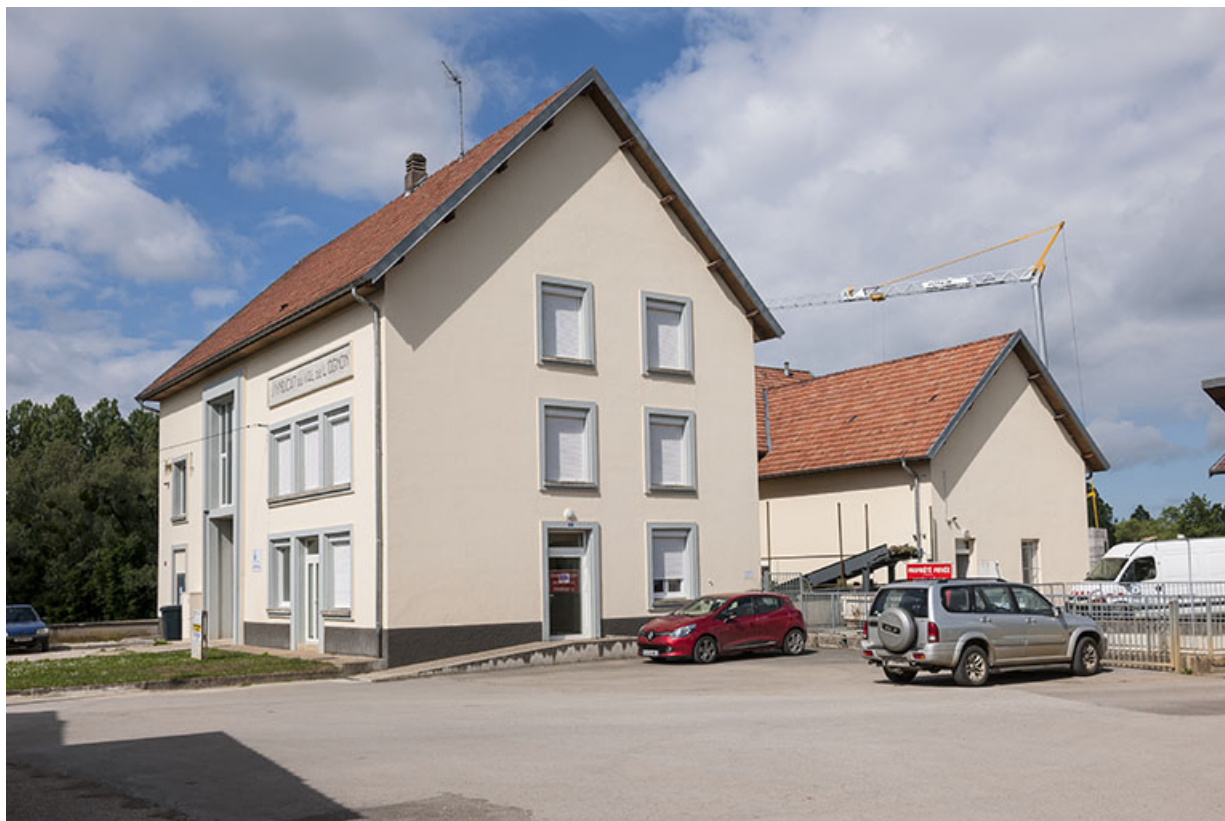
La centrale hydroélectrique vue de trois quarts gauche.