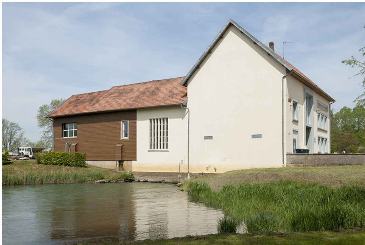
La centrale hydroélectrique vue depuis le sud.