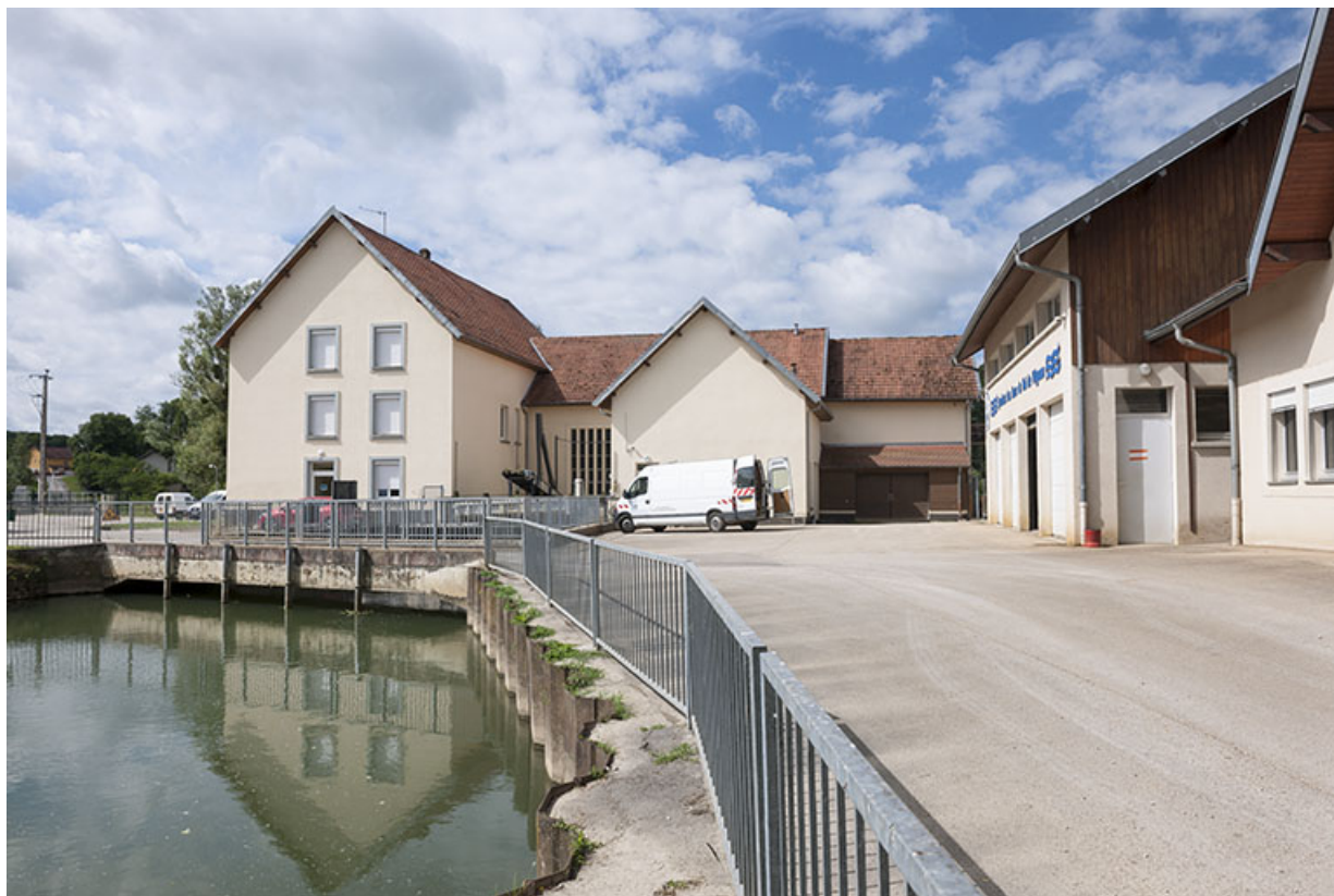
La centrale hydroélectrique vue depuis le nord.