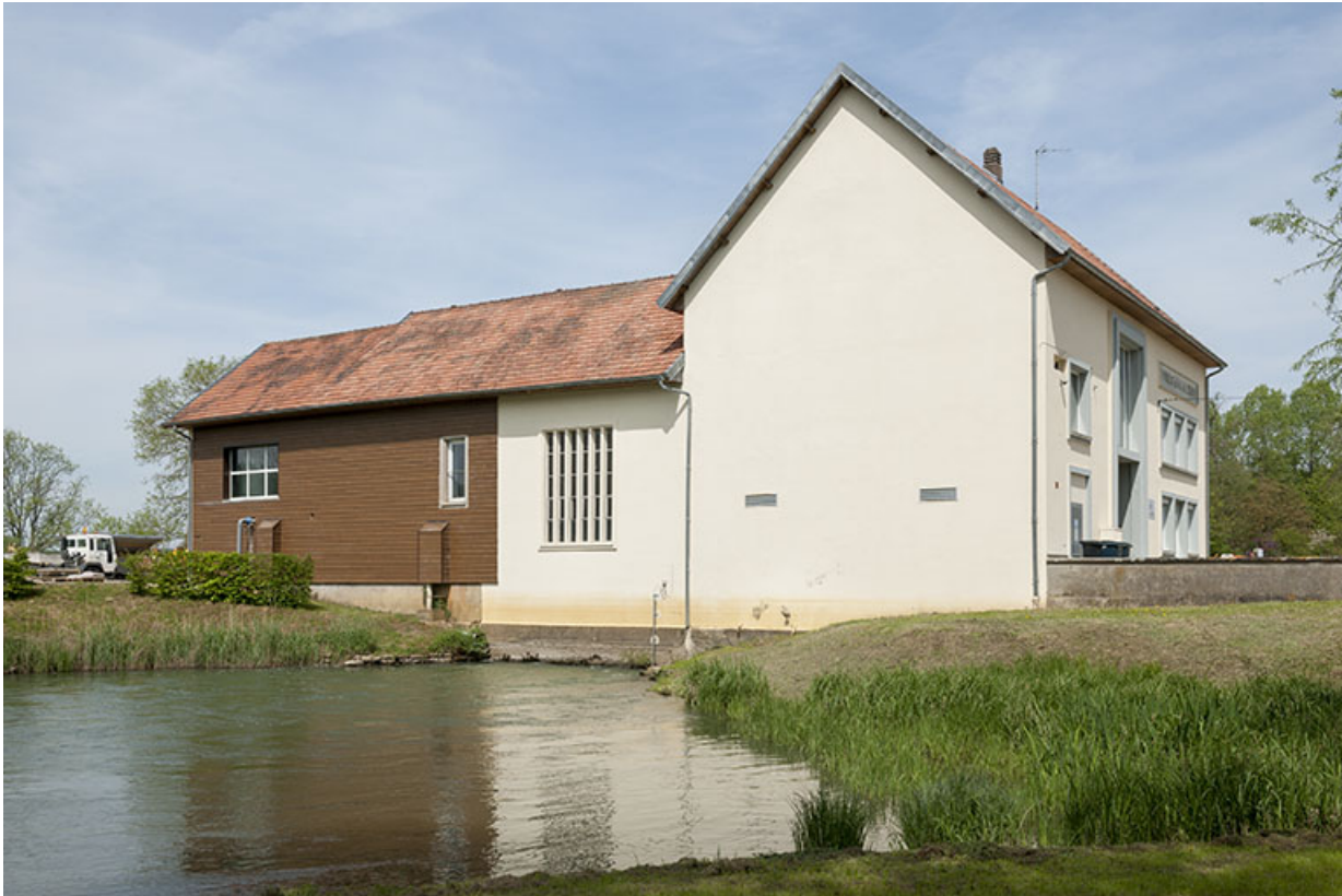
La centrale hydroélectrique vue depuis le sud.