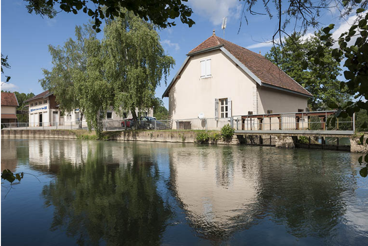
Vue depuis le début du canal d'amenée.