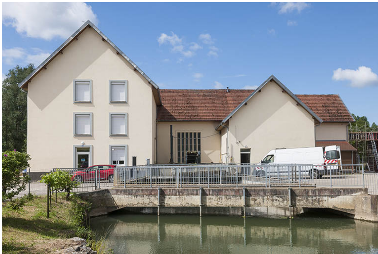
La centrale hydroélectrique depuis le canal d'amenée.