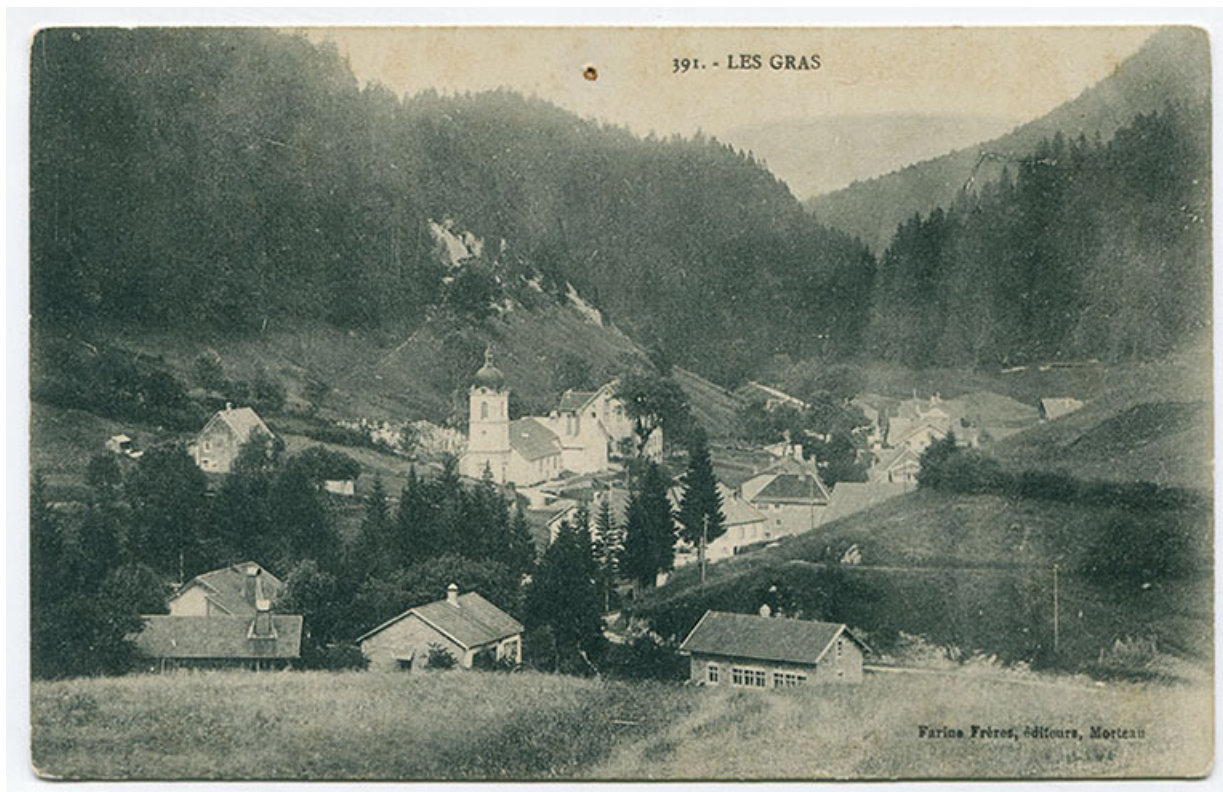
391. - Les Gras [les Epaisses et le quartier de l'église vus du sud], 1er quart 20e siècle [entre 1908 et 1916]. La maison est visible au centre, l'atelier à droite.