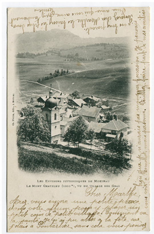
Les environs pittoresques de Morteau. Le Mont Châteleu (1303 m), vu du village des Gras, 4e quart 19e siècle. 25, Les Gras, 5 rue de Pontarlier