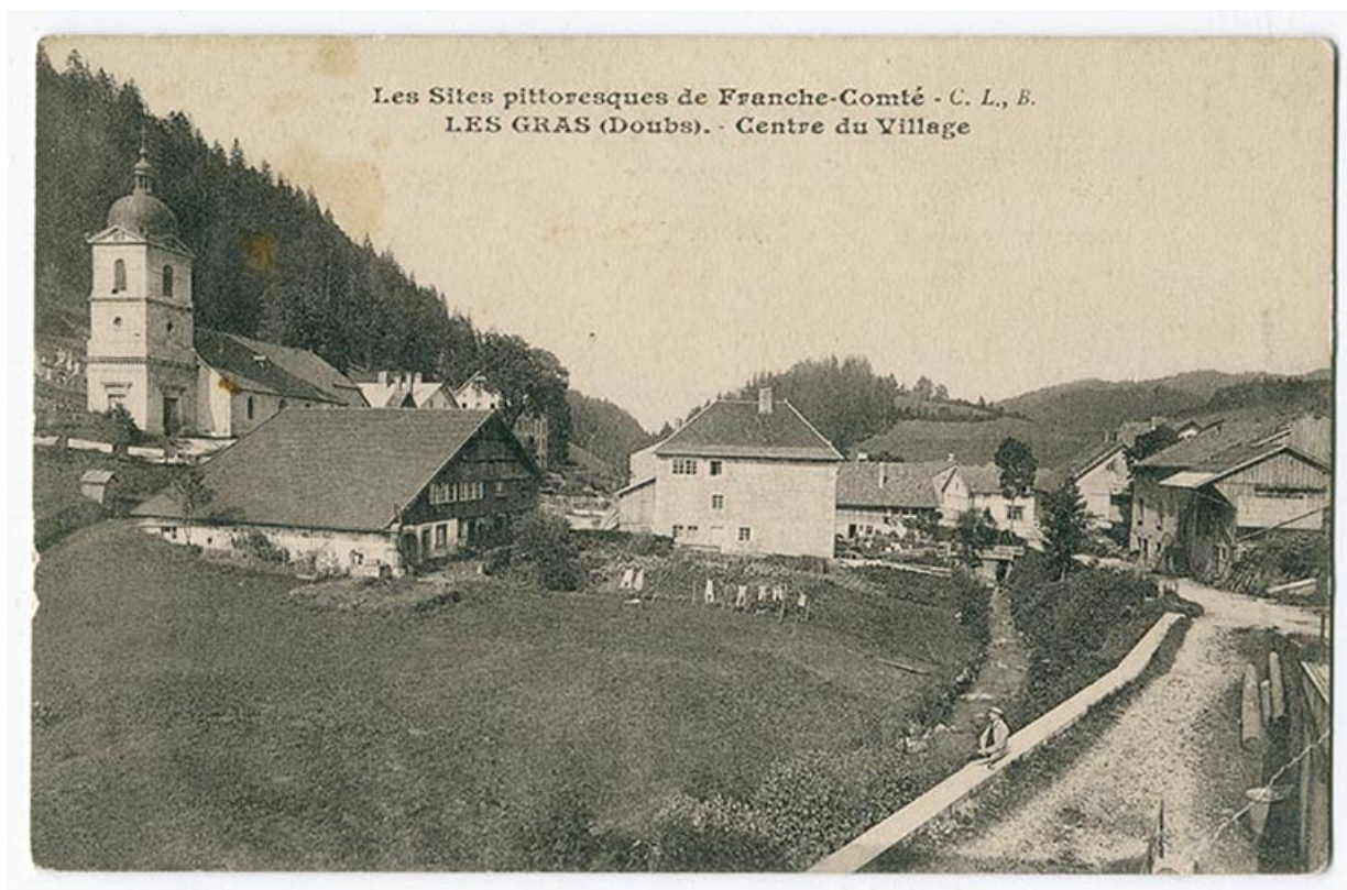
Les sites pittoresques de Franche-Comté. Les Gras (Doubs). - Centre du village, 1er quart 20e siècle. 25, Les Gras, 5 rue de Pontarlier