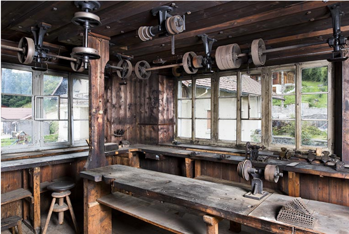
L'atelier, avec ses établis et ses transmissions.