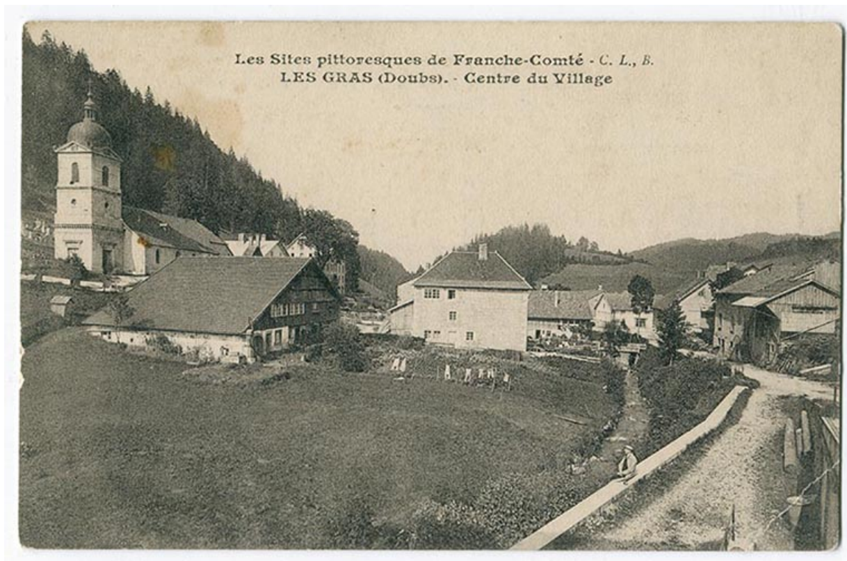
Les sites pittoresques de Franche-Comté. Les Gras (Doubs). - Centre du village, 1er quart 20e siècle. 25, Les Gras, 5 rue de Pontarlier