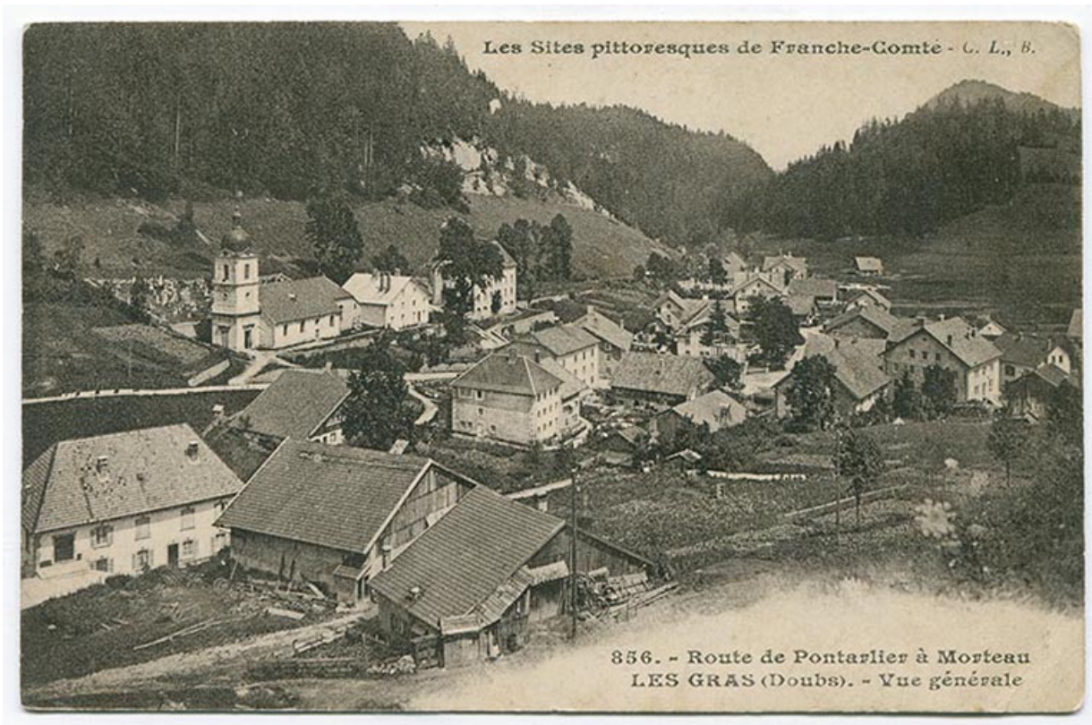
Les sites pittoresques de Franche-Comté. 856. Route de Pontarlier à Morteau. Les Gras (Doubs). - Vue générale, 1er quart 20e siècle [entre 1908 et 1917].