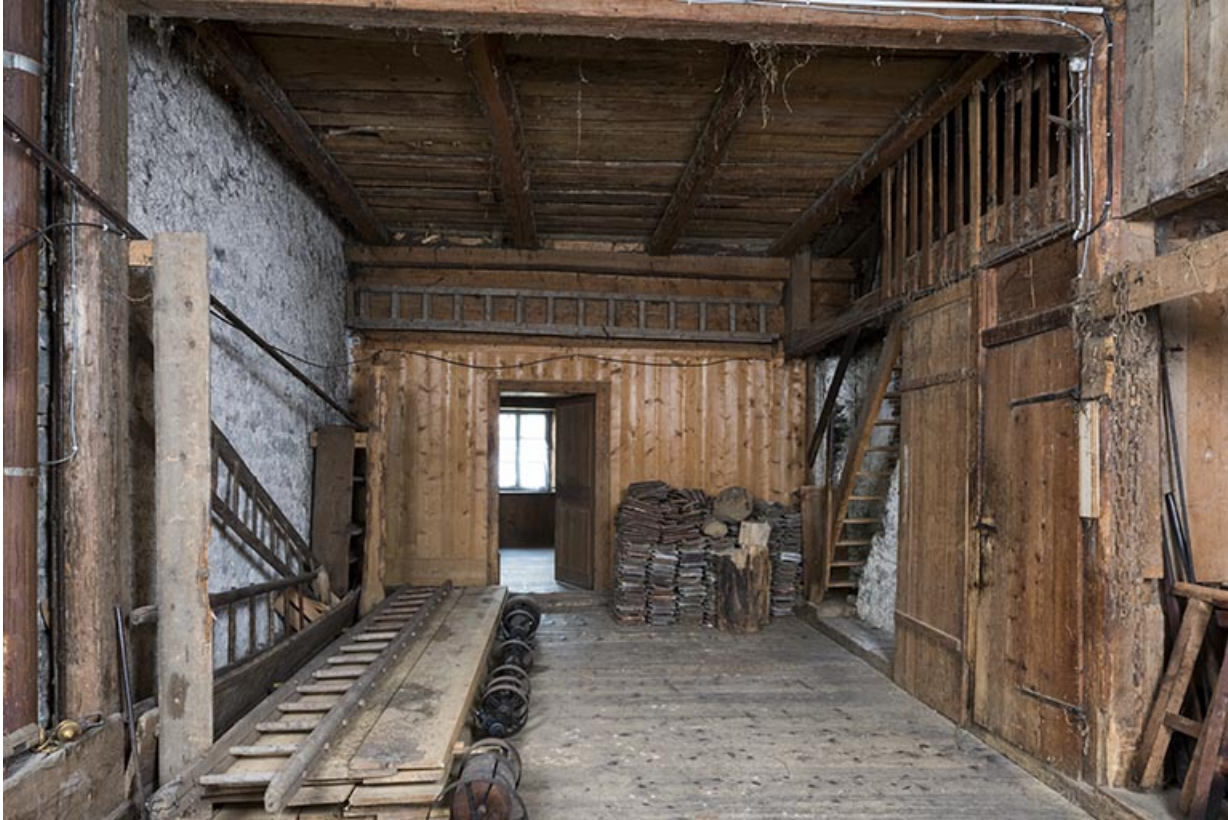
La grange, depuis l'entrée au nord. L'accès à l'atelier s'effectue par l'escalier en bois à droite. 25, Les Gras, 5 rue de Pontarlier