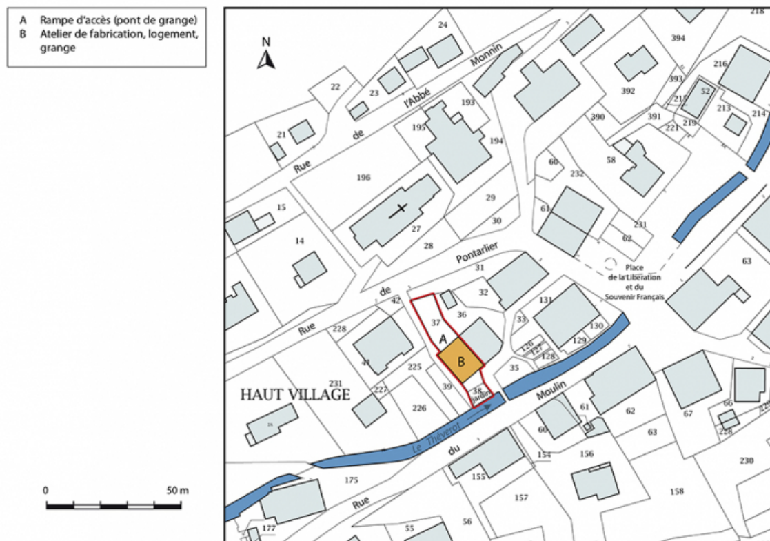
Plan-masse et de situation. Extrait du plan cadastral, 2017, section AB, 1/1 000.