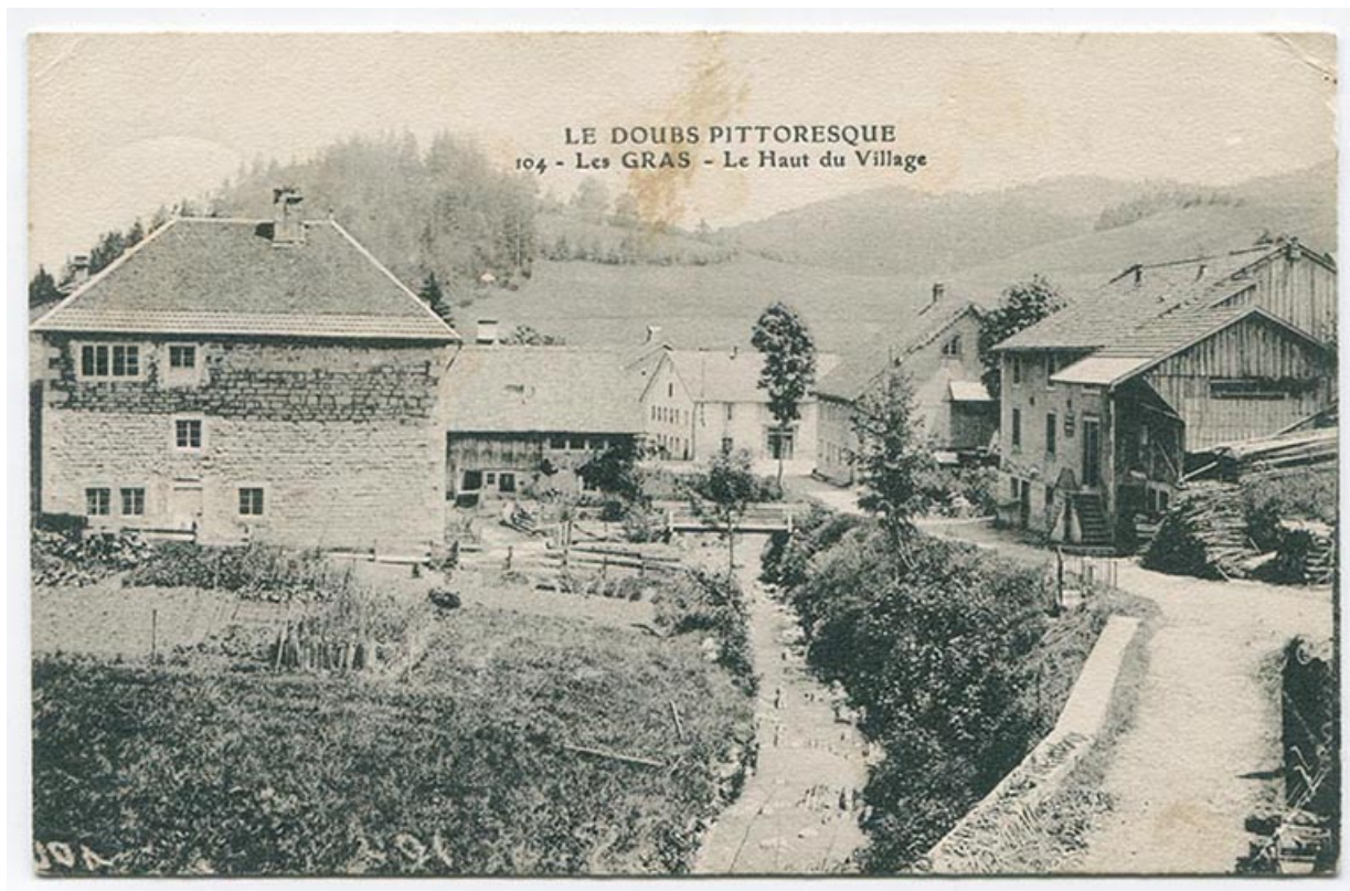
Le Doubs pittoresque. 104 - Les Gras - Le haut du village, 1er quart 20e siècle [avant 1914].