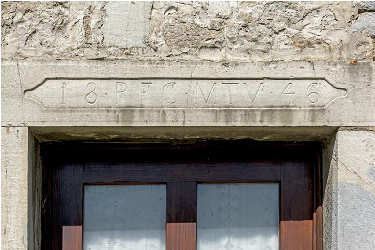
Façade occidentale : linteau daté 1846.