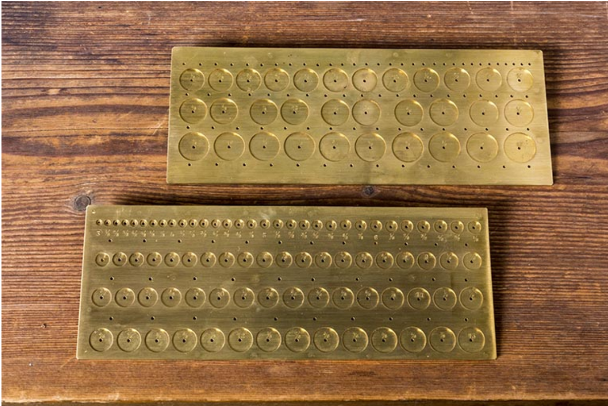
Calibres aux roues, en laiton.