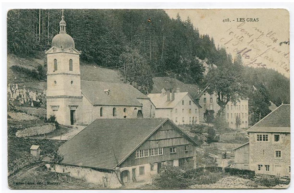
418. - Les Gras [le quartier de l'église vu du sud], 1er quart 20e siècle [avant 1916]. Le bâtiment est visible à droite (l'atelier se signale par la fenêtre horlogère au dernier niveau).