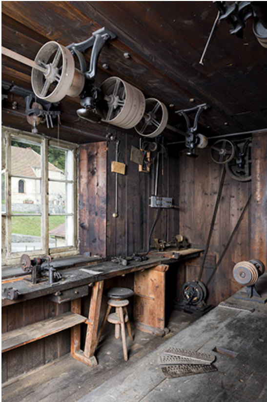
L'atelier, avec moteur électrique et transmissions.