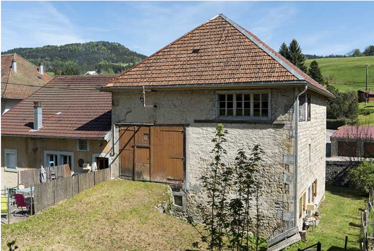
Façade nord : pont et portail de la grange, fenêtres de l'atelier sous le toit. 25, Les Gras, 5 rue de Pontarlier