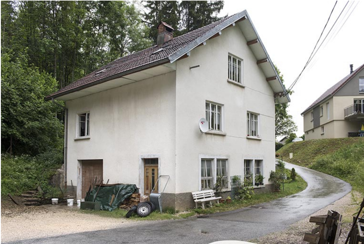
Façades sud est ouest.