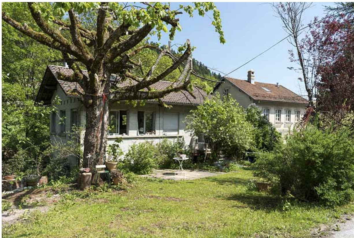
Atelier de 1978, depuis le sud.