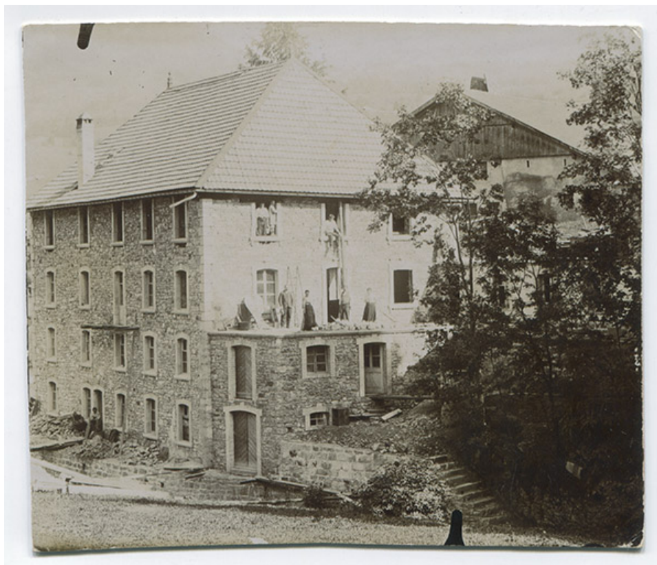
[La fonderie de cuivre Mesnier, en cours de reconstruction : façades postérieure et latérale gauche de l'immeuble], [1906 ou 1907]. 25, Les Gras, 4-6 rue du Moulin