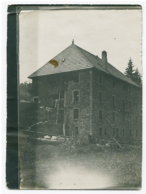
[La fonderie de cuivre Mesnier, en cours de reconstruction : façades postérieure et latérale droite de l'immeuble], [1906 ou 1907]. 25, Les Gras, 4-6 rue du Moulin