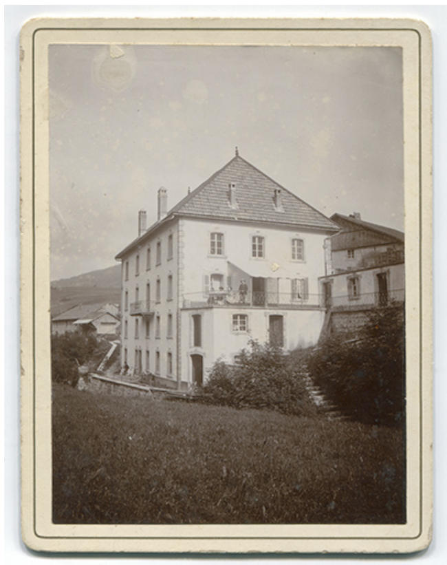
[Façades postérieure et latérale gauche de l'immeuble], 1er quart 20e siècle [après 1908]. 25, Les Gras, 4-6 rue du Moulin