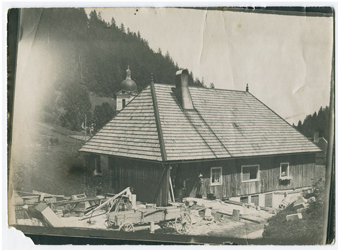
[La fonderie de cuivre Mesnier, en cours de reconstruction : façades antérieure et latérale gauche de l'immeuble], [1906 ou 1907]. 25, Les Gras, 4-6 rue du Moulin