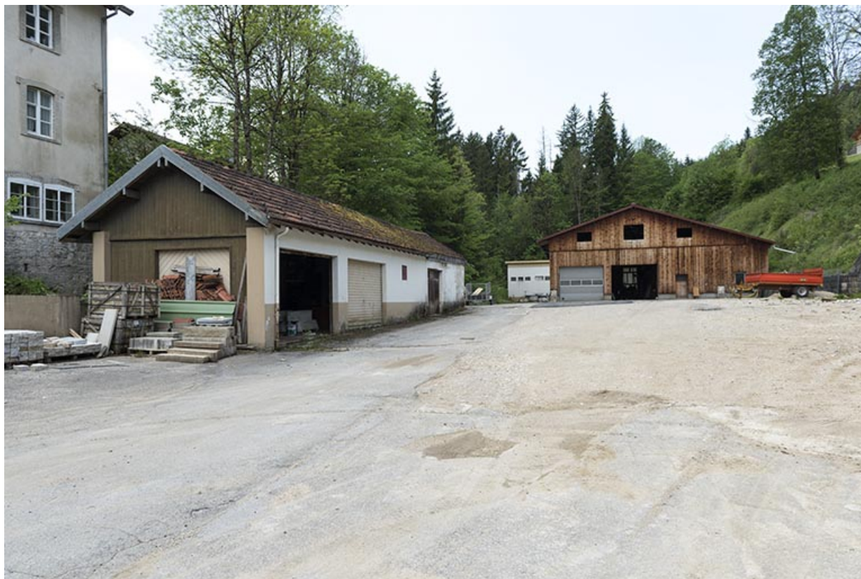
Usine : garage et vestige de l'atelier de fabrication.