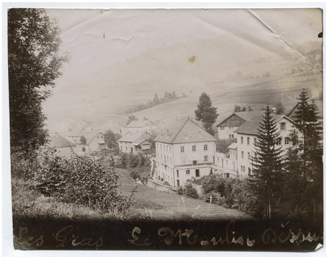
Les Gras. Le Moulin Dessus [vue d'ensemble des deux bâtiments, depuis l'ouest], 1er quart 20e siècle [après 1908]. 25, Les Gras, 4-6 rue du Moulin