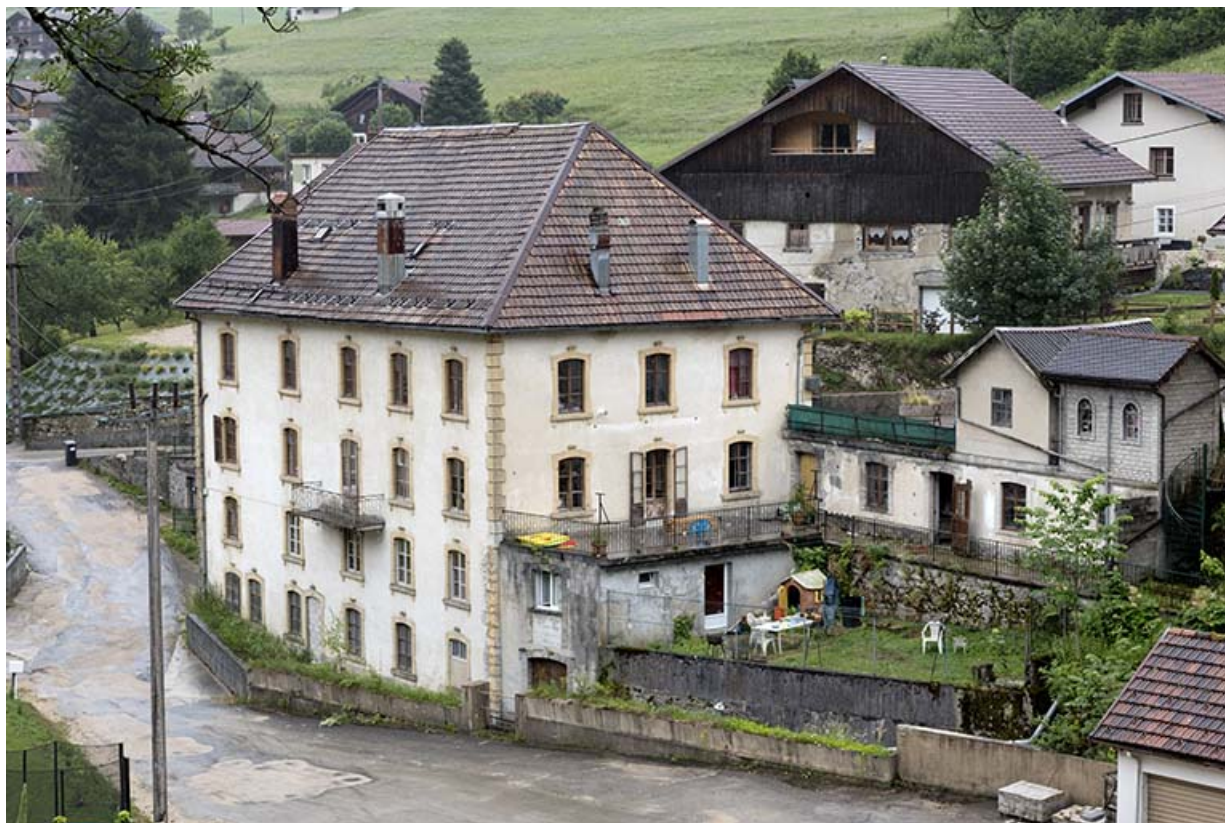
Immeuble et dépendance, depuis le nord-ouest.