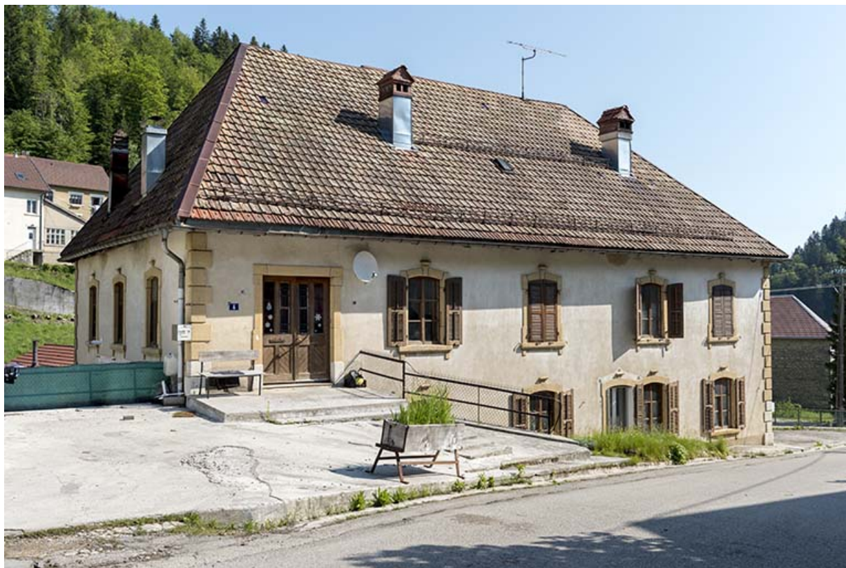
Immeuble, depuis le sud.