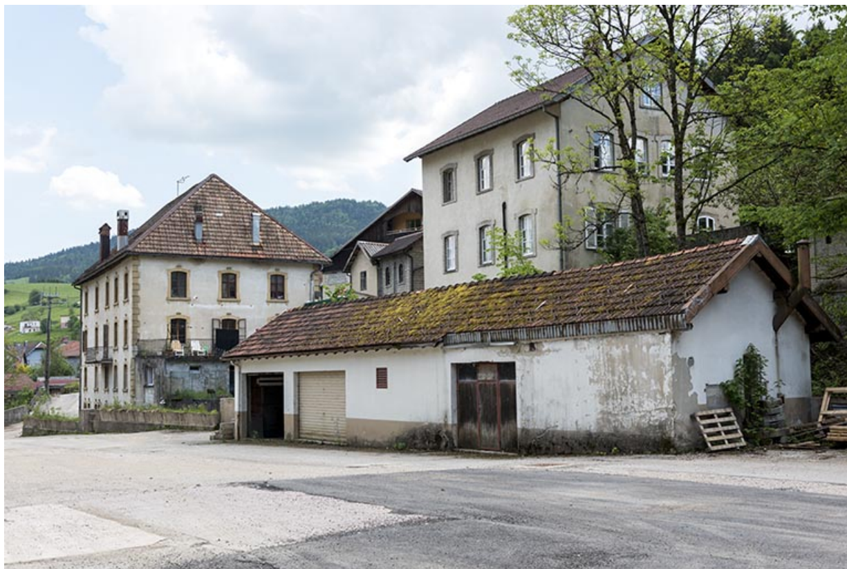
Usine : garage, avec l'immeuble et la maison en arrière-plan.