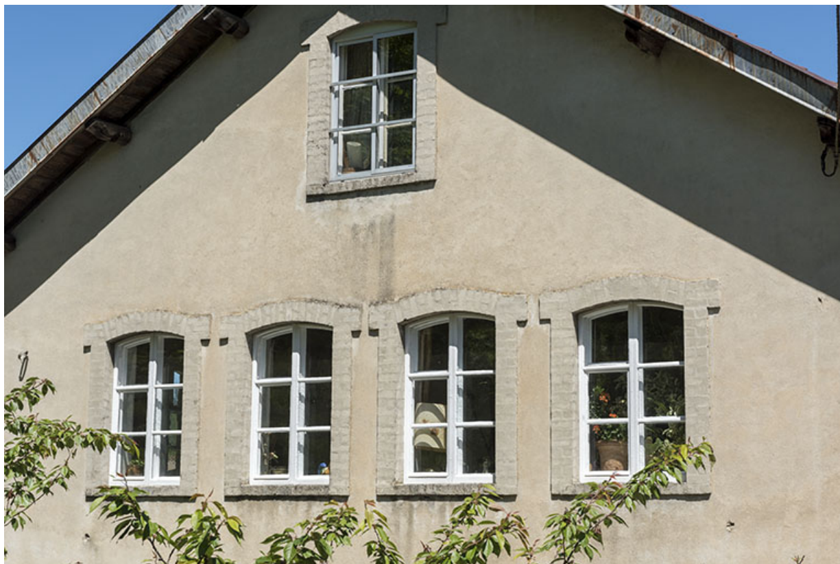
Maison : baies de l'atelier sur la façade ouest.