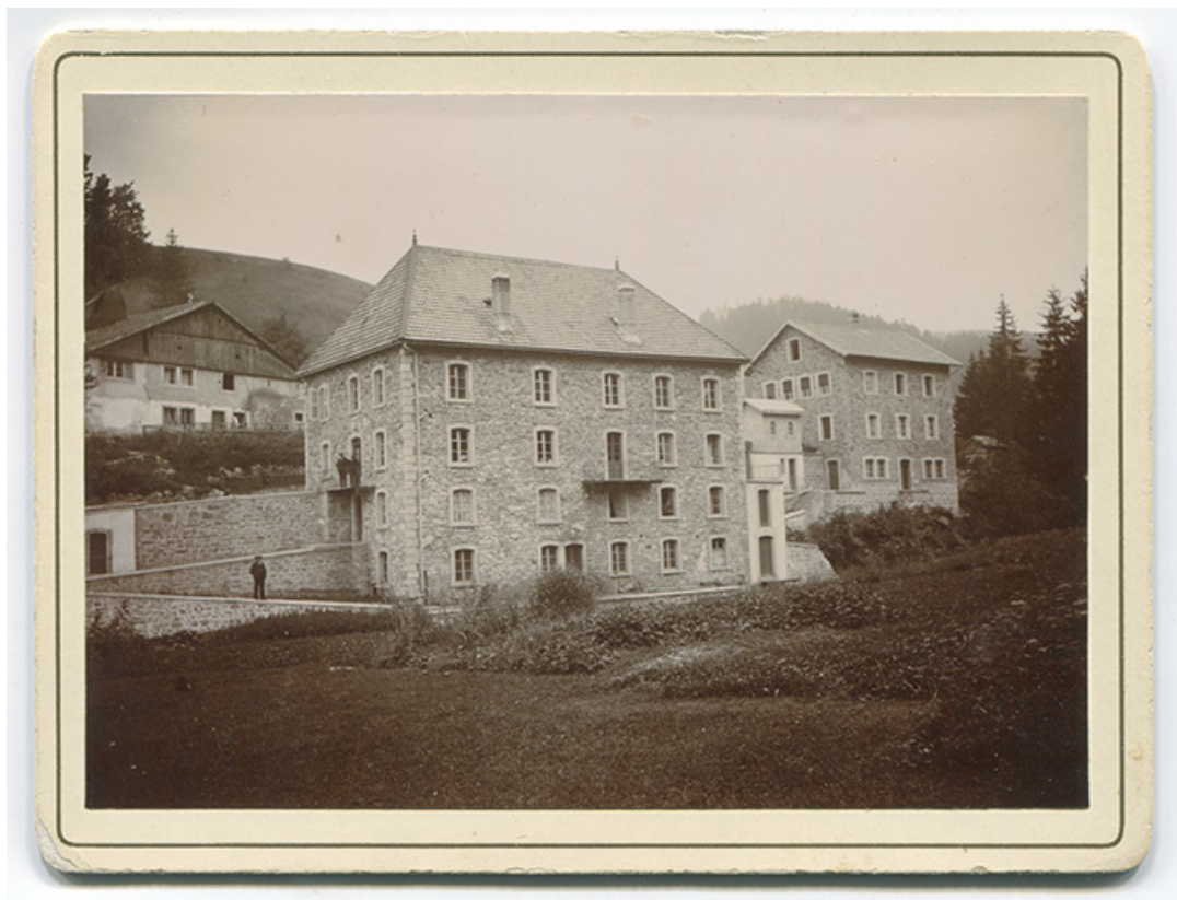
[Vue d'ensemble des deux bâtiments (non crépis), depuis le nord], 1er quart 20e siècle [après 1908]. 25, Les Gras, 4-6 rue du Moulin