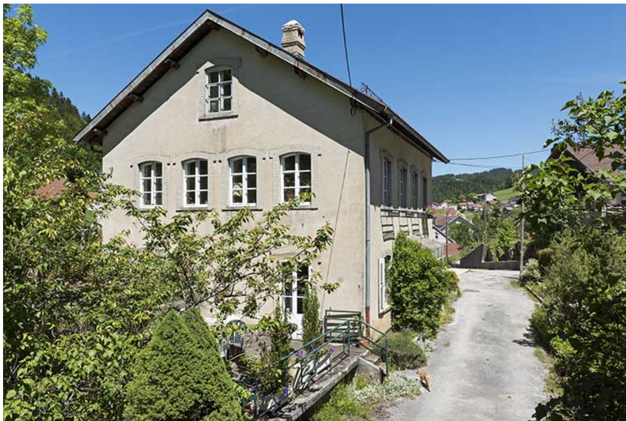
Maison : façade ouest.