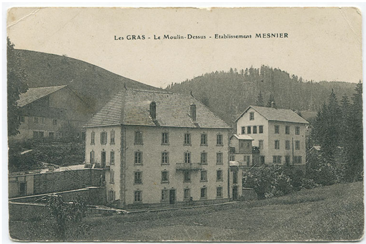
Les Gras - Le Moulin-Dessus - Etablissement Mesnier [vue d'ensemble, depuis le nord], 1er quart 20e siècle [entre 1908 et 1912]. 25, Les Gras, 4-6 rue du Moulin