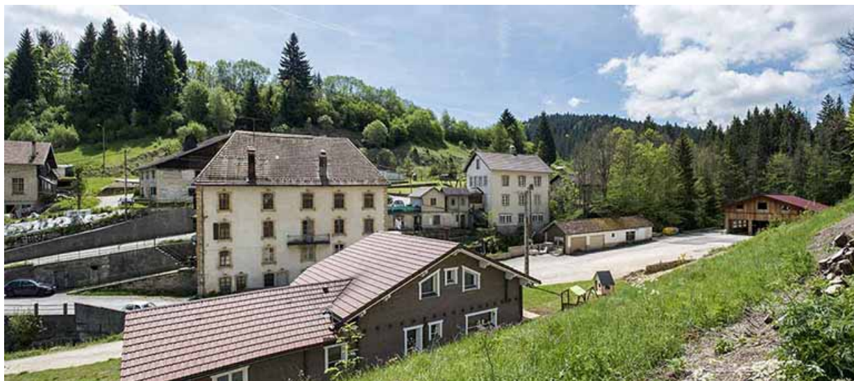
Un site de fonderie et fabrique d'outillage : l'affaire Mesnier (1873 et 1907-1908) puis Dornier et Les Fils de Virgile Amyot, 4-6 rue du Moulin. L'usine LFA se trouvait au premier plan à droite.