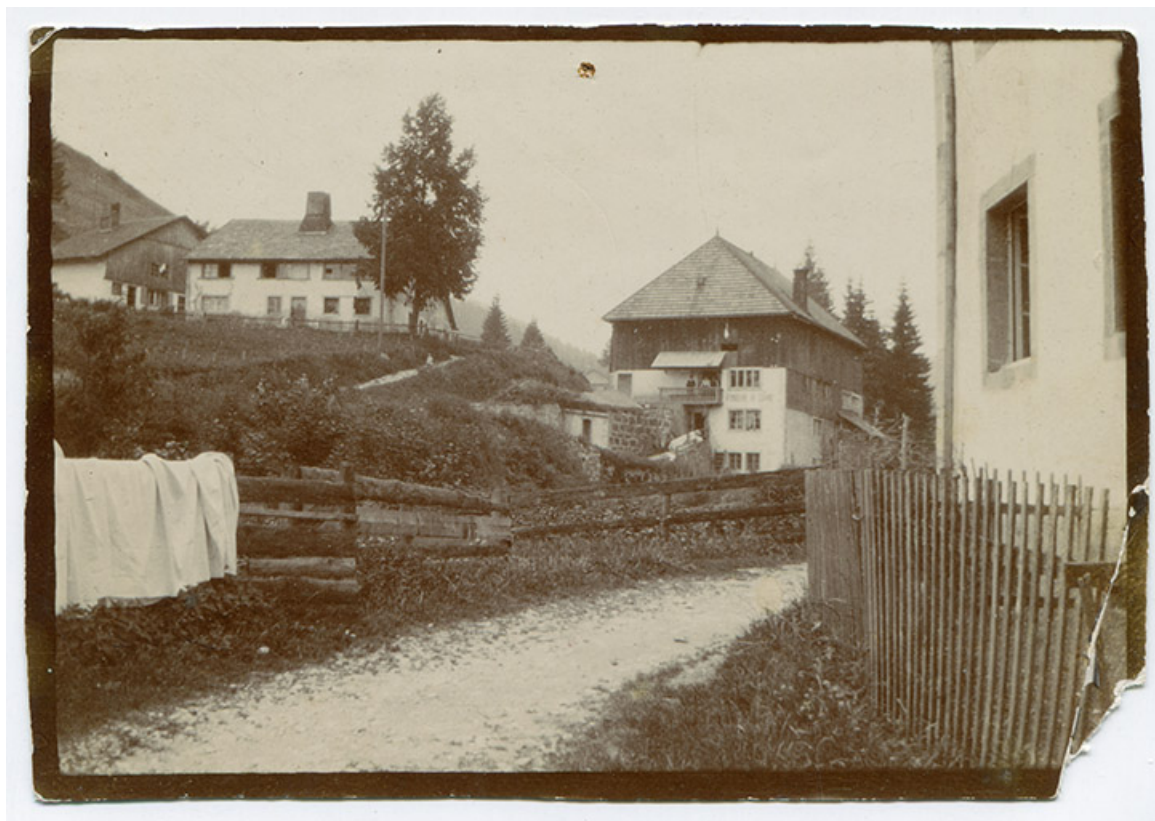
[Vue d'ensemble de la fonderie de cuivre Mesnier, avant sa reconstruction : façades postérieure et latérale droite], juillet 1905. 25, Les Gras, 4-6 rue du Moulin