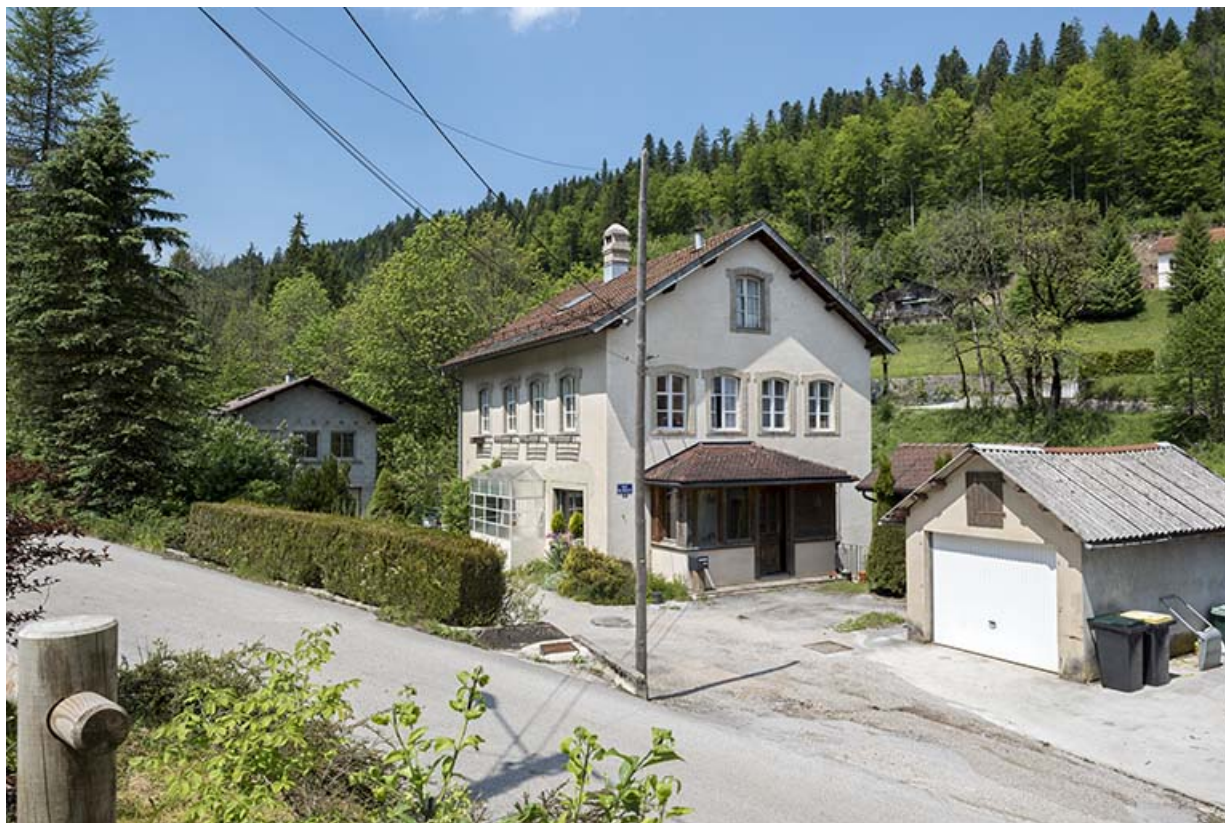
Maison et atelier de 1978, depuis l'est.