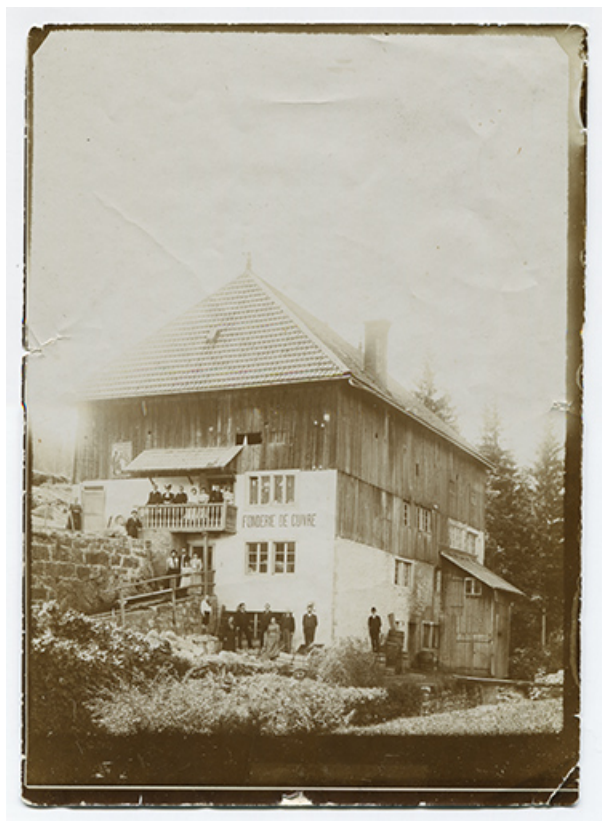
[La fonderie de cuivre Mesnier, avant sa reconstruction : façades postérieure et latérale droite], 4e quart 19e siècle ou 1er quart 20e siècle [avant 1907]