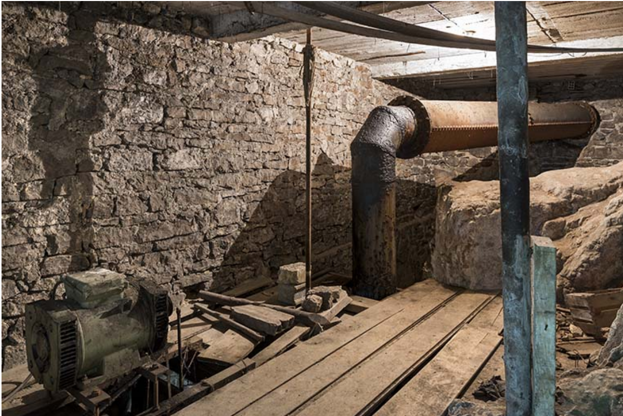
Usine : conduit d'amenée d'eau de la turbine, au 1er étage de soubassement. 25, Les Gras, 11-15 Grande Rue