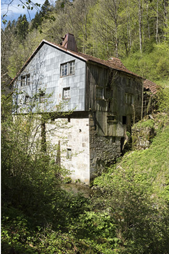
Ancien moulin : façades postérieure et latérale droite. 25, Les Gras, 11-15 Grande Rue