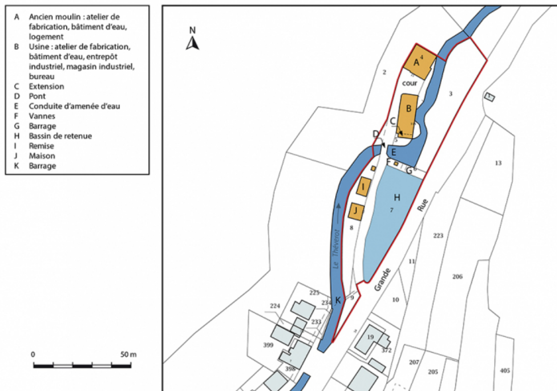
Plan-masse et de situation. Extrait du plan cadastral, 2017, section AC, 1/1 000.