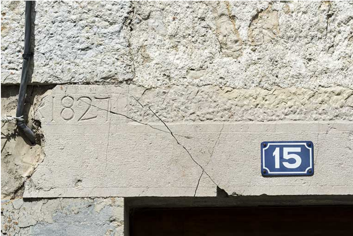
Ancien moulin : date sur la façade antérieure.