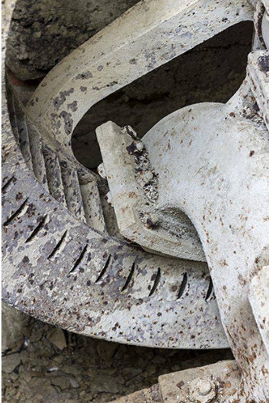
Usine : arrivée d'eau sur les aubes de la turbine.