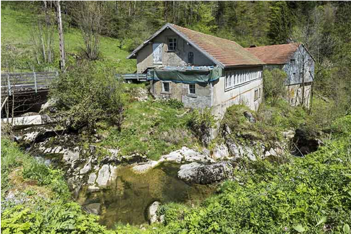
Usine et ancien moulin, depuis le sud.