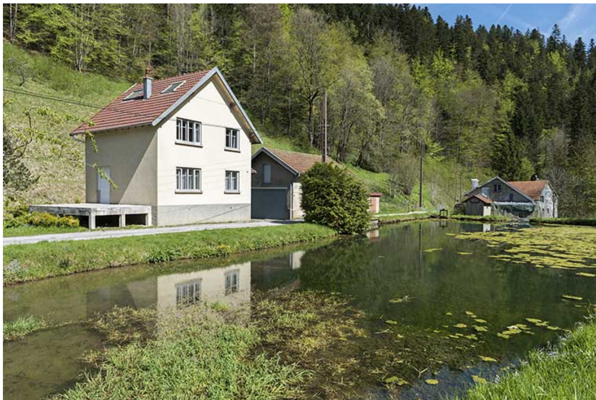
Vue d'ensemble, depuis le sud. Maison, remise et bassin de retenue au premier plan, usine à l'arrière-plan.