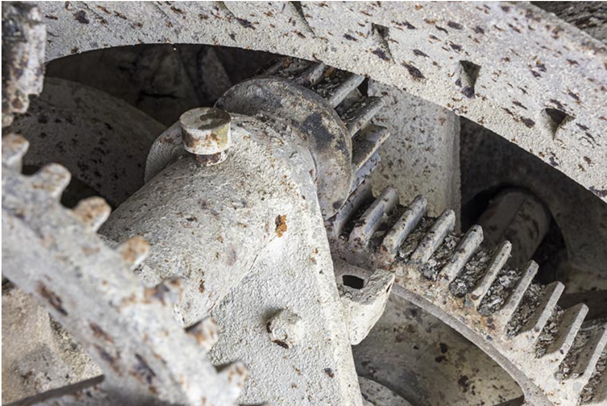
Usine : pignon entraînant le secteur commandant l'admission d'eau dans la turbine. 25, Les Gras, 11-15 Grande Rue