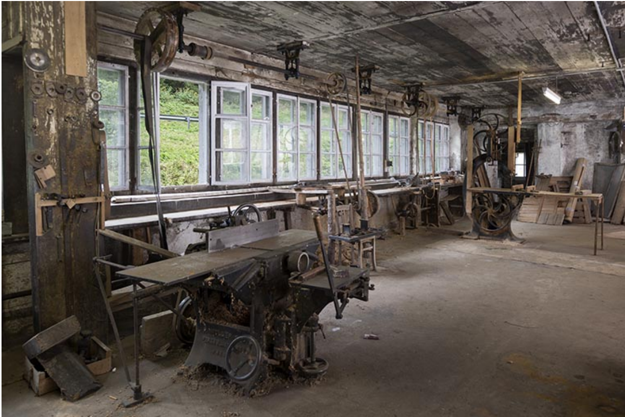
Usine : fenêtres de l'atelier de menuiserie, à l'est. 25, Les Gras, 11-15 Grande Rue