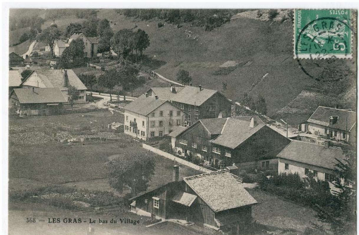
368 - Les Gras - Le bas du village, 1er quart 20e siècle [avant 1909]. La fonderie est visible au centre, avec l'immeuble à l'arrière-plan.