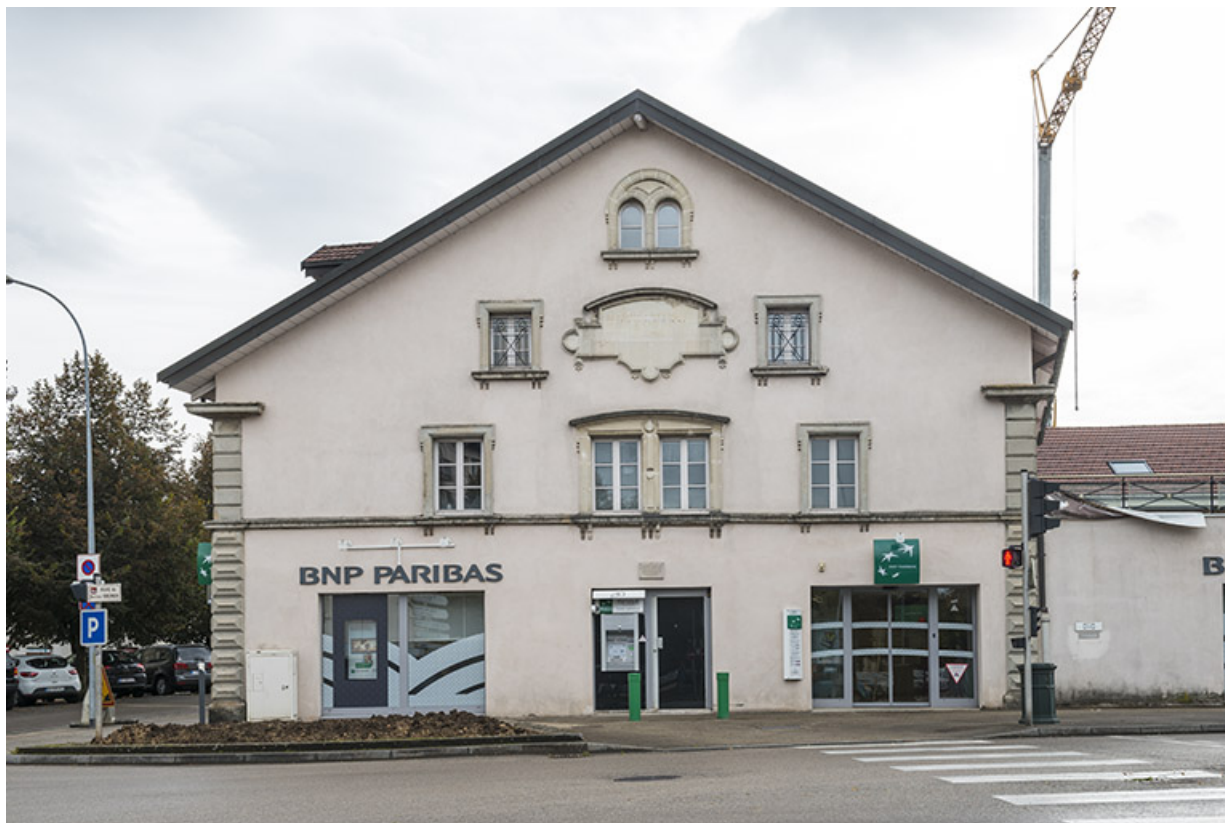
Pignon ouest de la maison Vichet (nord). 25, Pontarlier, 5-9 rue du docteur Grenier