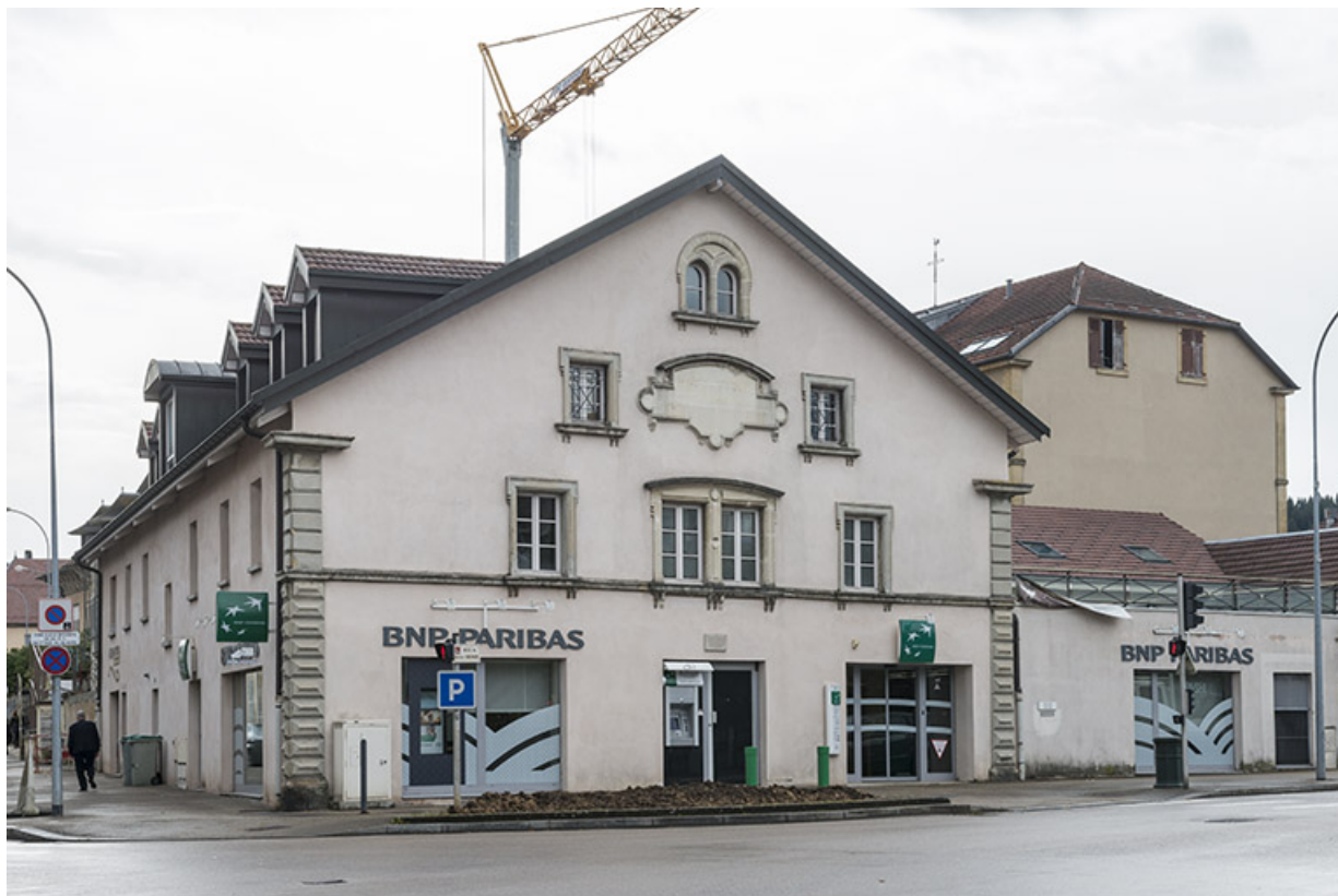
Bâtiment à l'angle des rues du docteur Grenier et Marpaud.

25, Pontarlier, 5-9 rue du docteur Grenier