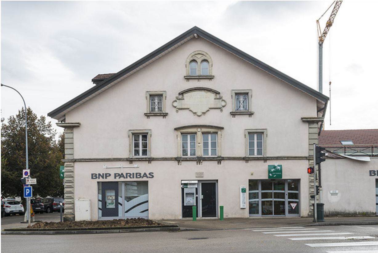
Pignon ouest de la maison Vichet (nord).

25, Pontarlier, 5-9 rue du docteur Grenier