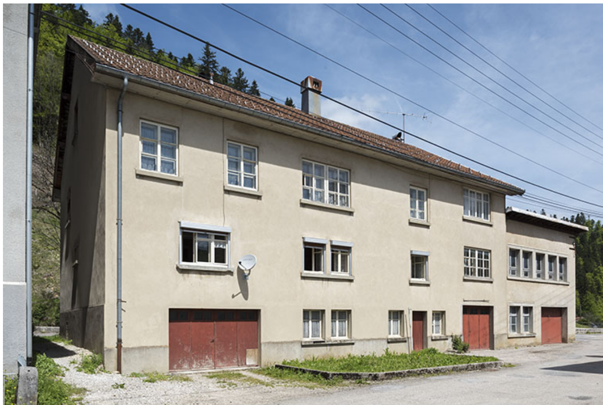
Immeuble et atelier : façade latérale gauche, de trois quarts gauche. 25, Les Gras, 20-22 Grande Rue