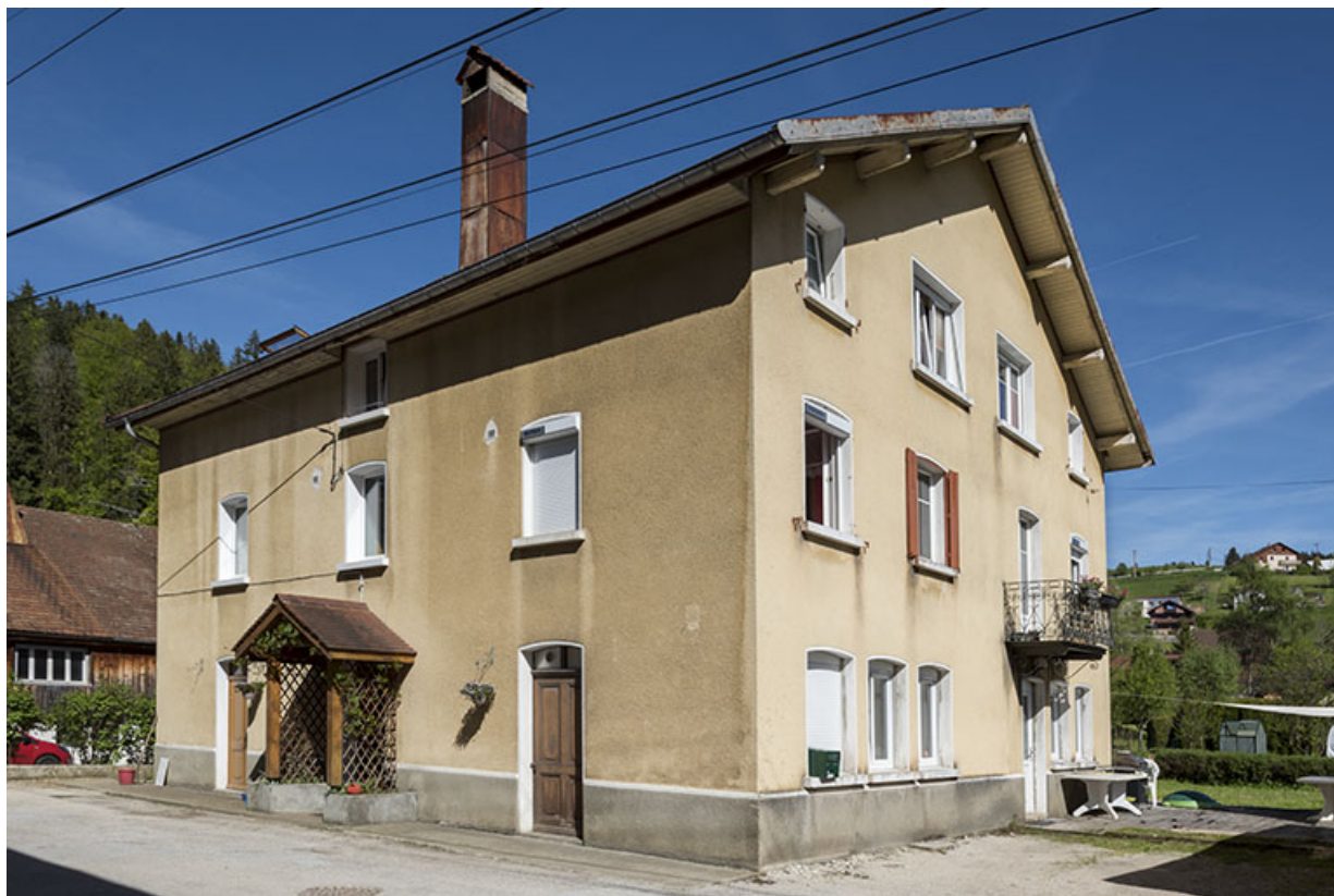
Fonderie : façades antérieure et latérale droite.