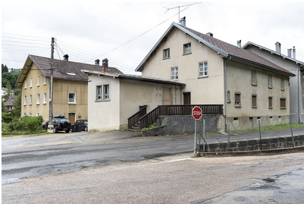
Vue d'ensemble, depuis le nord : fonderie à l'arrière-plan, immeuble et atelier au premier plan. 25, Les Gras, 20-22 Grande Rue