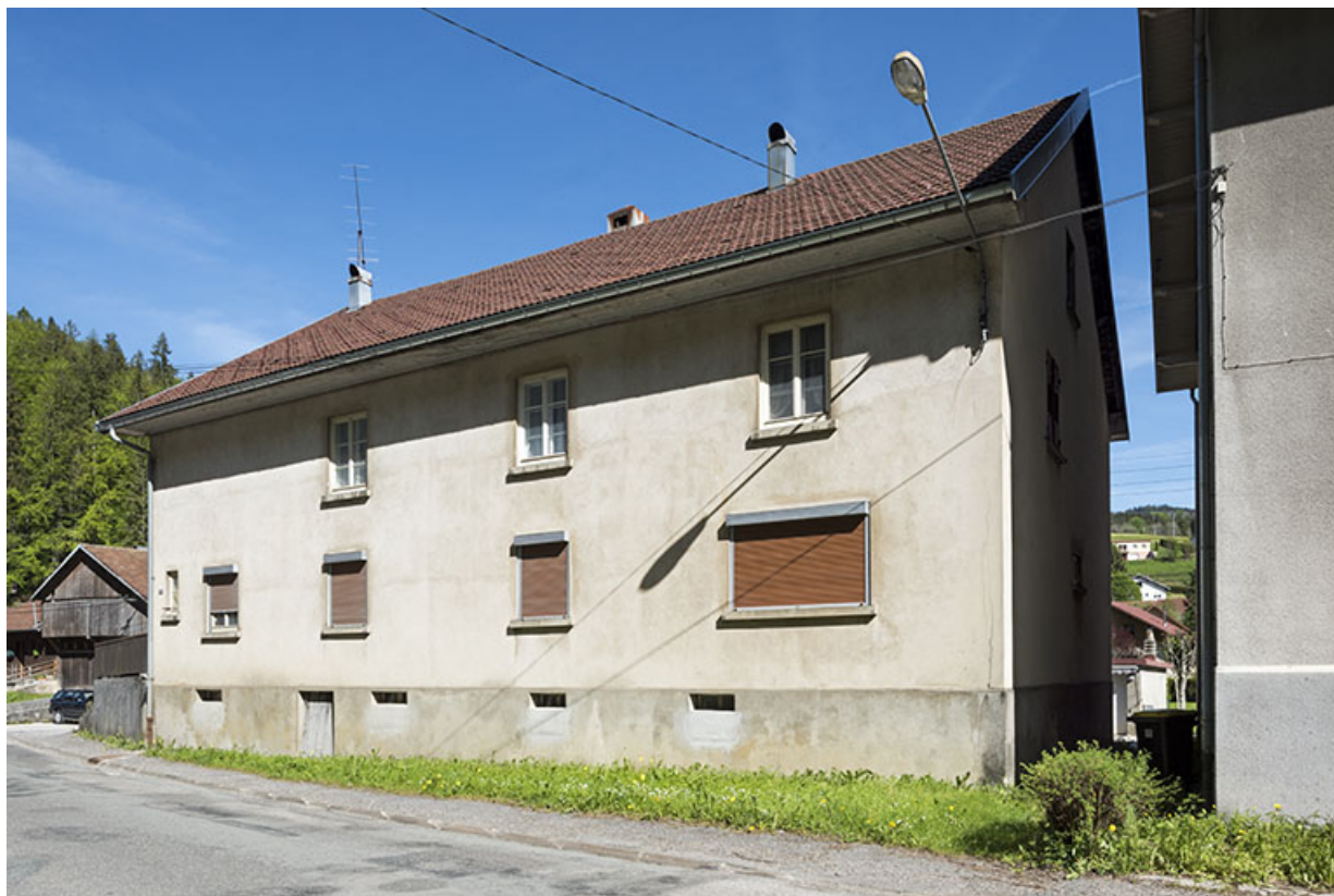
Immeuble : façade latérale droite, de trois quarts droite.