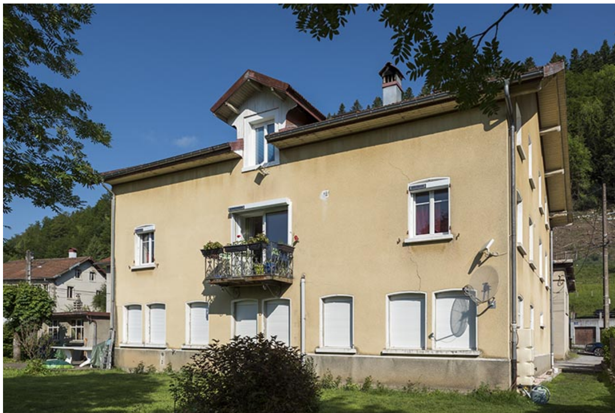
Fonderie : façade postérieure, de trois quarts droite.