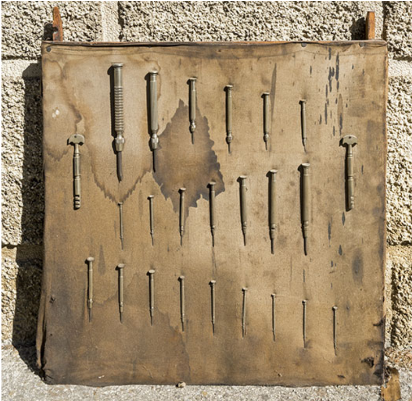
Présentoir de tournevis pour horlogers et coupe-verres.