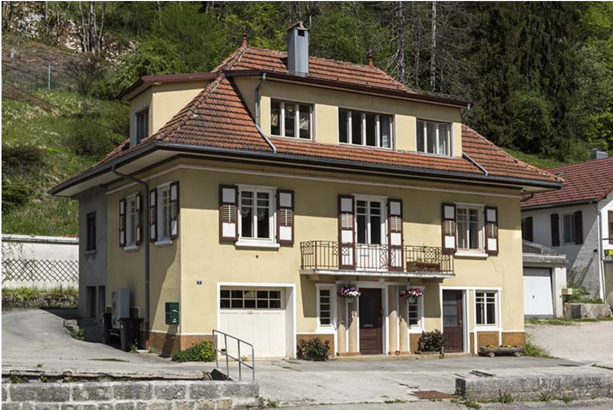
Maison, de trois quarts gauche.