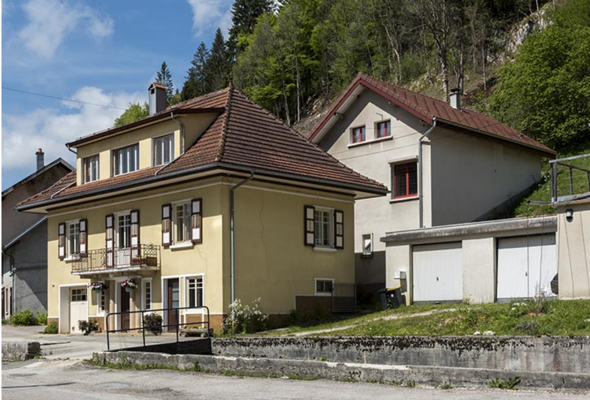
Vue d'ensemble, depuis le nord-est.