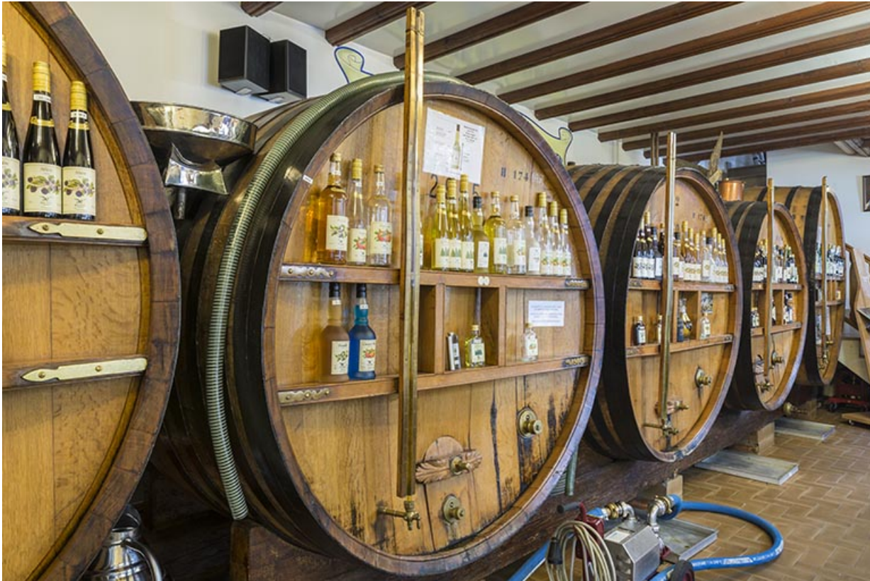
Alignement des foudres (contenance moyenne unitaire de 3000 litres).