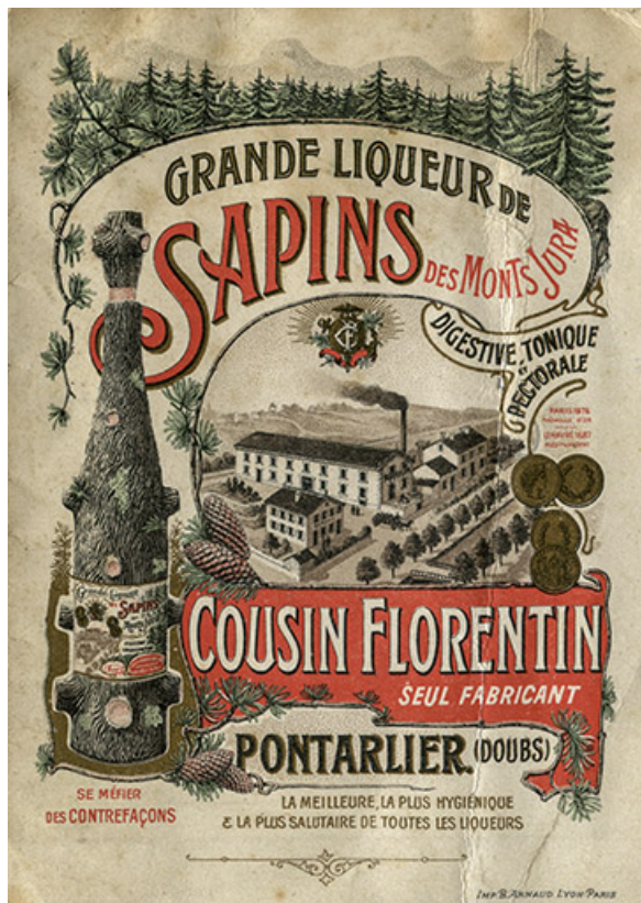
Lettre-carte publicitaire, s.d. [fin 19e début 20e siècle]. 25, Pontarlier, 49 rue des Lavaux