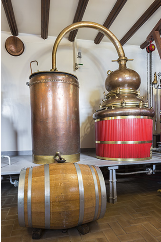
Alambic de 390 litres : cucurbite et chapiteau (à droite), col de cygne, réfrigérant (à gauche) et tonneau de réception du distillat. 25, Pontarlier, 49 rue des Lavaux