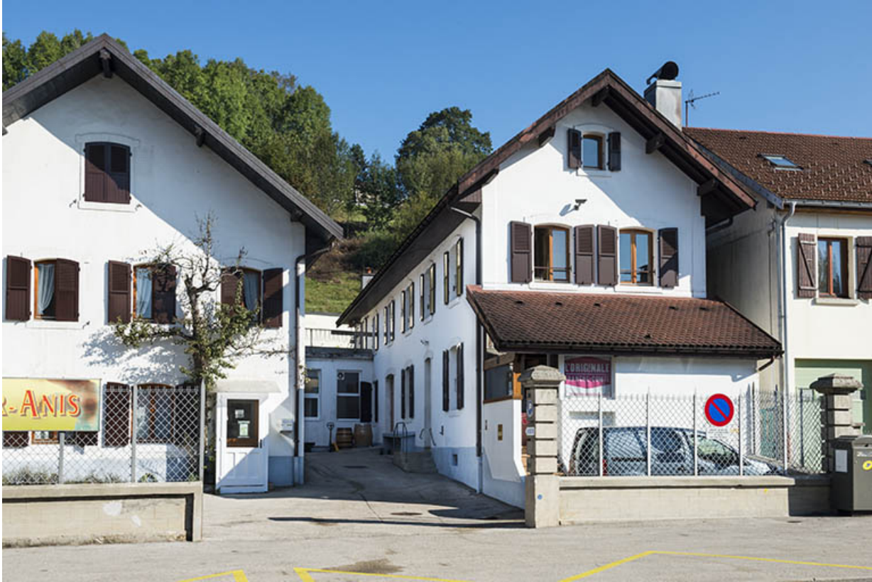
Le bâtiment des bureaux et l'atelier de distillation.