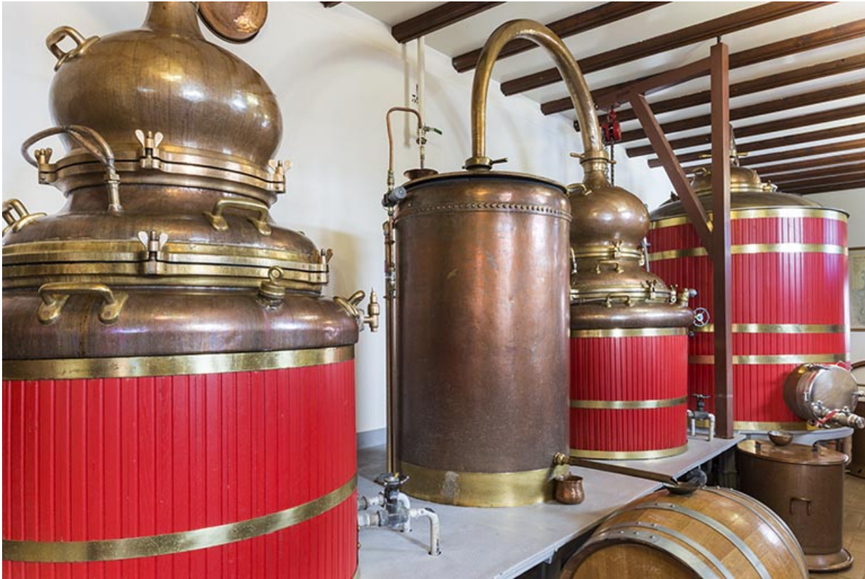
Alambics. Vue rapprochée des cucurbites et réfrigérants.