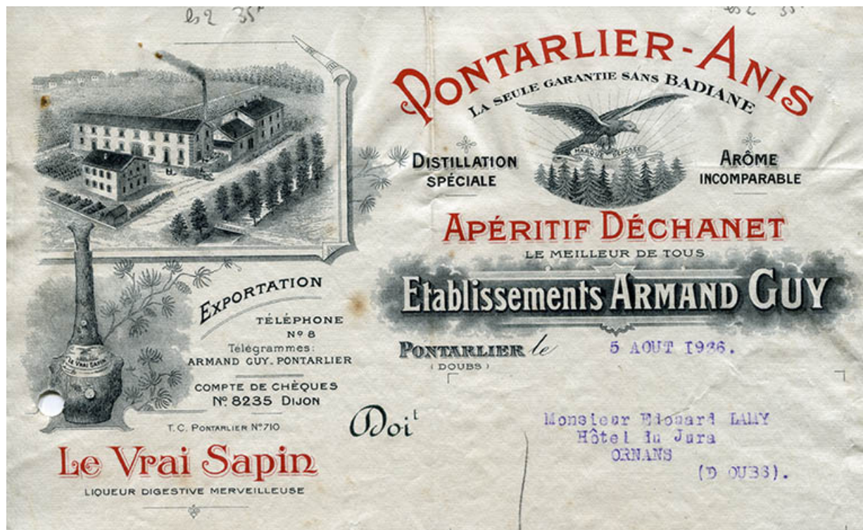
Papier à en-tête, s.d. [vers 1935]. 25, Pontarlier, 49 rue des Lavaux