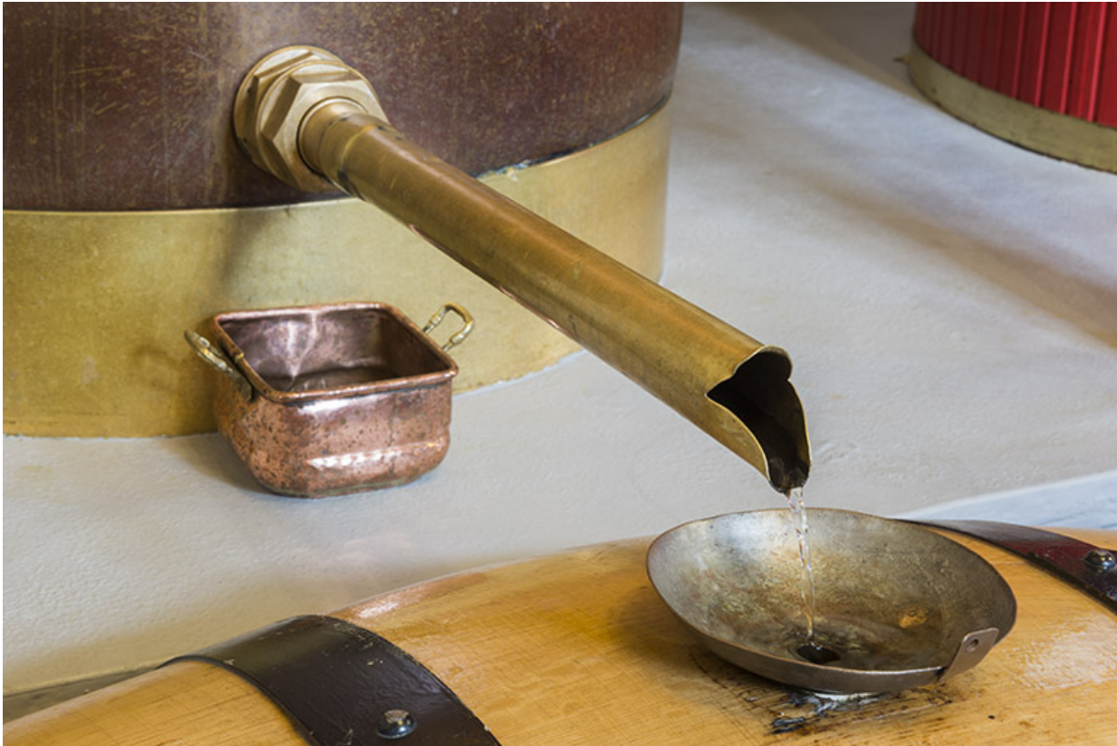
Distillat en sortie de l'alambic.