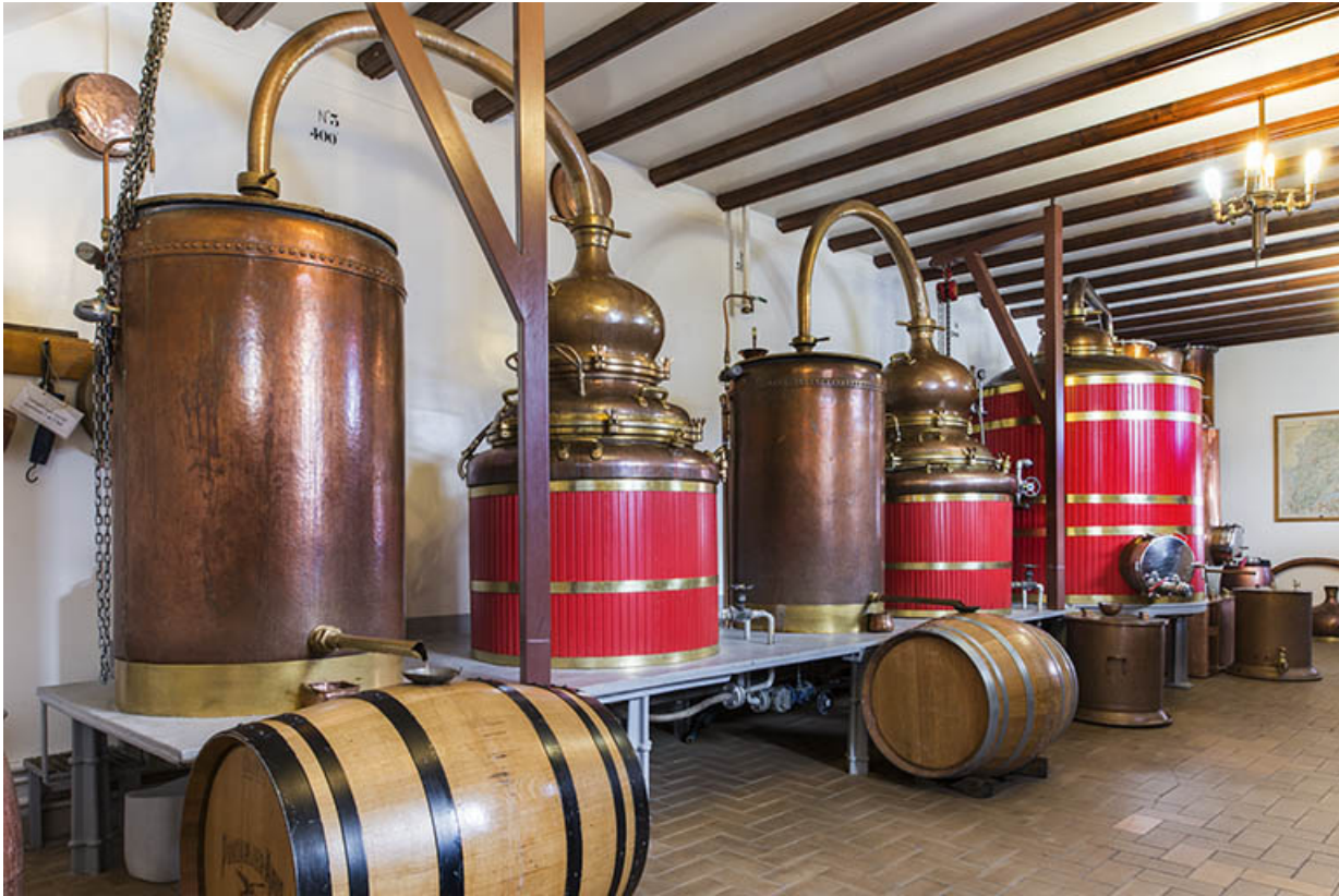
Salle de distillation. Vue d'ensemble.