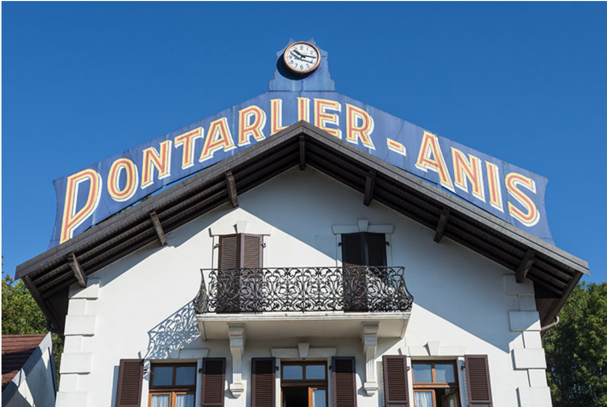
Pignon du bâtiment ouest, et l'enseigne de son produit phare.