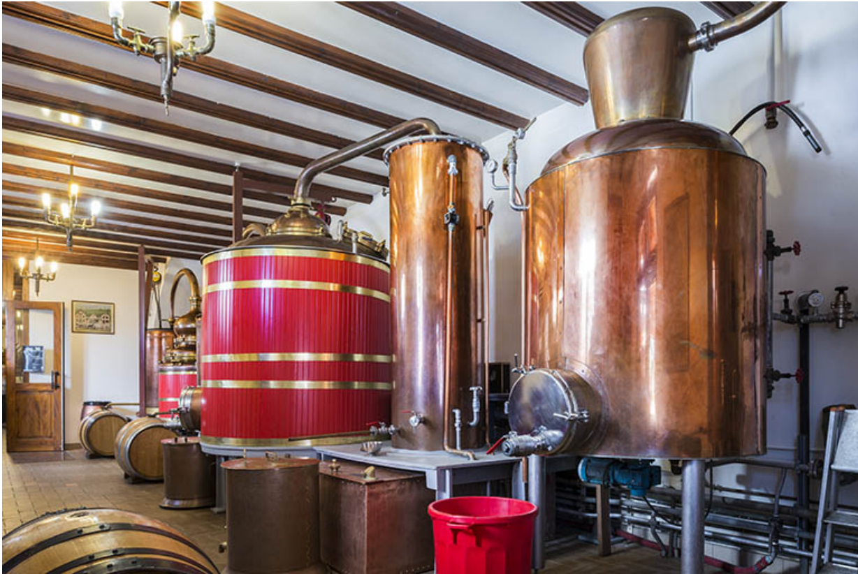
Alambics dans la salle de distillation.