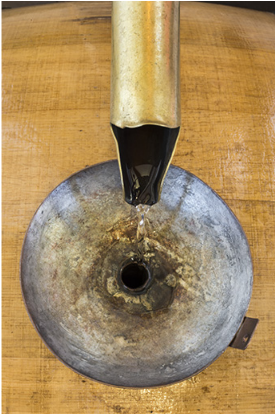
Distillat en sortie du réfrigérant : bec et entonnoir du tonneau.