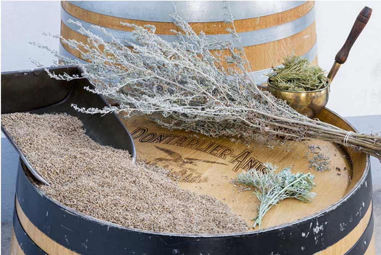
Echantillons de produits utilisés en distillation.