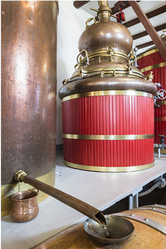
Distillation en cours. Ecoulement du distillat du réfrigérant. 25, Pontarlier, 49 rue des Lavaux