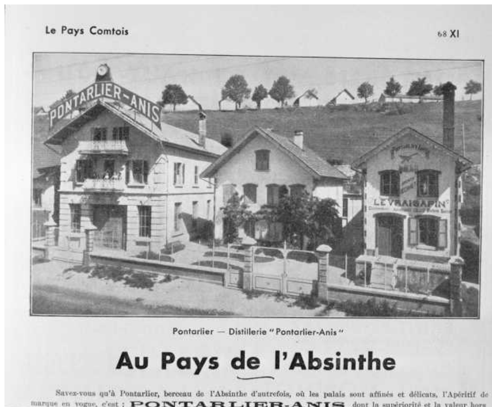
Pontarlier - Distillerie Pontarlier-Anis, 1935.