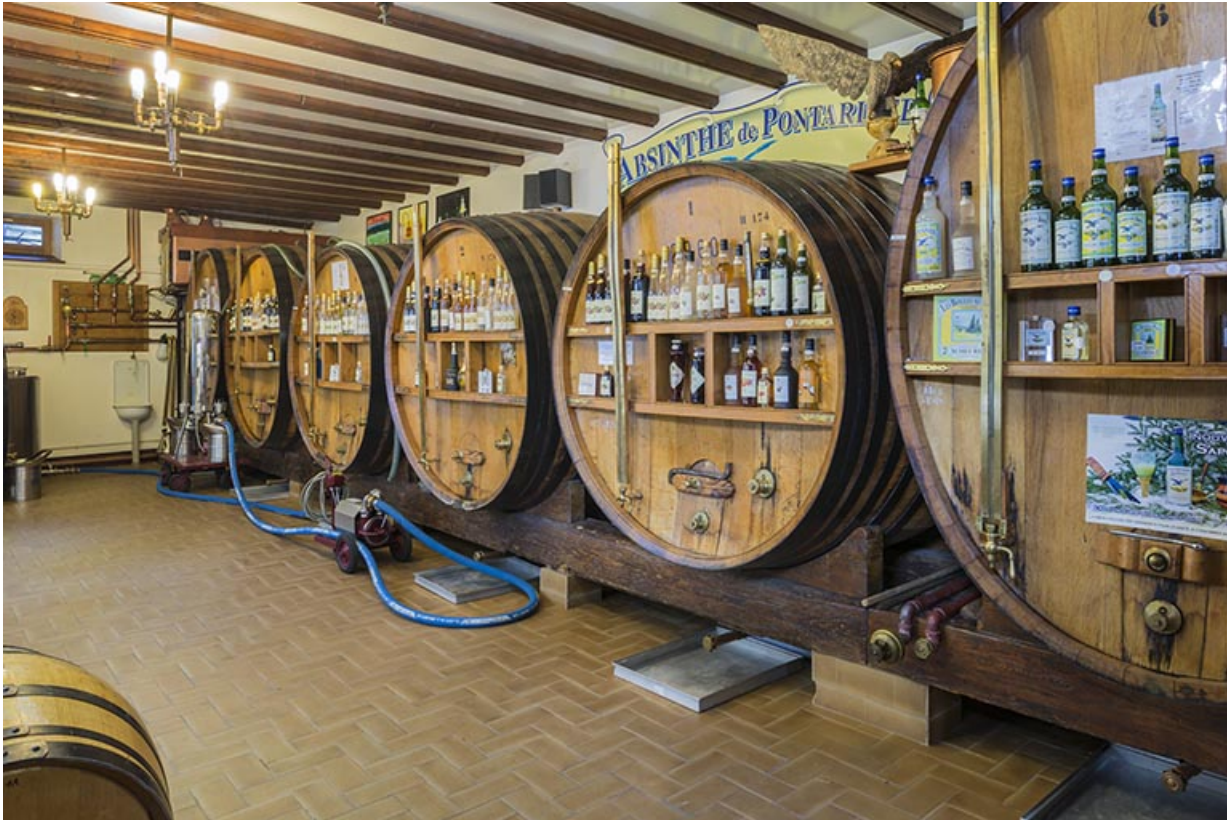
Intérieur du chai. Vieillissement en fûts de chêne.