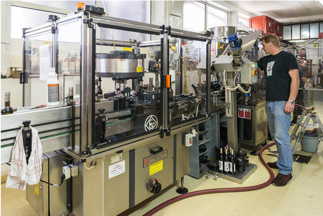
Unité de conditionnement (embouteillage, pose du bouchon et de la capsule, étiquetage).