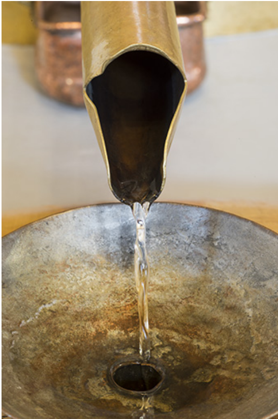
Bec verseur du réfrigérant et réception dans un tonneau.