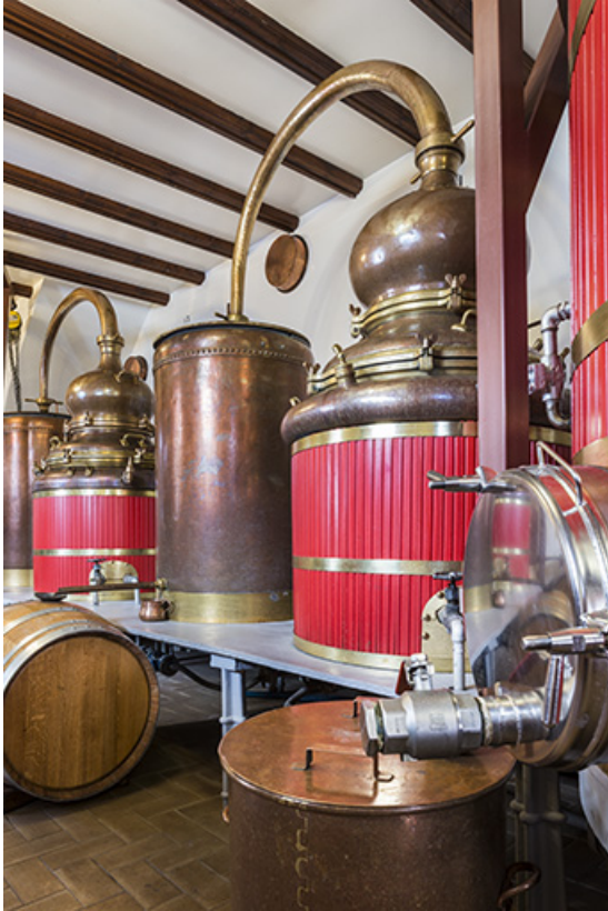
Alambics de 400 et 390 litres, provenant de l'ancienne distillerie Berthoud, à Pontarlier. 25, Pontarlier, 49 rue des Lavaux