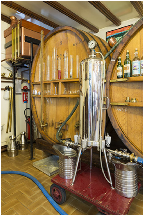
Foudres de vieillissement (contenance moyenne unitaire de 3000 litres).