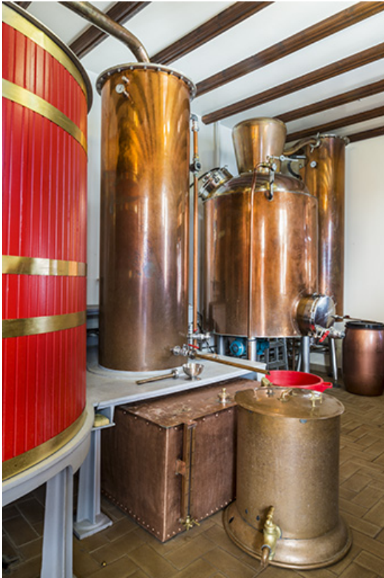
Alambic de 800 litres, de marque Rump (Strasbourg).