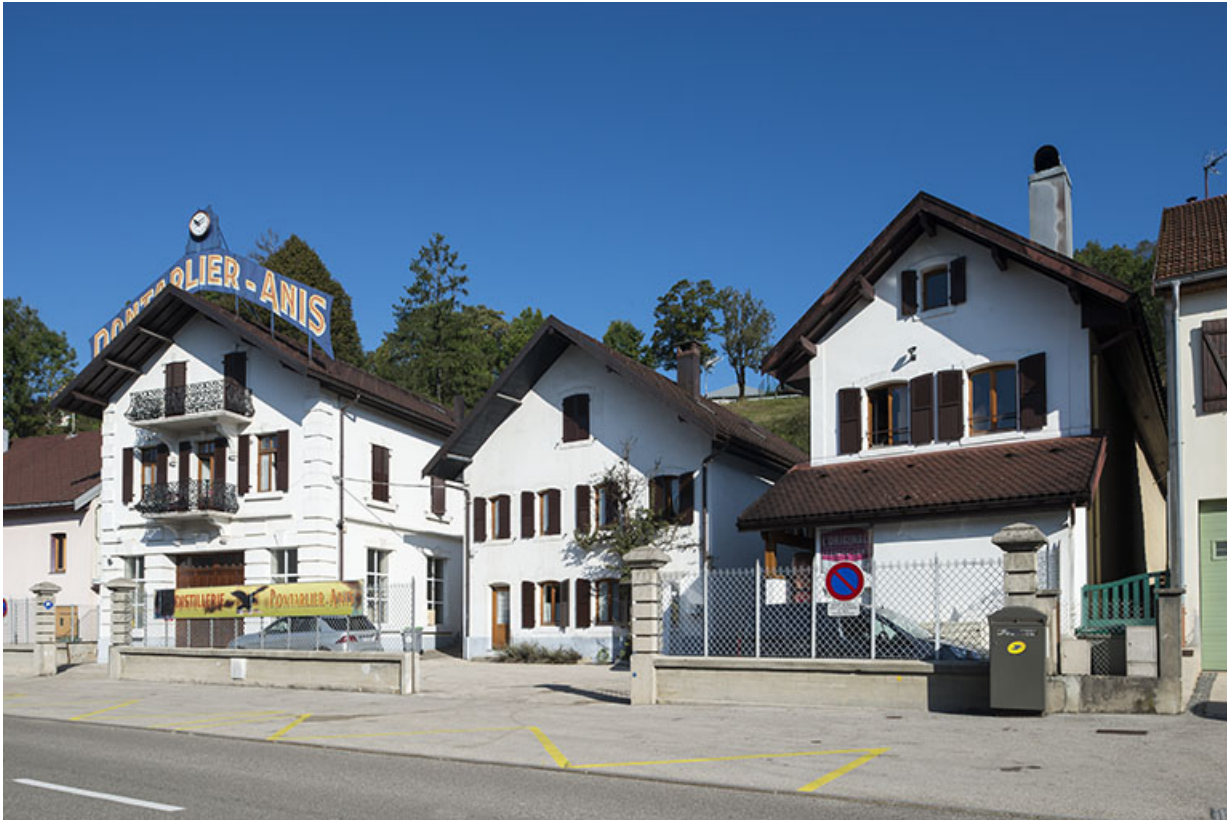
Vue d'ensemble depuis la rue des Lavaux.