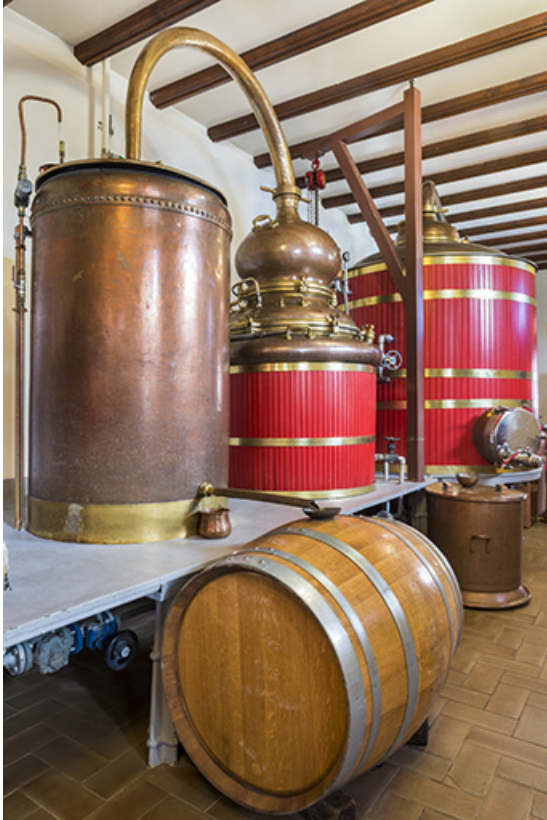
Alambics de 390 et 2000 litres.