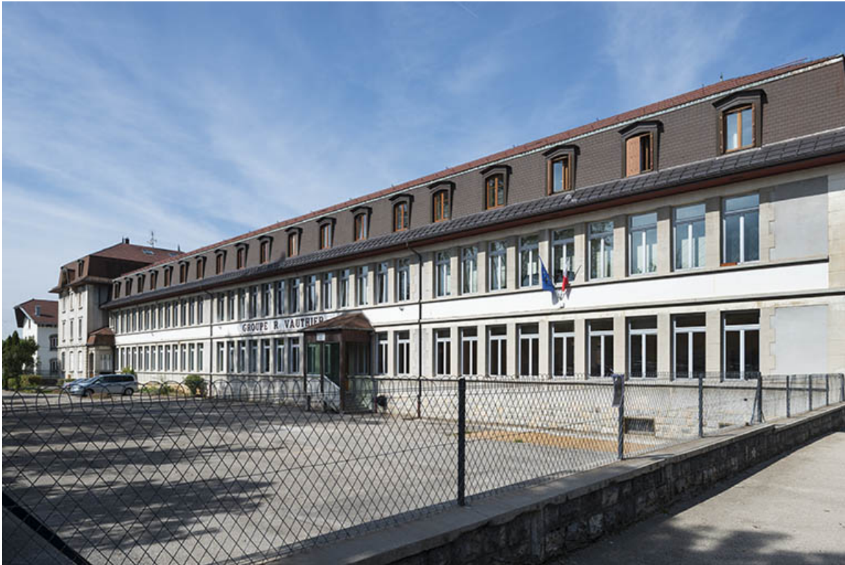
Façade sud vue de trois quarts droite.