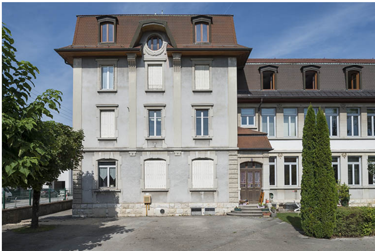
Pavillon ouest : bureau et logements.